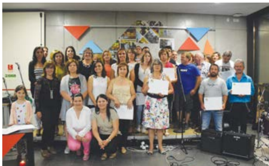
• Formandos que finalizaram o processo RVCC

de reconhecimento pelo esforço e mérito de cada um dos presentes inclu-