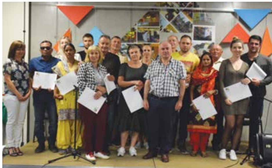
• Grupo que concluiu o curso de Português para Falantes de Outras Línguas