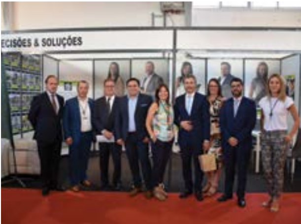
• Decisões & Soluções