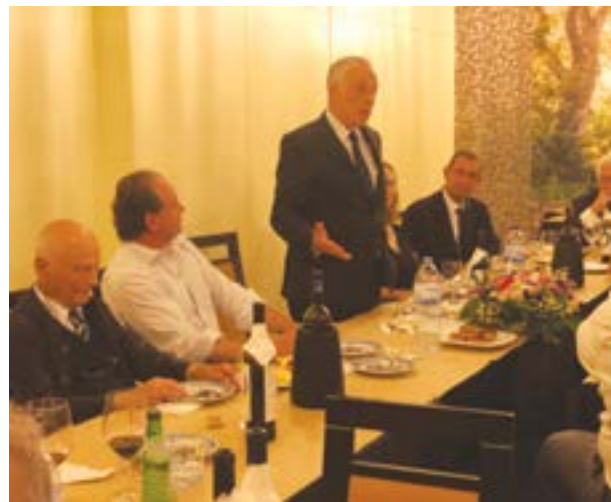
• O almirante durante a sua intervenção, no restaurante "O Tirol"

Foi o tema superiormente tratado pelo Almirante António Silva Ribeiro na 18ª Tertúlia do Marquês. O atual Chefe do Estado Maior General das Forças Armadas, a segunda figura na hierarquia militar de Portugal, é um Ilustre Pombalense que veio falar sobre um assunto muito importante, num pequeno círculo cultural da sua terra natal. E fez-lo de modo brilhante, revelando um profundo conhecimento sobre essa temática, bem como sobre a História