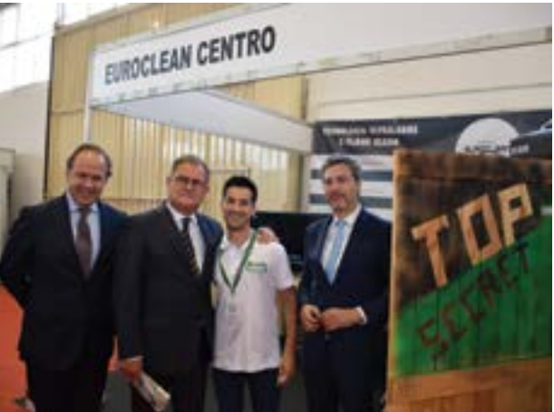
• Euroclean Centro, limpeza e depuração de filtros de partículas