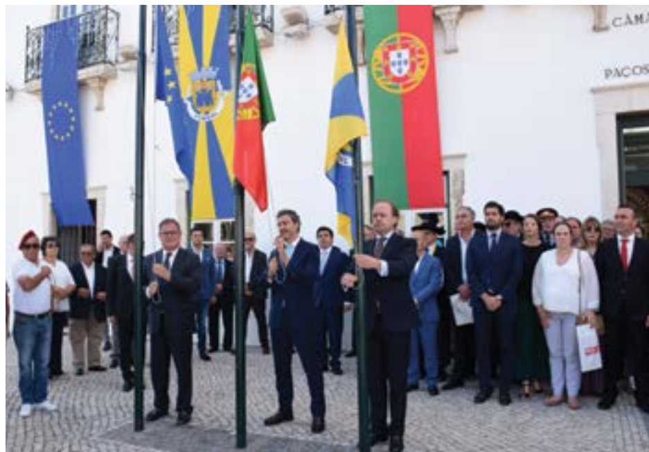
• Governantes e autarca no hastear das bandeiras, momentos antes da sessão solene

Para o secretário de Estado do Ambiente, e ex-autarca da Figueira da Foz, “é boa altura para, através da comunidade intermunicipal, de nos darem nota daquilo onde possa haver uma maior optimização dos recursos disponíveis”, concluiu.