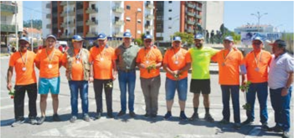
• Presidentes da Câmara e Junta de Pombal marcaram presença no início e final do evento

19 será o próximo desafio e já há equipas com vontade de voltar. Até 2020 e obrigado!