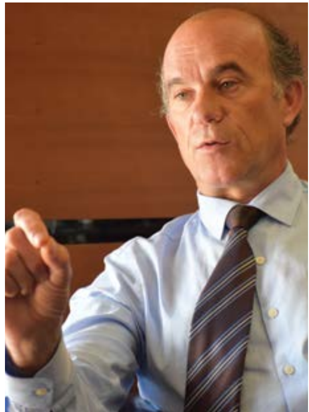
• O presidente destacou algumas das novidades desta edição

gues “são muitos os projectos para concluir e que irão trazer mais valia ao concelho, criando riqueza, atractividade e contribuindo para o desenvolvimento do território.” “Poderia falar, ainda, das obras que no âmbito do compromisso com as freguesias,