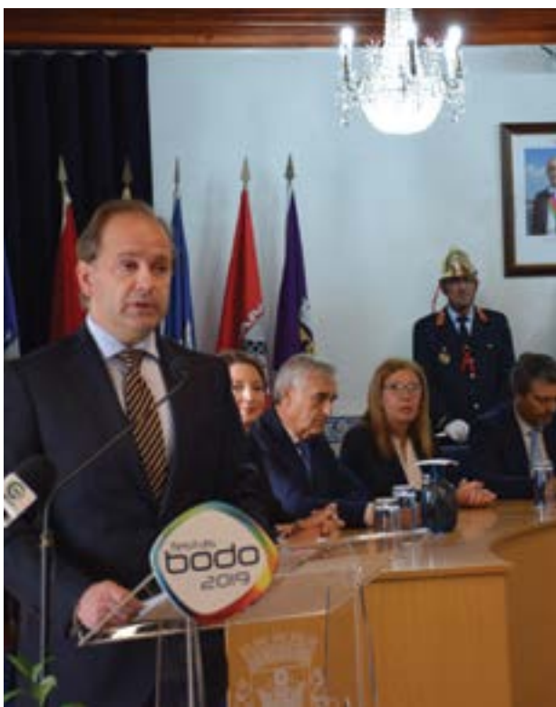
• Presidente enuncia um conjunto de acções na área do ambiente

O presidente da Câmara de Pombal iniciou o seu discurso enaltecendo Pombal como “o município mais azul da região Centro”, numa referência à distinção atribuída em 2018 pela Associação Bandeira Azul da Europa e pela Agência Portuguesa do Ambiente, que “reconhece o trabalho de educação ambiental desenvolvido pelo município durante a época balnear.”