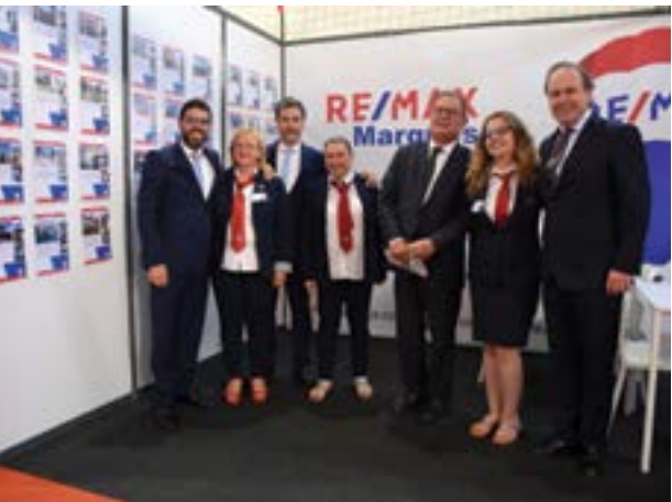
• Remax Marquês