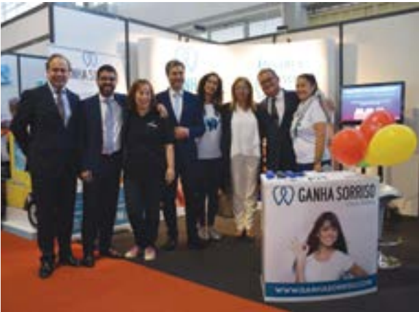
• Clínicas Dentárias Ganha Sorriso