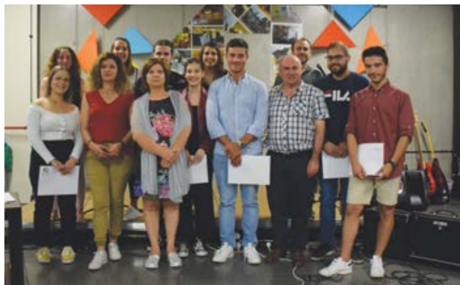
• Formadores e formandos do curso de Educação e Formação de Adultos