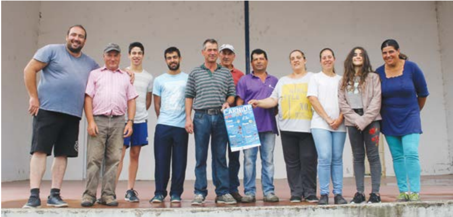
• O Organização do evento é composta por “22 elementos, sendo que 7 deles são emigrantes”

Entre 8 e 12 de Agosto todos os caminhos vão dar a Carnide, onde se realizam as tradicionais festas em honra de Santo Elías. Durante os cinco dias de celebrações há espaço para concertos, com a actuação da cantora Barbara Bandeira e dos alcobacenses The Gift, tempo para provar as iguarias da região, oportunidade de visitar a mostra de artesanato e, acima de tudo, há a espaço para encontros e reencontros.