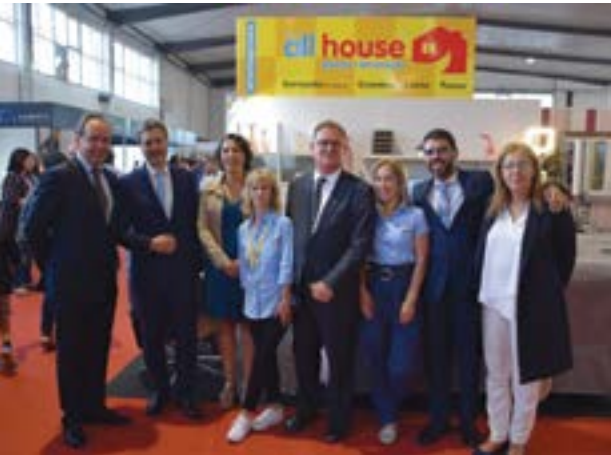
• Móveis All House voltaram a marcar presença