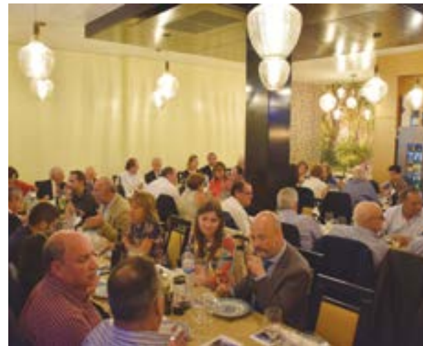
• Dezenas de convidados marcaram presença na tertúlia