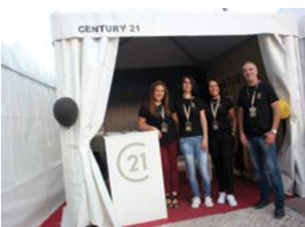
• Agência Imobiliária Century 21