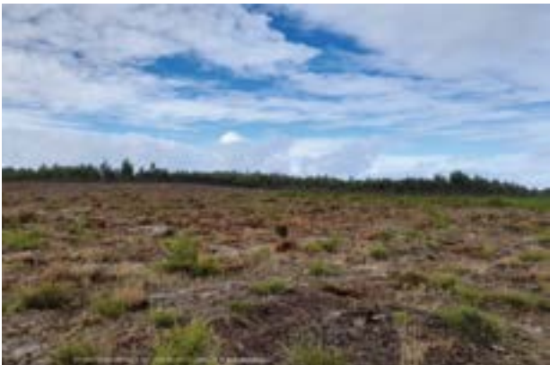
• futuro parque fotovoltaico da freguesia do Carriço, junto à povoação dos Alhais

A comissão política concelhia do CDS-PP considera que foi cometido um “crime ambiental” no terreno onde será construído o futuro parque fotovoltaico da freguesia do Carriço, junto à povoação dos Alhais, facto que, “nos últimos anos, não tem precedente no nosso território”.