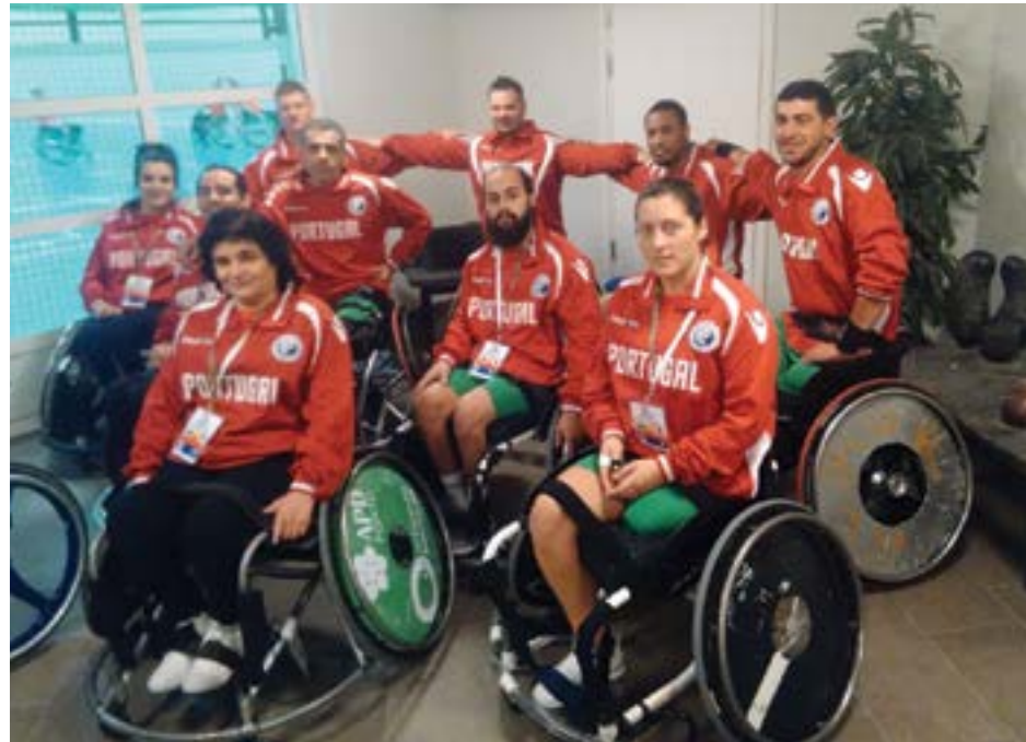
• A atleta natural do Carriço (à direita) juntamente com os colegas de equipa