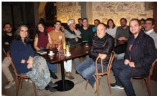
• O Café Liberal decorreu à mesa do restaurante Casa das Gatas