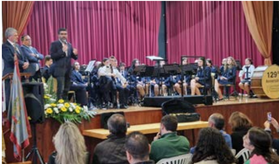
• Presidente da Câmara deixou a promessa de apoiar as obras e o intercâmbio cultural. O programa culminou com o cantar dos parabéns e o corte do bolo

ça presidente do presidente da Câmara, o dirigente lançou também o repto ao município para que apoie a obra, assim como a continuidade do intercâmbio entre a filarmónica vermoílense e a Banda de Laranjal Paulista, no Estado de São Paulo (Brasil), iniciada em 2017.