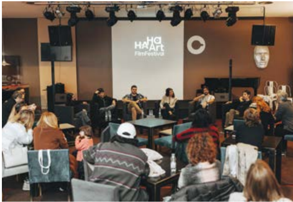
• O primeiro festival de comédia do país teve sempre casa cheia

Depois das seis sessões competitivas, onde foram exibidos 50 filmes, chegou a hora de anunciar os vencedores. Na categoria nacional, “Nada nas Mãos”, de Paolo Marinou-Blanco, conquistou os dois prémios em disputa: melhor filme e melhor realizador. O júri destacou “a forma como explora o humor negro e a metanarrativa”, além da “narrativa