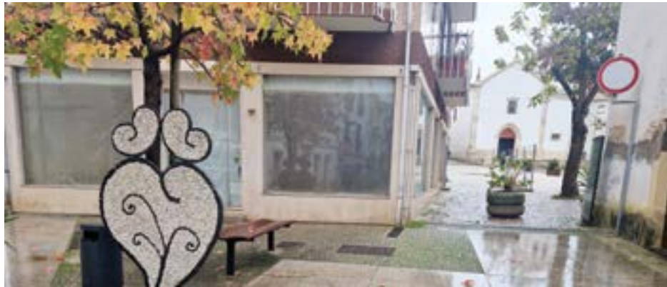
• Espaço Cowork de Pombal vai ser instalado nas antigas instalações da Sapataria Mónaco, em pleno centro histórico da cidade

Ambos os espaços de teletrabalho e coworking vão ser disponibilizados pelas autarquias, estando equipados com computadores, impressoras e acesso à Internet, refere uma nota da CIMRL. Estes projectos estarão divididos em áreas de diferentes tipologias que contemplam zonas privadas para videochamadas, áreas para reuniões e locais para a realização de apresentações ou acções de formação.