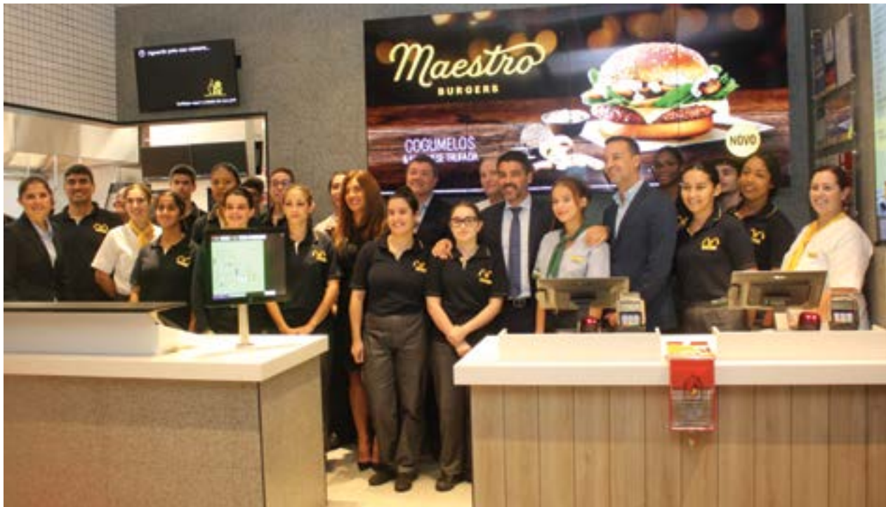
● A abertura do McDonald’s de Pombal permitiu criar 60 postos de trabalho, sendo a maioria dos colaboradores residentes no concelho

tado de “painéis solares em toda a cobertura do restaurante e do parque de estacionamento”, bem como do “mais inovador serviço” em termos de tecnologias para