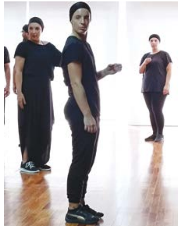
• O Pombal Jornal foi assistir a um dos ensaios do grupo

O espectáculo que agora estreia, conta com nove actores em palco, "desde gente que está no grupo há mais de vinte anos, até gente que está a entrar pela primeira vez". Não é segredo para ninguém que, desde há algum tempo, o TAP adoptou uma política de trabalhar com encenadores profissionais, assumindo o compromisso de os próprios elementos também terem um comportamento bastante profissional na forma como encaram cada novo projecto. Esta mesma reportagem foi realizada numa noite chuvosa, a meio