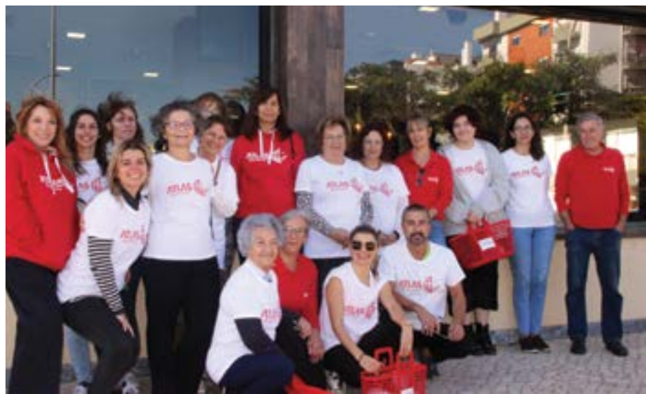
• Todos os sábados de manhã, cerca de duas dezenas de voluntários da Atlas percorrem as ruas de Pombal para entregar refeições quentes a 13 idosos

Tal como não seria possível sem os restaurantes beneméritos. E são 13 aqueles que semanalmente oferecem duas refeições quentes (Amigos da Velha Caroca, Churrasqueira Pérola dos Frangos, Churrasqueira Sem Penas, Churrasqueira Rainha do Frango, A Variante, Vintage, Cervejália, O Tapa, O Fidalgo, Tempero da São, Brisa Norte, O Paris e Pedro's). A estes somam-se mais três que