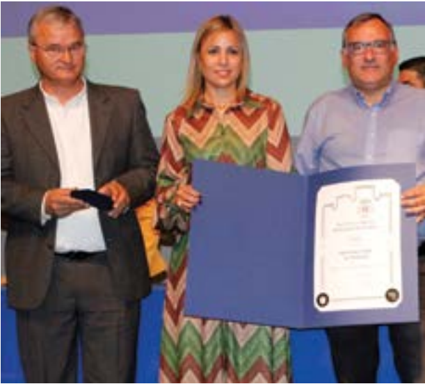
● O centenário Sporting Clube de Pombal foi agraciado com a Medalha de Mérito Associativo – Grau Ouro