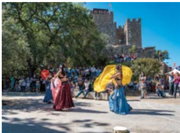
• A edição deste ano conta com mais momentos de animação

A abertura do mercado está marcada para as 10h00 de sexta-feira, com um cortejo com a participação de