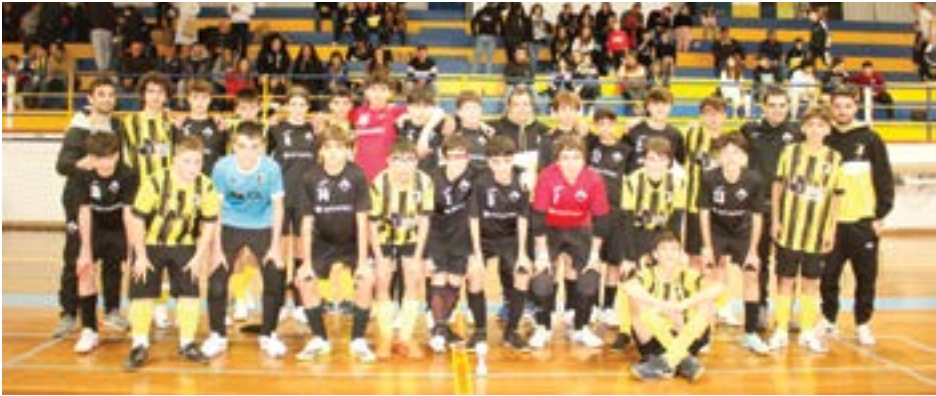
Em jogo bastante emotivo, os iniciados concluíram com um 4-5

Os iniciados do Louriçal treinados por Alexandre Pinheiro venceram em Coimbra, mas agora, as coisas inverteram-se. Es-tiveram em desvantagem