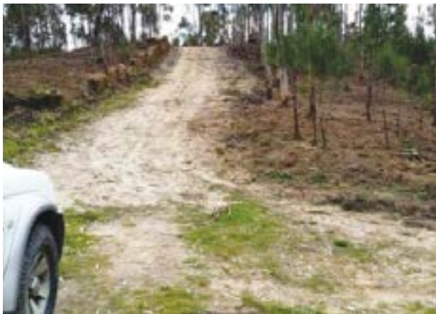
• Este ano, a limpeza está orçada em 489.750 euros

“As condições meteorológicas também são importantes, porque cada vez mais sabemos que podemos limpar hoje, [mas] se chover muito, essa primeira limpeza não