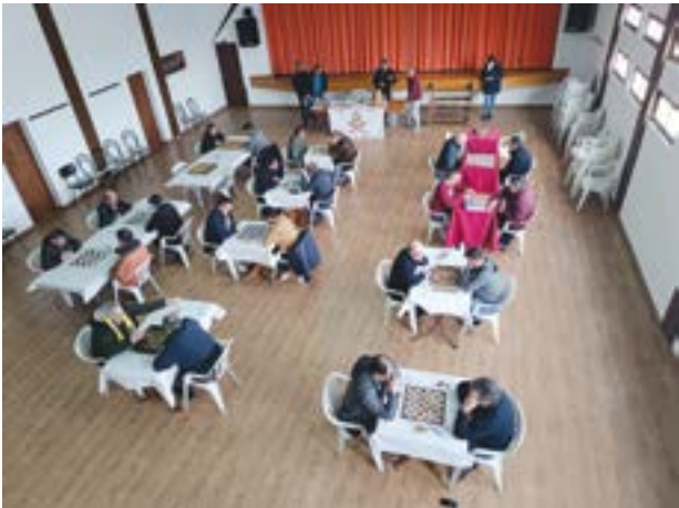
• As Damas teve honras de abertura, nas Cavadas