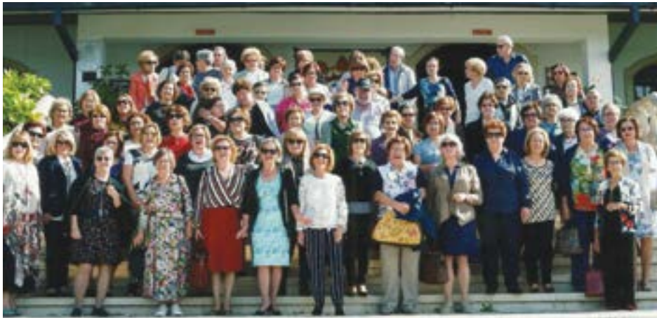
• O último encontro realizou-se em 2019