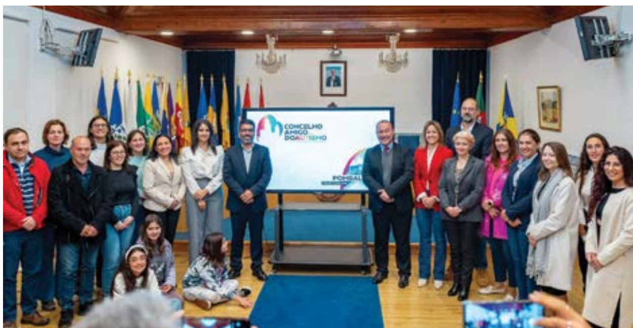
• Elementos dos órgãos sociais do PARA, autarcas e convidados

Pombal é o embrião de um projecto-piloto que está a ser desenvolvido pela mão da Associação PARA - Projecto de Apoio e Recursos para o Autismo, com o apoio do Município e do Instituto Nacional de Reabilitação. O “Concelho Amigo do Autismo” foi oficialmente apresentado a 2 de Abril, Dia Mundial da Consciencialização do Autismo.