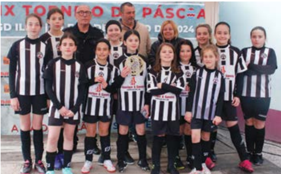
• Equipa feminina do Arcuda de Albergaria dos Doze