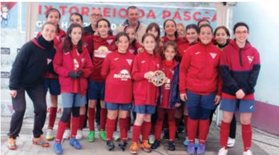
• Conjunto de infantis do Grupo Desportivo da Ilha que terminou no 2.º lugar