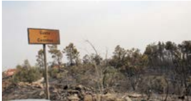
• Abiul (que foi fustigada pelos incêndios em 2022) volta estar na lista

No despacho publicado já no passado mês de Fevereiro em Diário da República, na selecção dos territórios “mantiveram-se os critérios adoptados desde 2022, que incorporam as componentes de perigosidade conjuntural de incêndio rural e de valor dos ecossistemas. Como resultado, foram agora identi-