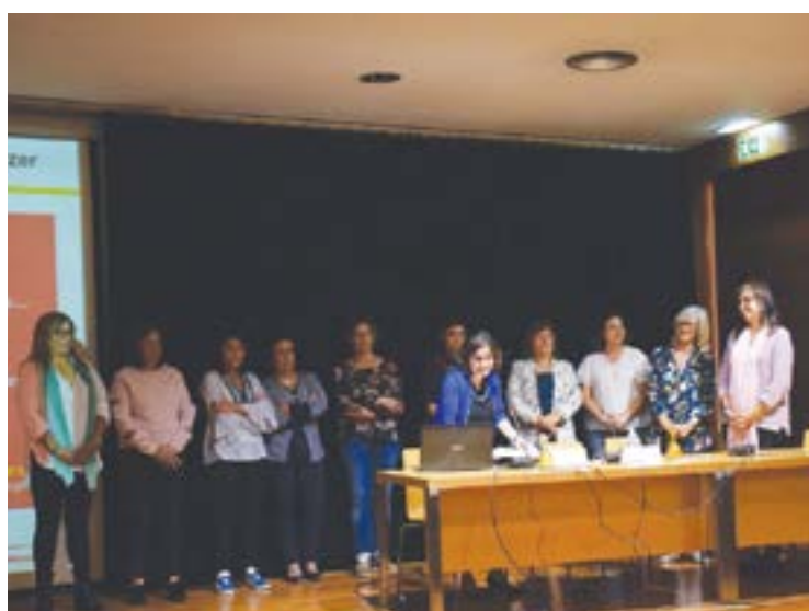
• Profissionais que integram a ELI de Pombal

“A intervenção precoce junto de crianças dos zero até aos seis anos de idade, com alterações ou em risco de apresentar alterações nas estruturas ou funções do corpo”, tendo em linha de conta o seu normal desenvolvimento, “constitui um instrumento político do maior alcance na concretização do direito à participação social dessas crian-