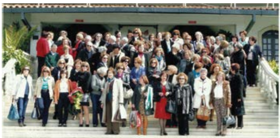
• O evento será no próximo dia 25, pelas 12h30, no Restaurante Manjar do Marquês.