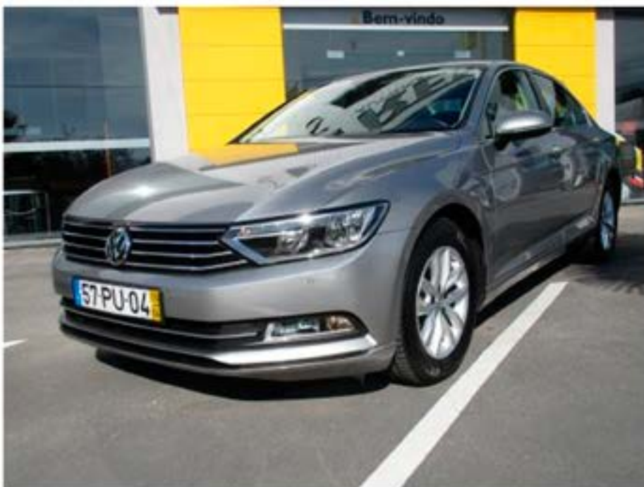
VOLKSWAGEN PASSAT 2.0 TDI DSG CONFORTLINE BM

AutoMecânica da Confraria SA COMÉRCIO E REPARAÇÃO DE AUTOMÓVEIS