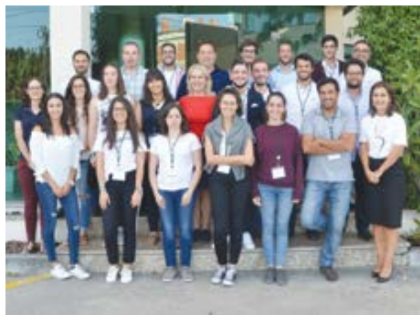
• Grupo que participou nas diferentes acções de formação

Numa organização do Rotary Club de Pombal, com apoio do Rotaract e do Interact, decorreu em Pombal, entre os dias 4 e 7 deste mês, o RYLA (que, em português, significa Prémio Rotário de Liderança Juvenil), um programa intensivo de formação nas áreas da liderança e cidadania, destinado a jovens em início de carreira. Nele participaram cerca de duas dezenas de jovens, com idades compreendidas entre os 20 e os 26 anos, inscritos pelos Rotary Clubs de Ansião, Coimbra-Olivais, Figueira da Foz, Leiria, Marinha Grande, Montemor-o-Velho e, como não podia deixar de ser, Pombal. No primeiro dia, houve lugar a uma formação outdoor, na Aldeia do Vale, com orientação, caminhada, dinâmicas de grupo e desafios à capacidade para a tomada de decisões, sempre num espírito de são convívio e interacção permanente entre os participantes. No segun-