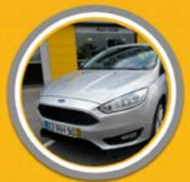
FORD FOCUS 1.5 TDCI TREND +