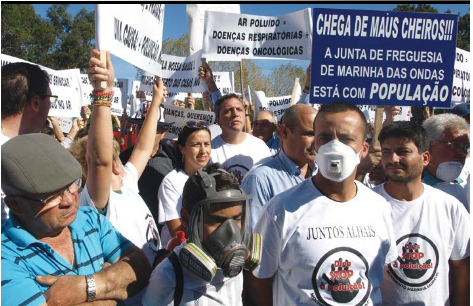
• O presidente da Junta de Freguesia do Carriço mostrou-se solidário com a população do norte da freguesia, nomeadamente da localidade de Alhais