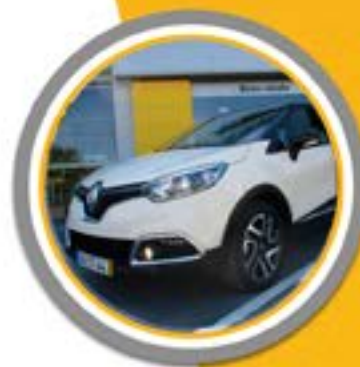
RENAULT CAPTUR 1.5 DCI EXCLUSIVE