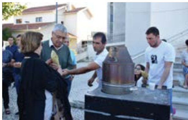
• A castanha é a 'rainha do certame'

petiscos típicos da região, os produtores trazem as tão aguardadas castanhas, e outros frutos secos, a criança pode aproveitar o dia para participar em diversas actividades, no âmbito da programação do Bodo Alta.Mente, e há tempo para um ‘pé de dança’, ou assistir a um espectáculo de magia,