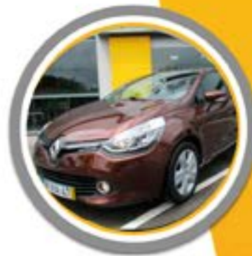
RENAULT CLIO 1.5 DCI DYNAMIQUE