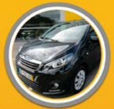
PEUGEOT 108 1.0 VTI- ACTIVE

VISITE-NOS: BARRAÇÃO, POMBAL E MARINHA GRANDE // www.amconfraria.com