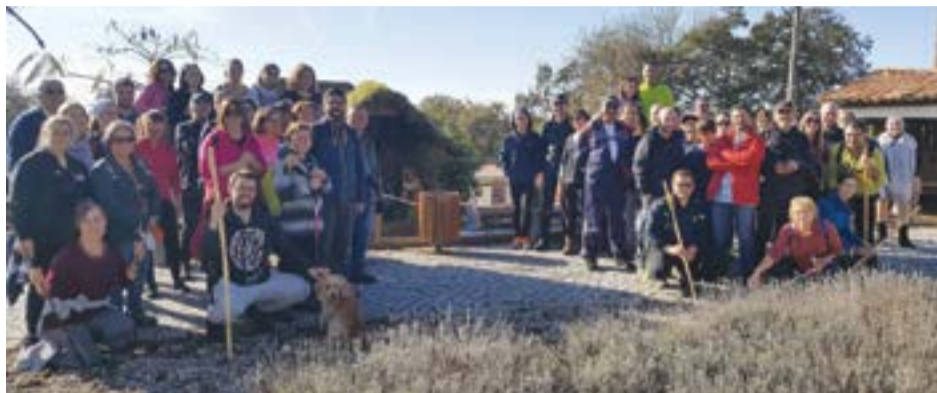
• O grupo posou para a foto junto ao presépio da Arroiteia

A serra de Sicó continua a ser um palco de eleição para quem gosta do contacto com a natureza. Um espírito que esteve bem patente ao longo dos cerca de 15 quilómetros percorridos pelas 60 pessoas que, este domingo, aceitaram o desafio da Junta de Freguesia de Pombal para participar numa caminhada que atravessou as aldeias do Vale e da Arroiteia.