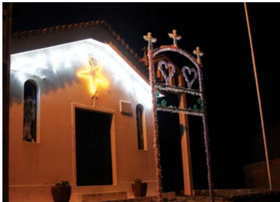
• Capela no lugar dos Poios

Para Paulo Duarte, a medida já deveria ter sido implementada no ano anterior, “mas não foi possível, porque a tomada de posse dos novos órgãos autárquicos foi muito em cima da