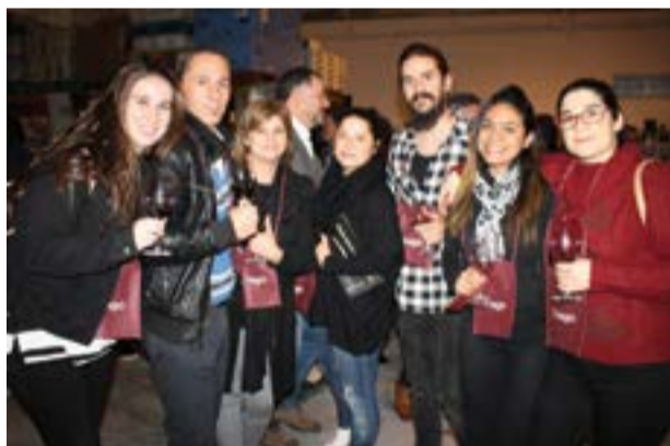
• Equipa de colaboradores e proprietária do restaurante Vintage