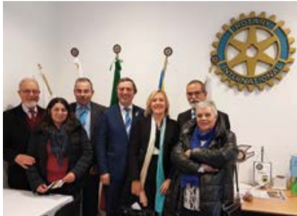
• A visita incluiu uma paragem na sede do Rotary Club de Pombal