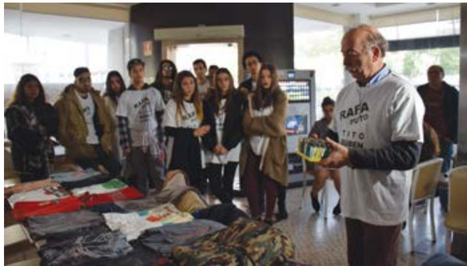
• Passados dois meses do acidente, os amigos ainda não superaram do choque

“Há coisas que já distribuímos: demos prioridade aos primos, e logo de seguida aos amigos”, afirma