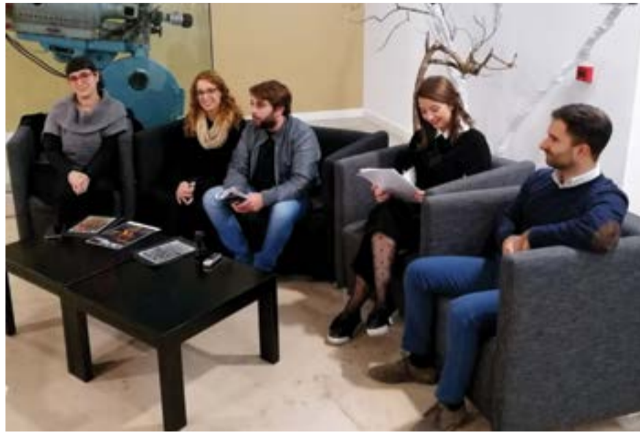
• O programa foi apresentado em conferência de imprensa

Com um número máximo de 15 formandos, a iniciativa é aberta a todas as pessoas maiores de 16 anos, "simples curiosos, amantes do teatro, com ou