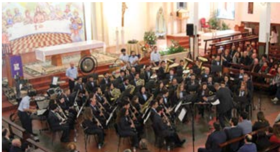
• A banda actuou, pela primeira vez, na Igreja Matriz na Ilha

A Filarmónica Ilhense encerrou com chave de ouro o ano de 2018. Depois do 94º aniversário, que juntou cerca de 400 pessoas no dia 2 deste mês, no salão paroquial, a instituição desafiou a comunidade a assistir ao Concerto de Natal, marcado para domingo passado, dia 9, na Igreja Matriz (o primeiro ali realizado). Mais uma vez, a população não se fez rogada perante o convite e, prova disso, está