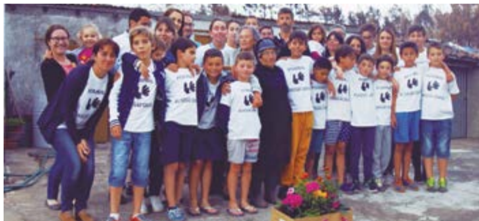
• Para além da vertente desportiva, a associação abraça também causas sociais

mos um crescimento entre 70 a 80 % de procura”, passando, assim, “de 70 crianças a frequentar a Associação, para as 130 jovens”. Um “boom enorme”, que se deve, “fundamentalmente ao facto das pessoas acreditarem que o nosso projecto tem qualidade: para além da qualidade desportiva, tem também uma qualidade humana muito grande”,