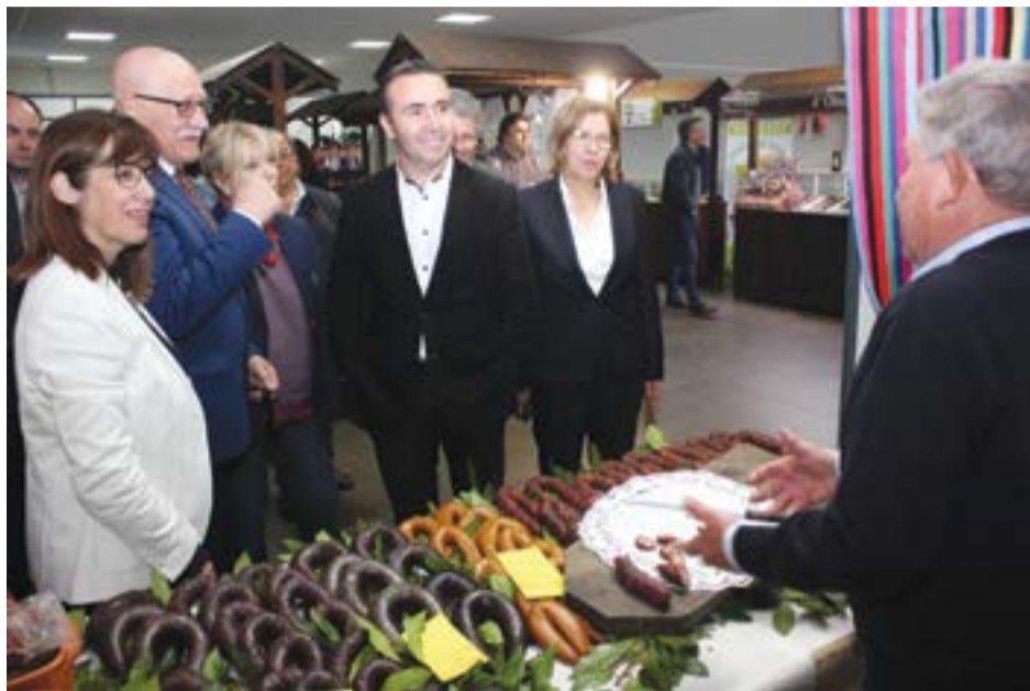
• Visita aos expositores, na inauguração da primeira edição do festival

A Junta das Meirinhas está a desafiar os fregueses a semearem favas, para serem servidas no segundo Festival da Fava, agendado para 3, 4 e 5 de Maio do próximo ano.