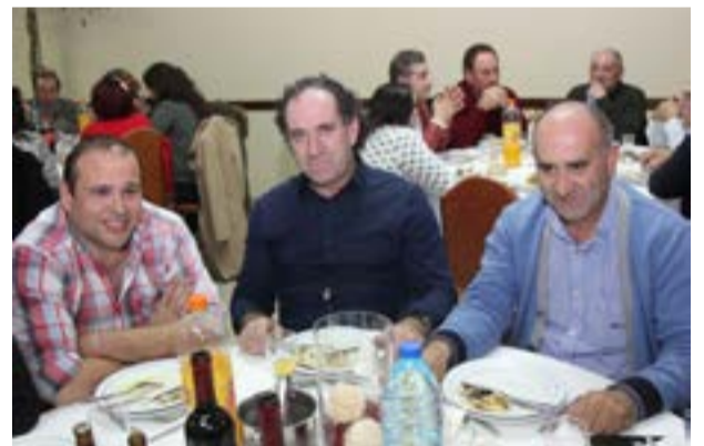
• O evento que decorreu no concelho de Ansião contou com vários taxistas de Pombal

Quatro anos depois e pelo triplo do valor