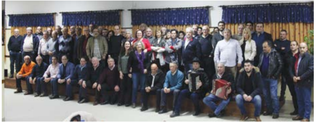
• O evento contou, este ano, com mais participantes

A recepção está agendada para as 20 horas, e a noite prolonga-se ao som do grupo musical Big Jovem. As inscrições devem ser feitas através dos contactos 962 354 136, 965 813 272, ou aos domingos à tarde, na Associação.