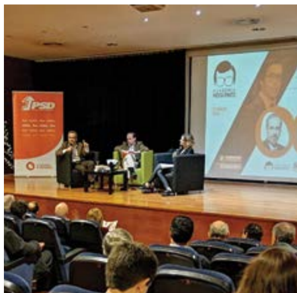
● Paulo Rangel lamentou o “desprezo” dos cidadãos em relação aos eleitos

Depois de Pedro Pimpão, que é também presidente da Junta de Freguesia de Pombal, ter feito o enquadramento sobre a actividade da Assembleia da República, Fernando Negrão enalteceu a importância do PSD no sistema político português “Não fora o PSD e teríamos um país muito diferente, para pior”, disse, realçando que o partido “marcou a história de Portugal”.