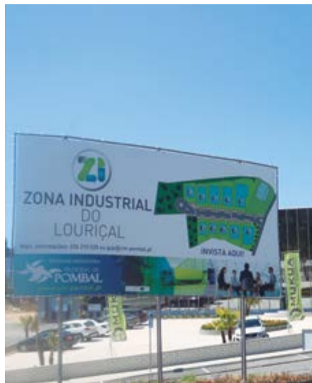
• Os lotes serão vendidos a 10 euros o metro quadrado

Por outro lado, a mesma proposta considera “pertinente” que a Câmara inicie um procedimento com vista à elaboração de um re-