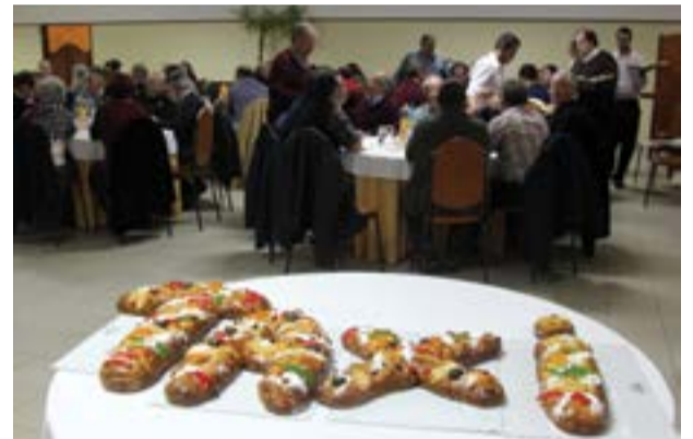
• O jantar anual dos taxistas contou com o apoio da Pastelaria Pombal Doce, que ofereceu o bolo rei, da Redibrinde, SicóDrink e Vulcal.

Apesar das reivindicações não terem sido ouvidas até agora, os taxistas prometem não baixar os braços e manter-se activos nesta luta por melhores condições.