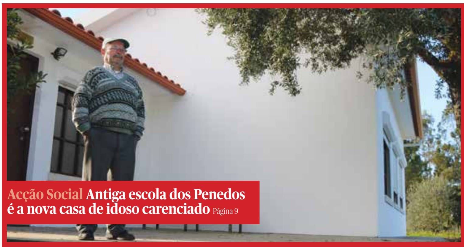
Acção Social Antiga escola dos Penedos é a nova casa de idoso carenciado Página 9