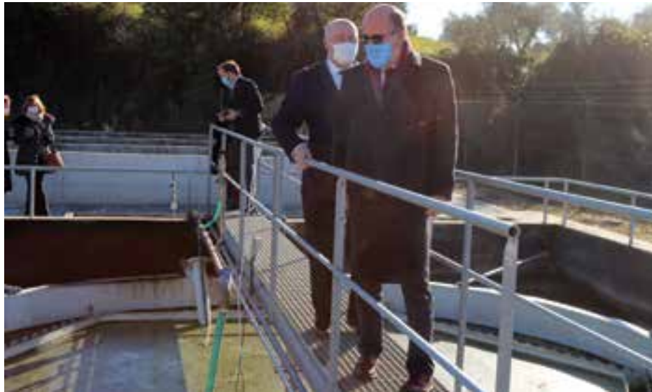
• Ministro iniciou em Pedrogão do Pranto na Vinha da Rainha, na visita a ETAR

Dos projectos a lançar pelo Município de Soure, no domínio do Ambiente e cujo valor global ronda os cinco milhões