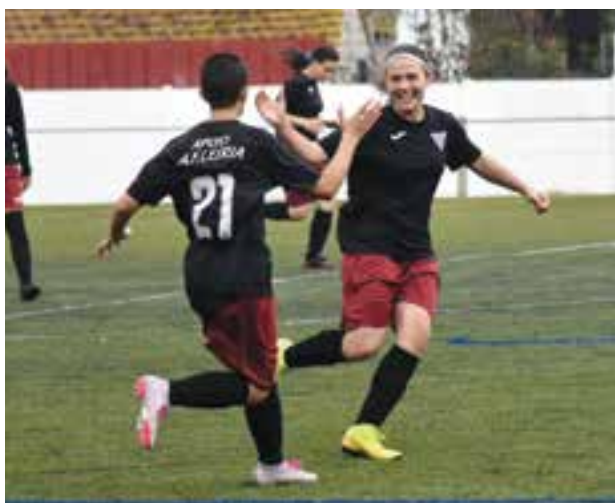
• A Ilha jogou no passado domingo e venceu a Estação