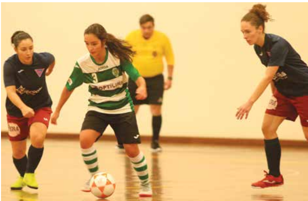
• O Núcleo Sportinguistas de Pombal voltou a ser superior ao Ilha, no pavilhão da Bajouca, agora, para o campeonato distrital

Último fim-de-semana apenas com três jogos de futsal nas provas distritais