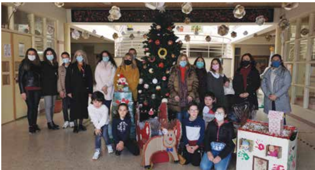
• Direcção da escola, professores, alguns dos alunos e representantes das instituições

Iniciativa solidária ajudou famílias na quadra natalícia