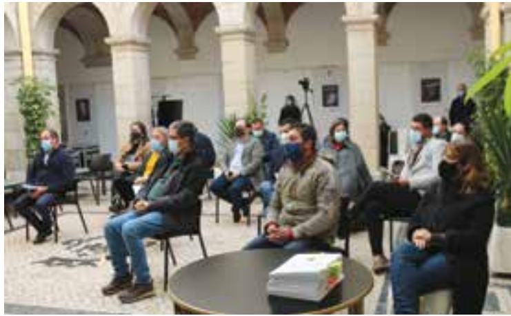
• Vereadores, técnicos e presidentes de junta na cerimónia

Em 2021, as juntas de freguesia do concelho de Pombal passam a ser responsáveis por um conjunto de novas competências em vários domínios, potenciando ainda mais a sua capacidade de actuação. Assim, assumem a gestão e manutenção de espaços verdes; limpeza das vias e espaços públicos; manutenção, reparação e substituição de mobiliário urbano; realização de pequenas reparações nas escolas do pré-escolar e do primeiro ciclo do ensino básico e manutenção dos respectivos espaços envolventes; autorização para realização de acampamentos ocasionais; autorização para realização de fogueiras e do lançamento e queima de artigos pirotécnicos, bem como a autori-