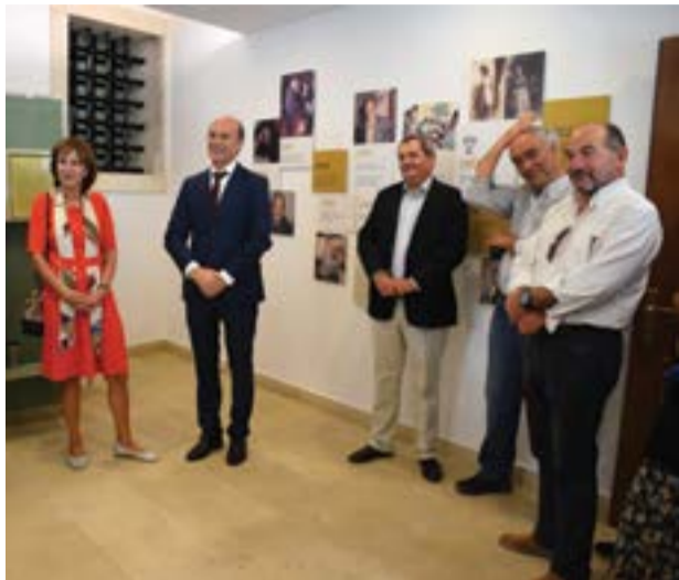
• Espaço museológico está localizado no antigo edifício da Cadeia