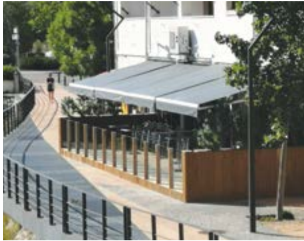
• A esplanada foi removida nas vésperas das Festas do Bodo