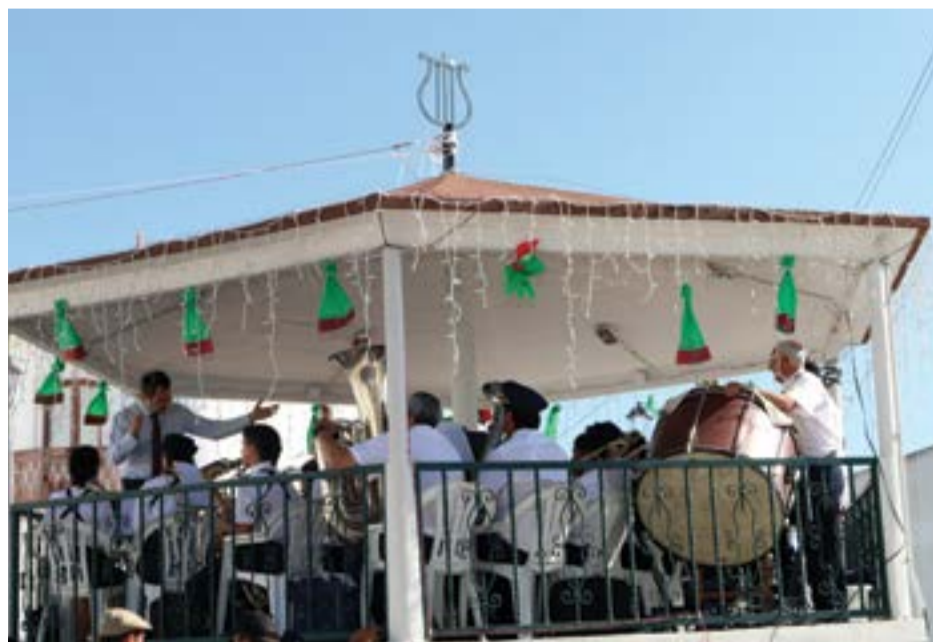
• O coreto de Abiul foi o primeiro a receber o projecto do INATEL Leiria