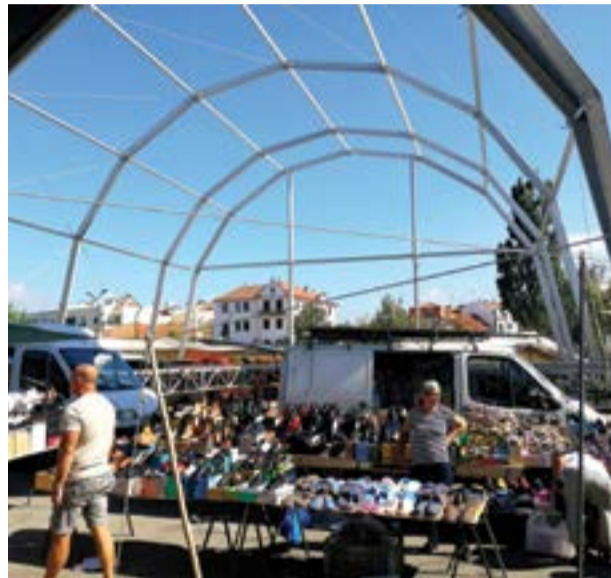
• Uma semana depois das festas, o palco mantinha-se no local

“Uma vergonha e uma falta de planeamento e de organização”, contou-nos um dos feirantes que teve de improvisar para instalar a