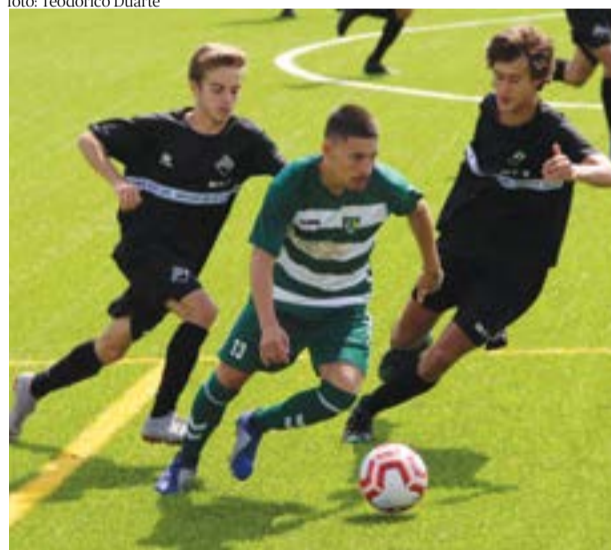
• O Pombal empatou a zero golos antes do jogo de abertura