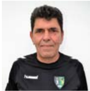
• Trindade • Treinador Guarda-Redes