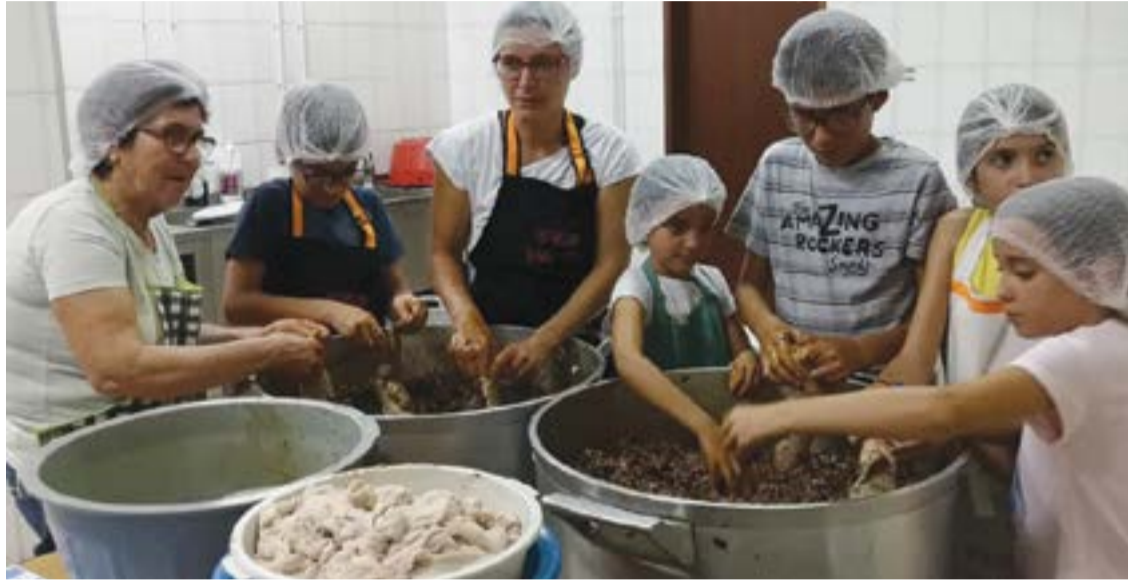
• Neste segundo capítulo, os jovens terão um maior envolvimento