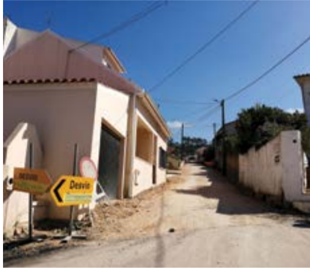
• A derrapagem do prazo já ultrapassa os 240 dias

O vereador independente recordou que, aquando do último adiamento do prazo, “disse que o 28 de Julho seria uma miragem”, frisando