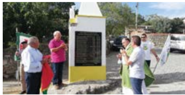
• Iniciativa culminou com a homenagem aos ex-combatentes

Nativos e Familiares da Aldeia do Vale realizou-se no passado sábado, 10 de Agosto, e juntou várias dezenas de amigos e conhecidos para um dia cheio de animação. O evento ficou marca-