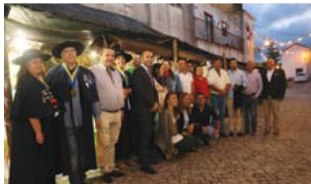
• Comitiva na visita aos expositores no dia da inauguração