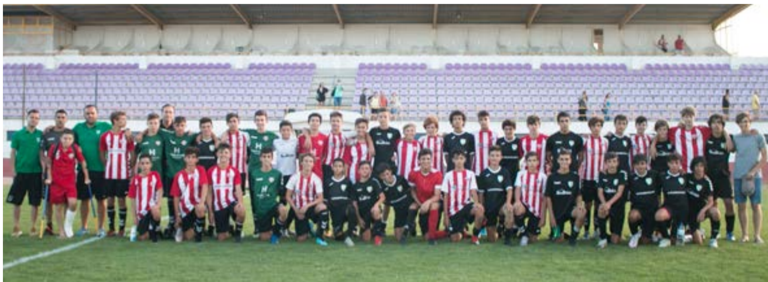
• O Louletano esteve na Pelariga de 2 a 4 de Agosto e a Pelariga retribuiu a visita de 8 a 11 de Agosto, numa sinergia de esforços que deixou os dois emblemas satisfeitos