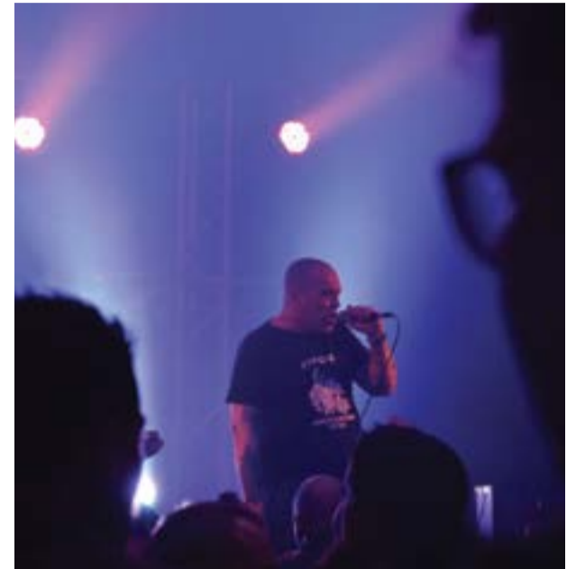
• Actuação dos Mata Ratos

Associação Desportiva de Acção Cultural da Charneca (ADAC) comemorou mais um aniversário no passado sábado, 9 de Fevereiro, com uma noite que aliou a música aos reencontros e juntou muitos amigos. Quem passou por lá não ficou indiferente ao facto de uma casa com 44 anos manter um espírito tão jovem e cheio de energia.