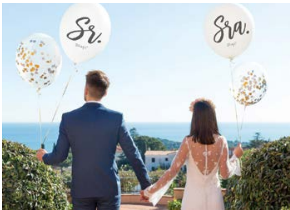
• Concelho de Pombal regista menor número de casamentos e divórcios também diminuem

INE INDICA QUE EM 2017 FORAM DECRETADAS 97 DISSOLUÇÕES DE CASAMENTOS, MENOS 20 DO QUE EM 2011