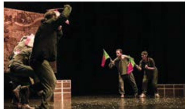
• A peça “Lusiadas”, do TAP, marca o arranque do evento

Nos dias 22, 23 e 24, será a vez da companhia S.A. Marionetas apresentar o espectáculo “A Farsa do Sapa-