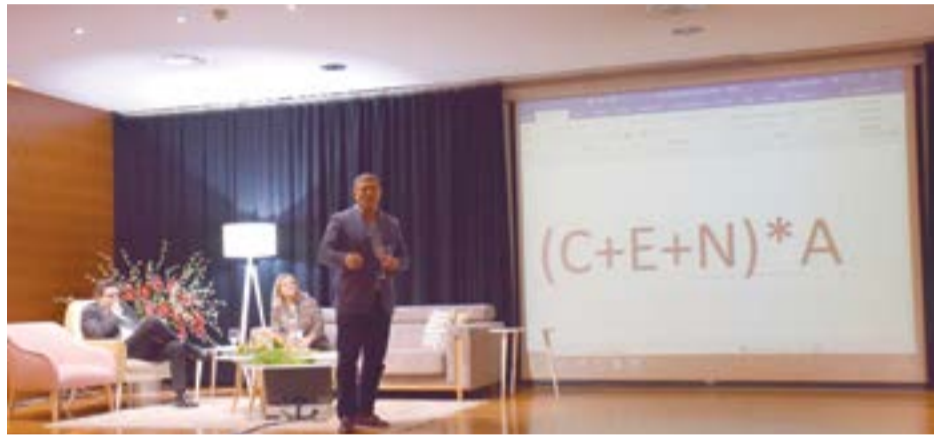
• A iniciativa “Inspira-te +” contou com a presença dos Business Angels da versão nacional do programa Shark Tank

“Quando os meus alunos me perguntam quais são, afinal, as características de um empreendedor”, o presidente da Comissão Executiva no Grupo NOV explica que “é essencial ter atitude, ser humilde, saber comunicar, ser mobilizador de equipas para cumprir a visão, saber acompanhar e ter talento”, sendo que o “talento é a combinação de conhecimento, fazer e querer”, por isso “não basta ter conheci-