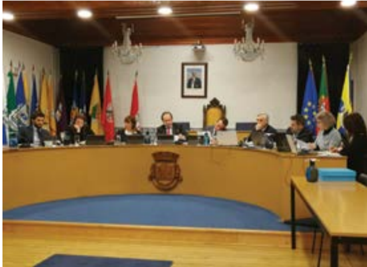
• O assunto foi abordado na última reunião do executivo

"Da análise do currículo da pessoa indica, apesar de mencionar o facto de ter integrado os anteriores CLDS como psicóloga, não se conseguem retirar competências de gestão, coor-