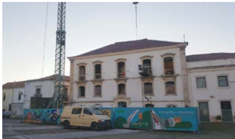
• A pedido do empreiteiro, o prazo foi prorrogado até 30 de Abril

No edifício funcionou, durante vários anos, os edifícios do Serviço de Finanças, que