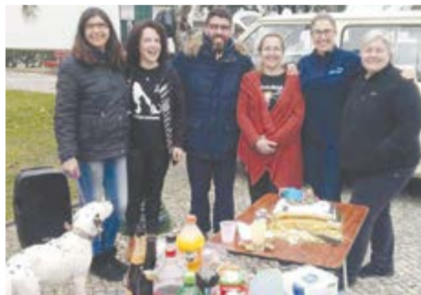
• O presidente da Junta marcou presença no aniversário

directamente “toda a população do concelho de Pombal, e concelhos vizinhos”. A execução do projecto implica um orçamento que ronda os 100 mil euros, que objectivamente pretende “contribuir para a saúde pública, promover comportamentos cívicos e ecológicos, próprios de sociedades evoluídas, como queremos que a nossa seja”, sem esquecer que o “Bem-Estar-Animal está, cada vez mais, presente na sociedade” e pretende, ainda, “solidificar a bandeira de Pombal como Município sustentável”, lê-se na apresentação do projecto. No entanto, e mesmo que a proposta não seja a vencedora, “em Outubro 2018”, a Ajudanimal “adquiriu o seu próprio terreno, estando agora em fase de angariação de fundos para a construção da