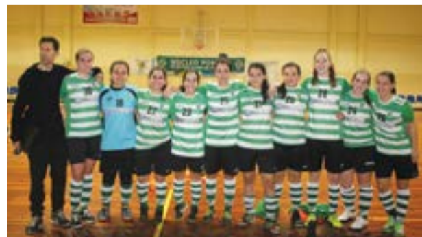
• Atletas do Núcleo Sportinguistas de Pombal