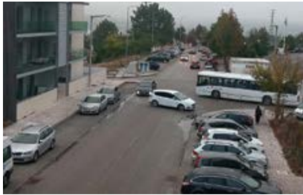
• Falta de passagens para peões preocupa população na Urbanização Mirante do Valbom, na Charneca.

Também outra moradora, e mãe de um aluno, “que está a frequentar pela primeira vez” aquele estabelecimento de ensino re-