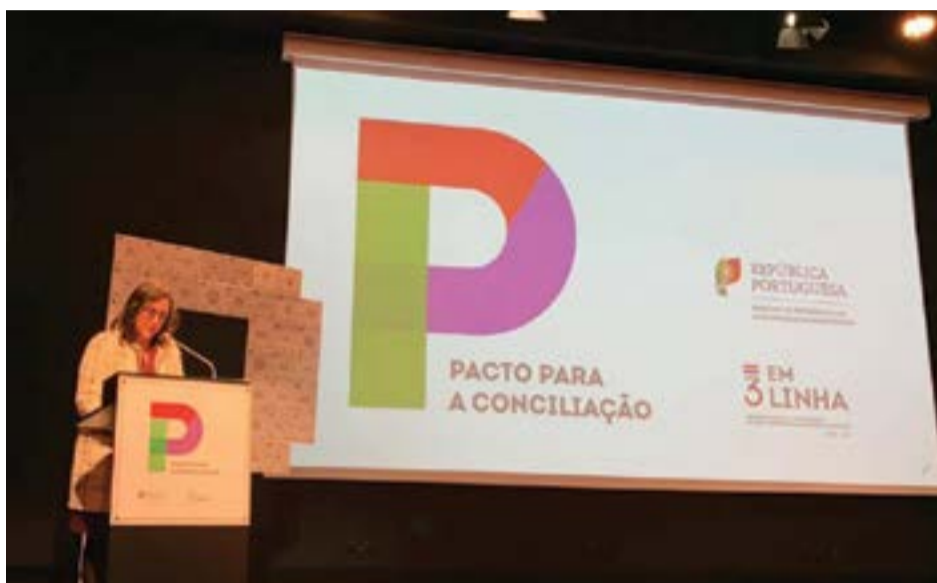
• O pacto foi assinado no dia 6, numa cerimónia que decorreu em Lisboa