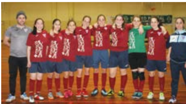
• juniores do Grupo Desportivo da Ilha

tendo esta sexta-feira, um grande teste com o Desportivo da Ilha. Em juniores, participação do Núcleo Sport. Pombal e Ilha.