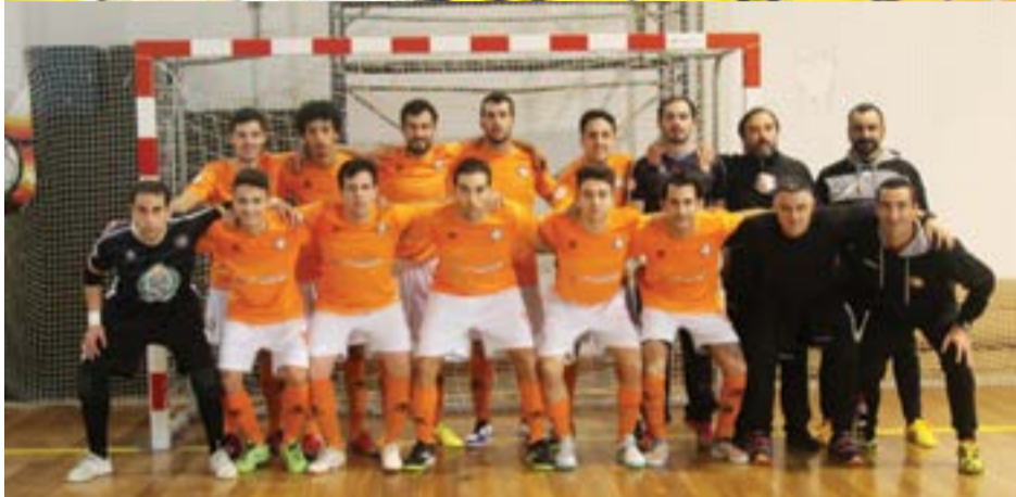
• Equipa que jogou na Taça Distrital frente ao Vidigalense