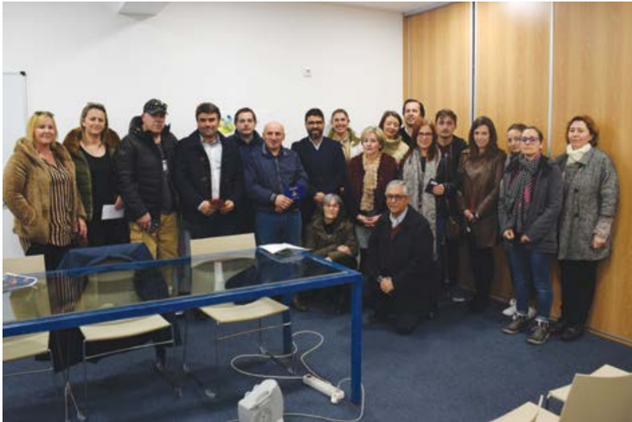
• Alguns dos vencedores do concurso ECO-Montras e do Sorteio de Natal 2018