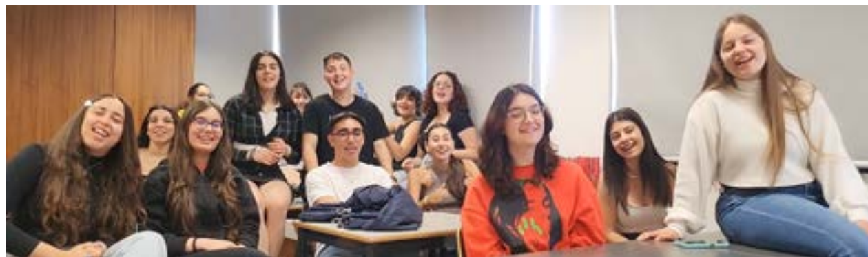
• Alguns dos alunos do terceiro ano do Curso Técnico de Comunicação - Marketing, Relações Públicas e Publicidade da Secundária de Pombal

Quando foram desafiados a fazer uma curta-metragem, em contexto de um workshop escolar, no âmbito da disciplina de Comunicação Gráfica e Audiovisual e do Projecto Cultural de Escola, os alunos do 3.º ano do Curso Técnico de Comunicação - Marketing, Relações Públicas e Publicidade (TCM) não sonhavam com a projecção que poderiam vir a ter. Mas a curta desenvolvida com o apoio técnico do Cineclube de Pombal, e com a colaboração do Teatro Amador de Pombal, que estreou durante a primeira edição do "HaHaArt Film Festival", foi já seleccionada para vários festivais de cinema, tendo mesmo obtido o 2.º lugar no 3.º FunFest - Concurso Internacional de Vídeo do Funchal, assim como o prémio de representação.