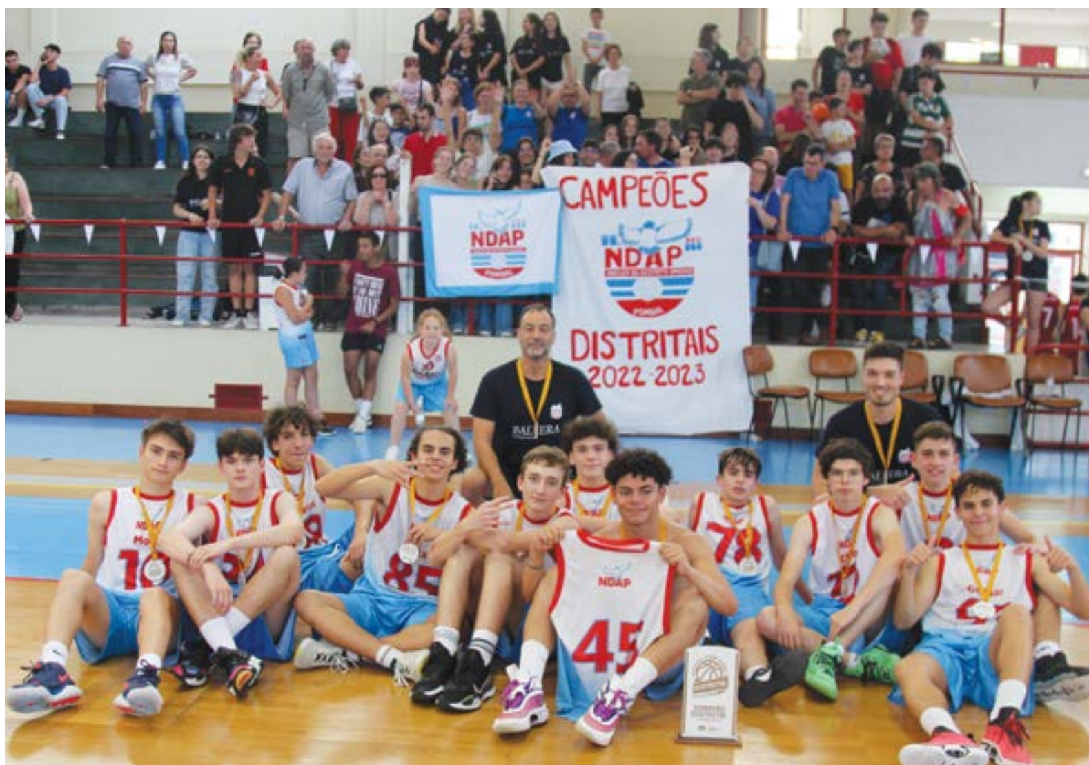
• Equipa masculina venceu na final, disputada no Pavilhão Municipal de Pombal, de forma tranquila o Basquet Clube do Lis por 58-38, no passado dia 11 de Junho

Para este fim de semana, 17 e 18, é a vez das finais do campeonato distrital em Sub'14 feminino, que também vão decorrer em Pombal. O NDAP joga as meias finais, no sábado, com o Amarense às 9.30h, sendo a final no domingo, às 11.30 horas.