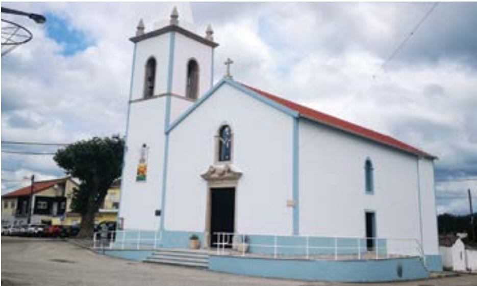
• O arraial da festa da Pelariga é junto à Igreja, onde se concentram milhares de pessoas todos os anos

Quanto aos cartazes, na Machada a Rosinha é a cabeça de cartaz. A cantora de música popular actua