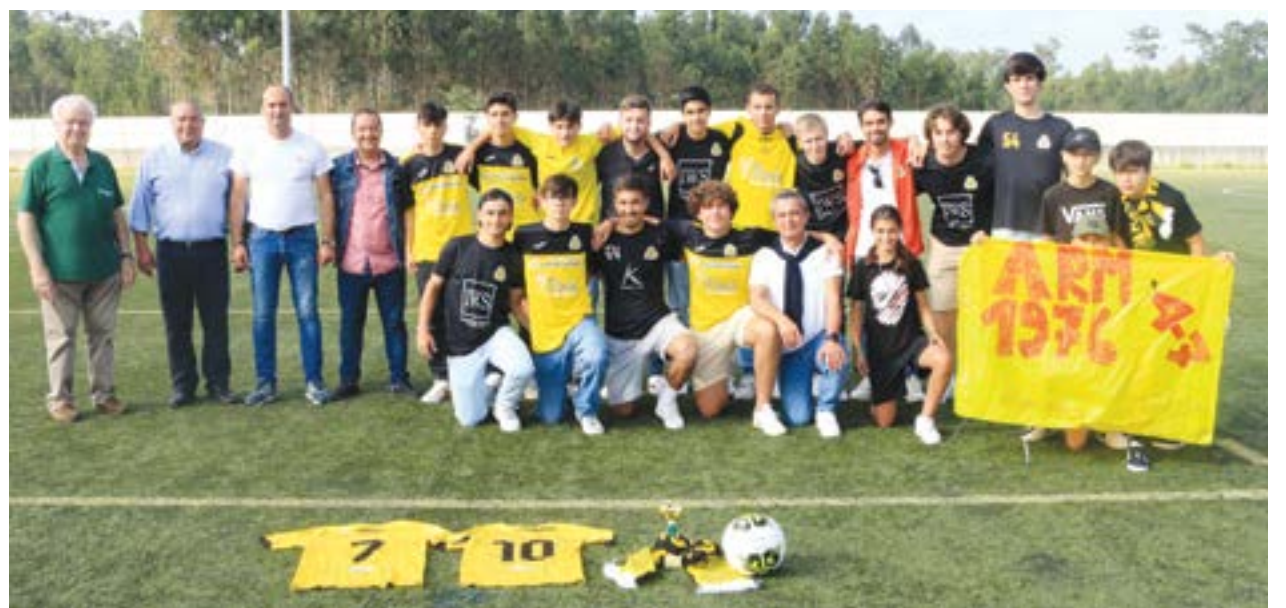
• A equipa foi homenageada no final do jogo da equipa sénior que se realizou na tarde de domingo, dia 4 de Junho

forço e da equipa técnica que voltaram a dignificar as cores do clube.