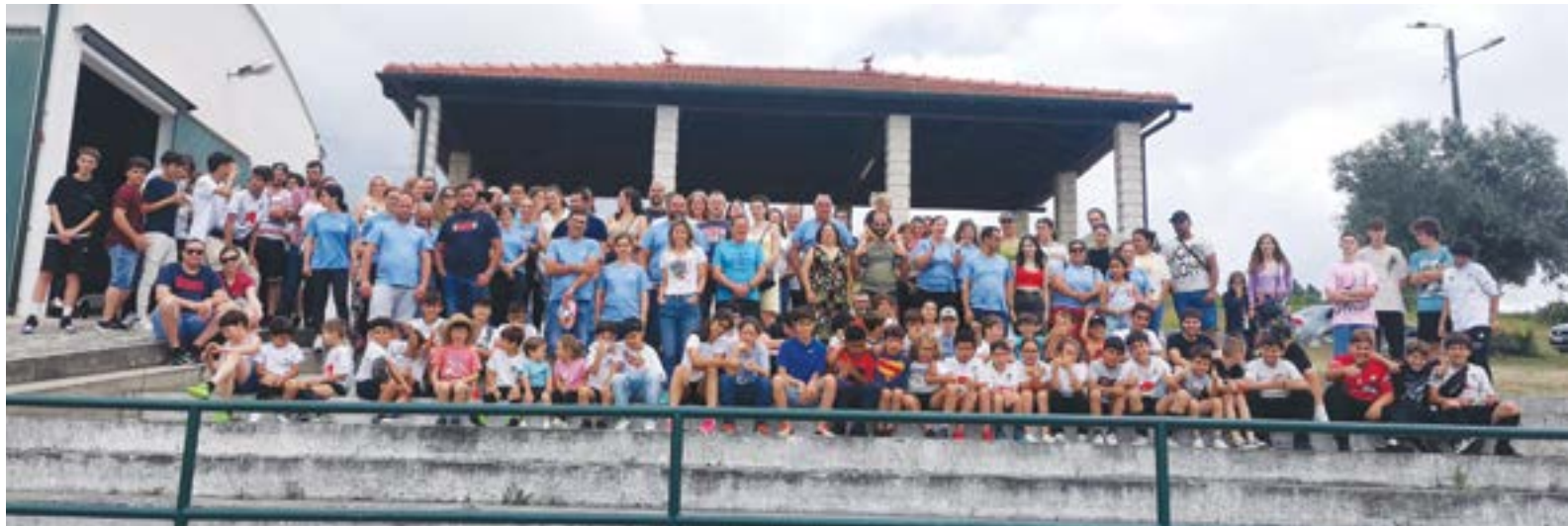
• O grupo voltou a ser enorme na celebração de mais um aniversário da Academia HappyBall, que contou com a presença da vereadora do desporto.