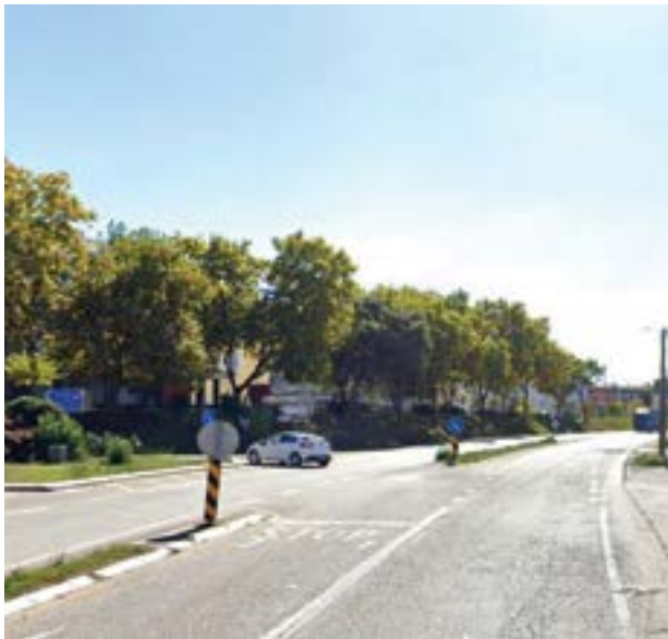
• Uma das rotundas está prevista para a zona de Flandes

A requalificação do IC2 entre Meirinhas e Pombal vai custar mais de 1,8 milhões de euros por quilómetro. A empreitada, que será financiada pelo Plano de Recuperação e Resiliência (PRR), prevê “a reabilitação total do pavimento, a construção de nove rotundas e várias meias rotundas, facilitando e disciplinando os inúmeros acessos em condições de segurança de-