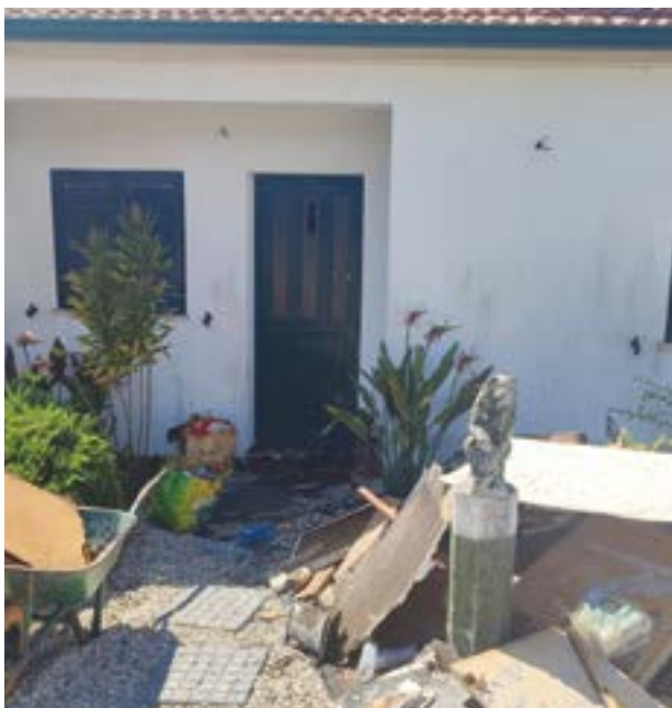
● O fogo destruiu a cozinha mas o resto da casa ficou danificada nas estruturas

Um incêndio numa habitação no Paço de Almagreira, deixou desalojada uma mulher de cerca de 70 anos.