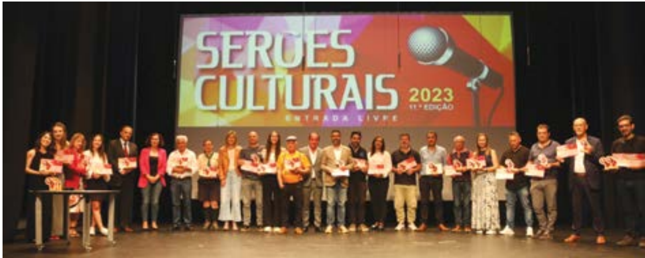
• Autarcas, apresentadoras e representantes das associações e instituições

A finalíssima da 11ª edição dos Serões Culturais trouxe ao palco do Teatro-Cine de Pombal, no dia 3, o talento das colectividades e instituições da freguesia do Louriçal. Realizado de dois em dois anos pela Junta de Freguesia local, o evento tinha data marcada para 2021, mas a chegada da pandemia impediu a sua realização. Desde o dia 28 de Janeiro e até 20 de Maio, uma dezena de colectividades e outras tantas instituições de animação musical e artística par-