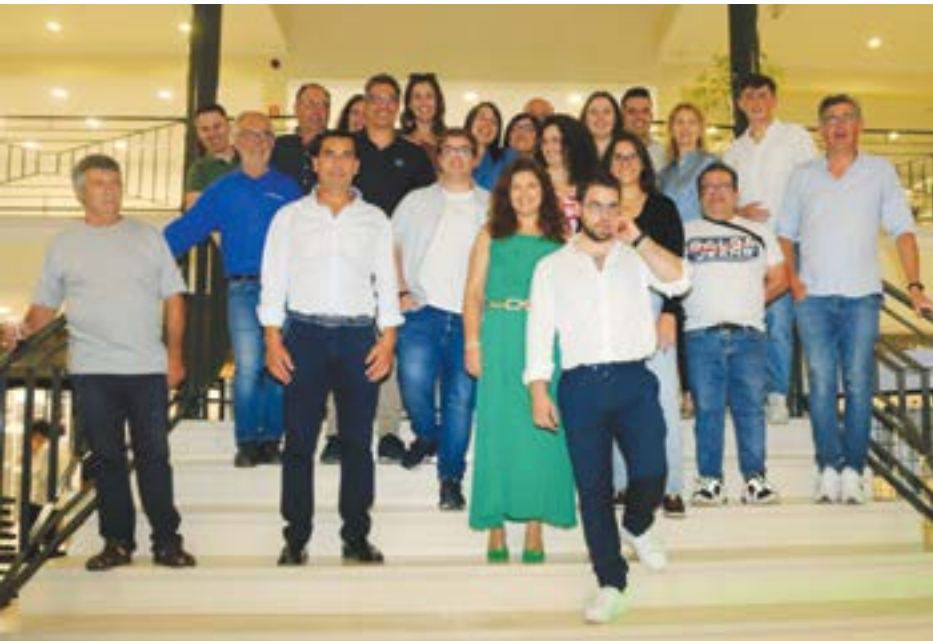
• Gerência da Macolusa rodeada dos colaboradores da empresa no dia da festa de aniversário

Cerca de 30 casas de banho modernas estão expostas no renovado showroom da empresa Macolusa - Materiais de Construção, localizado junto ao IC2, na localidade de Tinto, freguesia de Pelariga. A nova sala de exposições aposta na decoração, pretendendo mostrar as novas tendências do