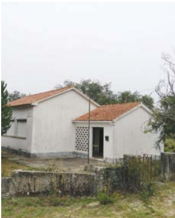
● É na antiga escola de Santiaais, actualmente bastante degradada, que deverá nascer o projecto deste edificado histórico”, com vista a instalar ali um Centro Interpretativo da Resina, contou ao Pombal

Assim, “para que não se perca todo o património material que neste momento ainda é possível recuperar”, o GARECUS propôs à autarquia “a renovação