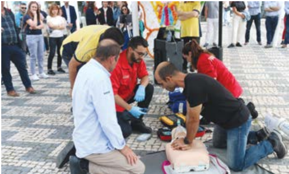
● A apresentação dos equipamentos incluiu um simulacro no Largo do Cardal

“Como o próprio nome indica, numa paragem cardiorrespiratória o coração e os pulmões deixam de funcionar”, explicou o CEO da empresa responsável pela colocação dos DAE no concelho de Pombal, sublinhando que nestes casos há “muito pouco tempo para actuar e é das