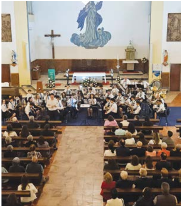
•Após o jantar, seguiu-se um concerto da filarmónica na igreja

Cerca de 200 pessoas participaram no jantar comemorativo dos 50 anos da inauguração e bênção da nova igreja paroquial de Vermoil, realizado no passado dia 20, no salão paroquial. Ao jantar seguiu-se um concerto da Sociedade Filarmónica Vermoilense, no interior da igreja, e que contou com uma participação ainda mais alargada.