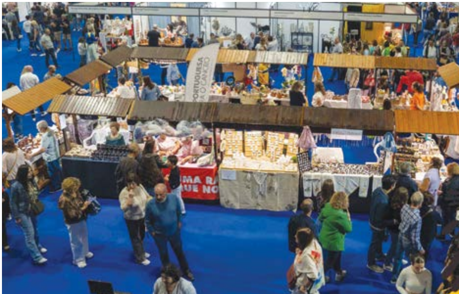
• O evento é uma excelente plataforma para promover Pombal

No ano em que celebra 30 anos, o certame, que se realiza no Expocentro, promete voltar a ser uma celebração da arte e do saber-fazer tradicional, com a participação de cerca de 180 artesãos e expositores de diversas regiões do país. Organizada pelo Município de Pombal em parceria com a Associação de Desenvolvimento de Iniciativas Locais (Adilpom), a feira tem como principal objectivo “promover e valorizar o artesanato nacional, colocando em evidência a riqueza e a diversidade das artes tradicionais portuguesas”, refere a autarquia numa nota enviada à imprensa. “Ao longo das três décadas de existência, o evento consolidou-se como um espaço de encontro entre artesãos e público, sendo uma