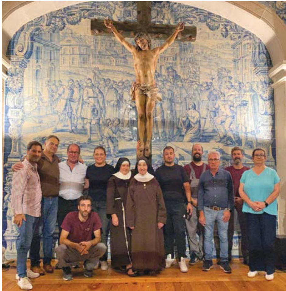
•A imagem fica exposta no coro baixo da igreja do convento

A imagem do Cristo Crucificado, datada da década de 1730, voltou ao Convento do Desagravo do Santíssimo Sacramento, no Louriçal, após a formalização de um novo contrato de comodato. A obra passa a estar exposta no coro baixo da igreja do convento. A peça, feita em estanho fundido sobre cruz de madeira, havia sido integrada nas coleções