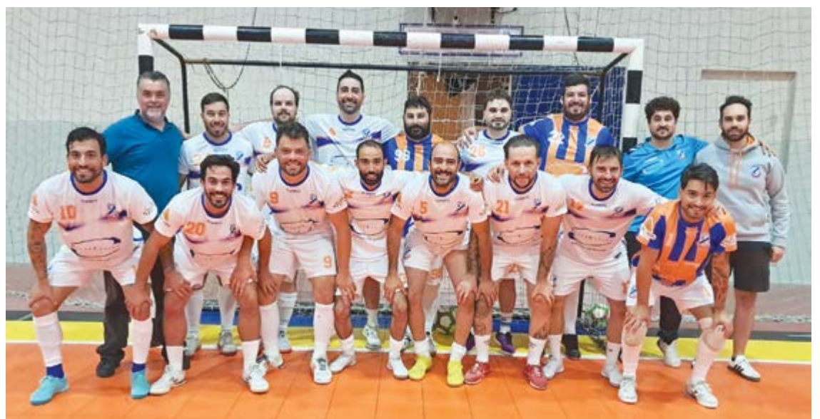
•A equipa do GARECUS que realizou o triangular no passado dia 20, tendo vencido os dois encontros

lizou no seu pavilhão, triunfou por 4-0, frente ao Carvalhos Figueiredo de Tomar e 1-0, ao Vale Travesso de Ourém. A competição que iniciará no primeiro fim-de-semana de Outubro, terá como novidades, o regresso do Castanheira de Pera, o Alegre Unido da Bajouca e a Silveirinha Grande e Claras da freguesia do Carriço, com quem o GARECUS terá o seu primeiro encontro. Uma série que foi ajustada com a promoção do Sismaria e a repescagem do Regueira de Pontes, numa prova nove equipas, em que os primeiros serão apurados para uma segunda fase.