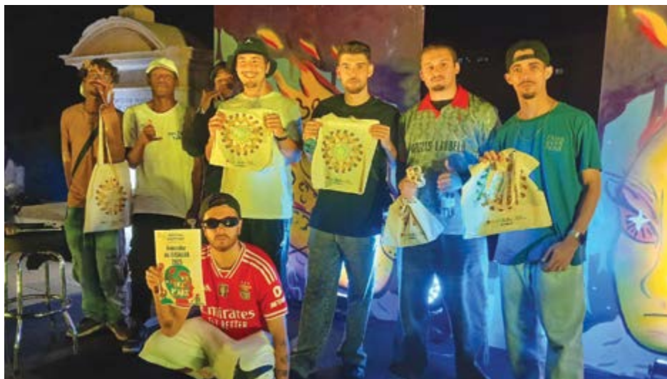
• Os participantes na Batalha do Marquês realizada no Festival Faz P'Art

uma batalha de rimas e onde é que se pode ver a Batalha do Marquês? Gabz explica que, regra geral, as batalhas realizam-se todas as sextas-feiras, pelas 22h, no Skatepark de Pombal, junto às Piscinas Municipais. Numa batalha, dois MC's enfrentam-se em