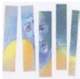
NÚCLEO DE APOIO A CRIANÇAS E JOVENS EM RISCO (NACJR) POMBAL

O mês de abril é o Mês de Prevenção dos Maus-Tratos na Infância. Na sociedade atual é inegável que a problemática da violência nas crianças e jovens constitui uma realidade cada vez mais visível. Todavia é ainda necessário que esta problemática seja alvo de reflexão e intervenção, para a prevenção, proteção e promoção da saúde e bem-estar das crianças e jovens.