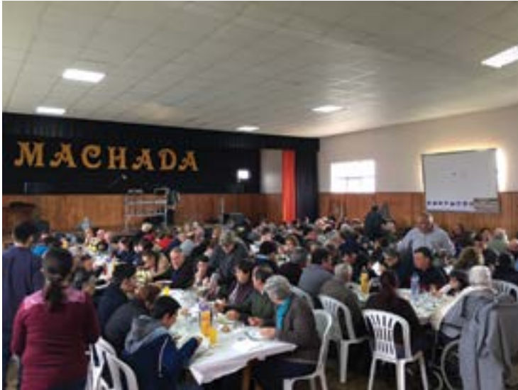
• Cerca de 140 pessoas estiveram no almoço do 29.º aniversário

A Associação de Recreio, Desporto, Educação e Cultura da Machada (ARDEC), na freguesia da Pelariga, celebrou no último domingo, 15, os 29 anos de existência.