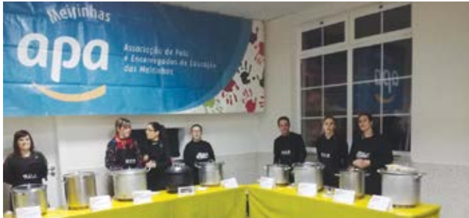
• Os membros da APA desenvolvem, e participam, em vários eventos com o objectivo de angariar fundos para a realização de actividades escolares com as crianças da Escola do 1.º Ciclo do Ensino Básico das Meirinhas

No entanto, nem todas as associações de pais têm a capacidade para dar resposta às necessidades escolares dos mais pequenos. No que diz respeito à APA - Associação de Pais e Encarregados de Educação dos Alunos da Escola do 1.º Ciclo do Ensino Básico e Jardim -de - Infância da Freguesia de Meirinhas,