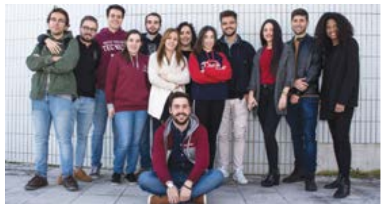
• A nova direcção da ADEPES