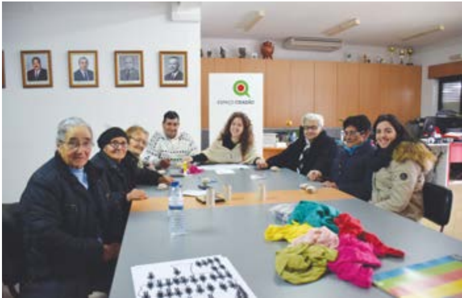
• Participantes têm idades compreendidas entre os 59 e os 93 anos.