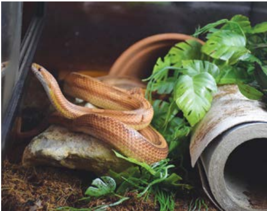
• Tojó é “uma Cobra do Milho que reside na zona oeste do concelho de Pombal”