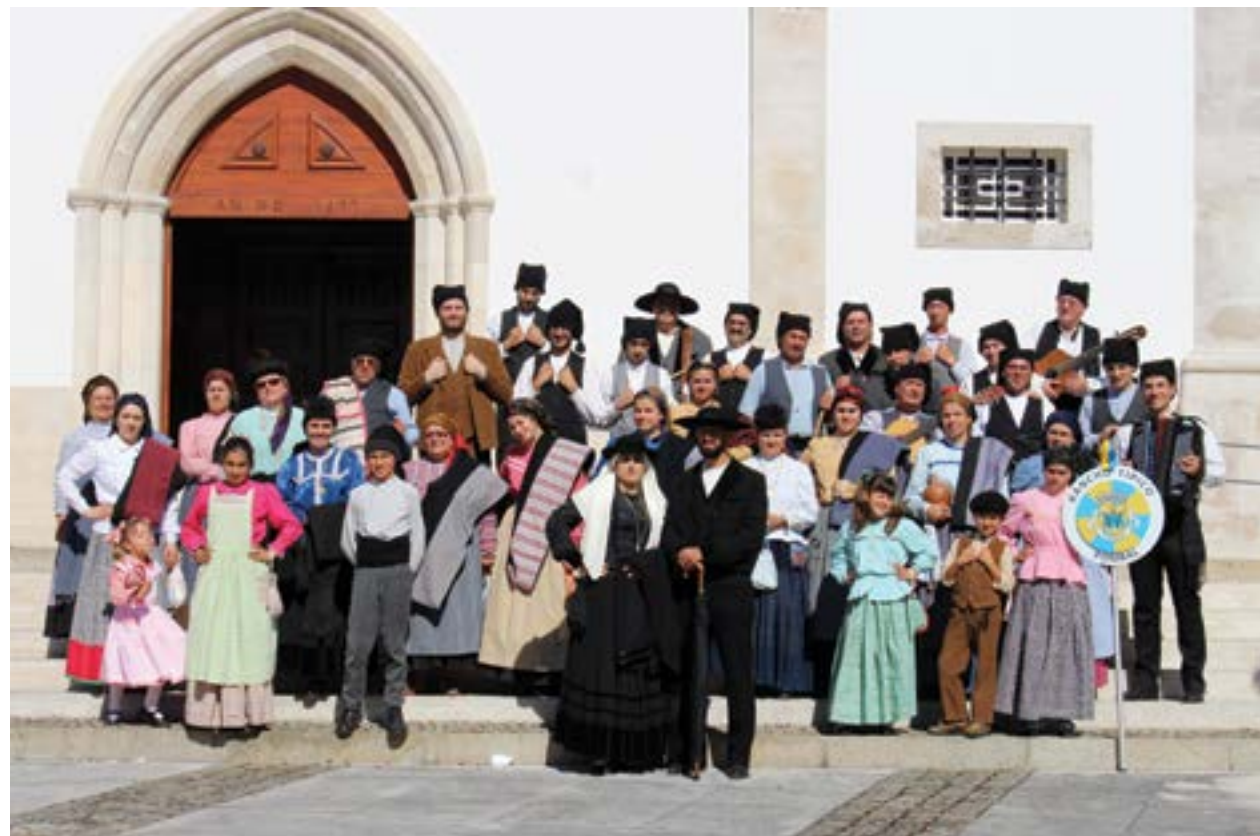
• O Rancho Típico de Pombal é um dos organizadores do evento

De Volta à Praça realiza-se no feriado do 1 de Maio, na Praça Marquês de Pombal. O evento conta com a exposição de vários artesãos do concelho, tasquinhas com petiscos apetitosos e folclore no pé.