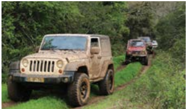
• Passagem pela Ribeira de Ansião junto ao Rio Nabão

Seguindo o plano de atividade de 2018, a Associação Sicoense no limite das freguesias de Abiul e Vila Câ cumpriu com êxito mais uma organização do seu passeio de Todo-o-Terreno. Estiveram presentes mais de 60 jipes, que tiveram a sua primeira grande dificuldade na passagem pela Pipa,