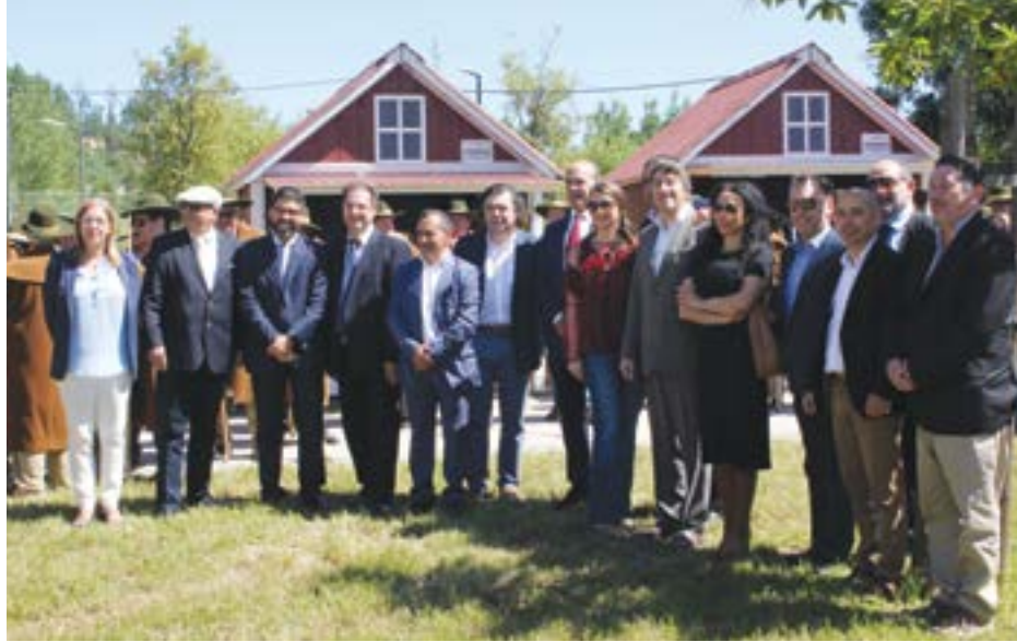
• Autarcas das Terras de Sicó e convidados na abertura do certame

Antes disso, já os problemas dos territórios “ditos de baixa densidade” tinham sido alvo da atenção do presidente da Câmara Munici-