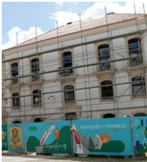
● A Casa Agorreta fica localizada na Praça Marquês de Pombal

No entanto, o empreiteiro solicitou uma nova prorrogação do prazo gracioso, “invocando dificuldades na ob-