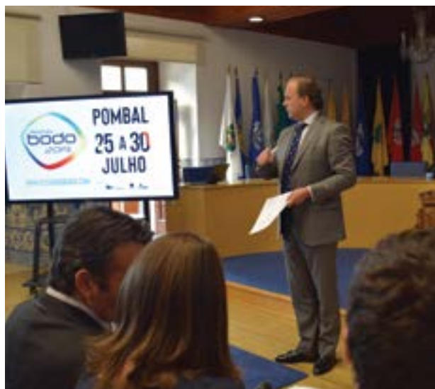
• Gabriel, o Pensador, Toy e Carolina Deslandes são alguns dos cabeças-de-cartaz nas Festas do Bodo 2019, apresentados pelo presidente da Câmara

No dia seguinte a autora de 'Faz Gostoso', Blaya, promete incendiar o Largo do Arnado, para domingo (28)