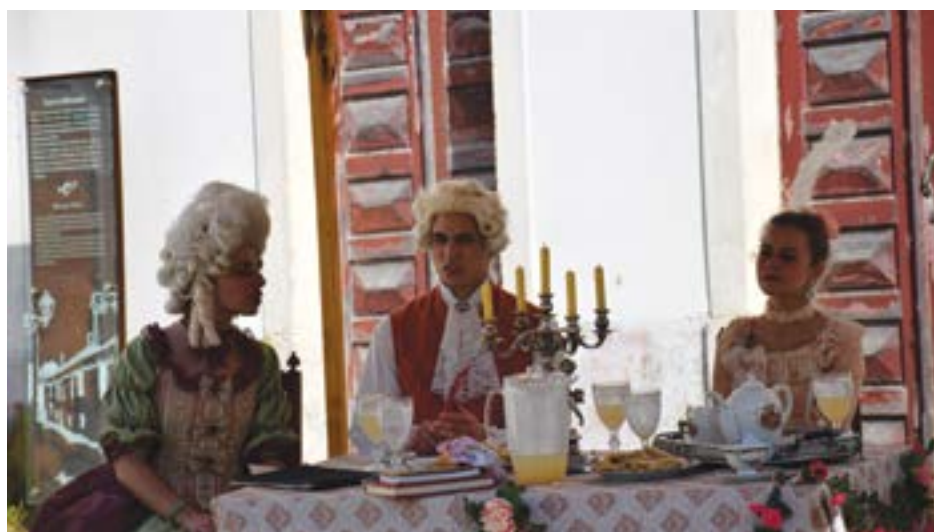
• Evento anima centro histórico da cidade no próximo fim de semana, dias 25 e 26

Com a iniciativa, a Câmara Municipal propõe-se realizar um evento que "recrie a história da época em que viveu o Marquês de Pombal". "Pretendemos mostrar cenas do quotidiano pombalino, festas e divertimentos setecentistas, jogos, trajes e costume da época, profissões populares, música, dança, poesia, teatros populares da época, espectáculos de pantomimas, acrobacia e outros divertimentos",