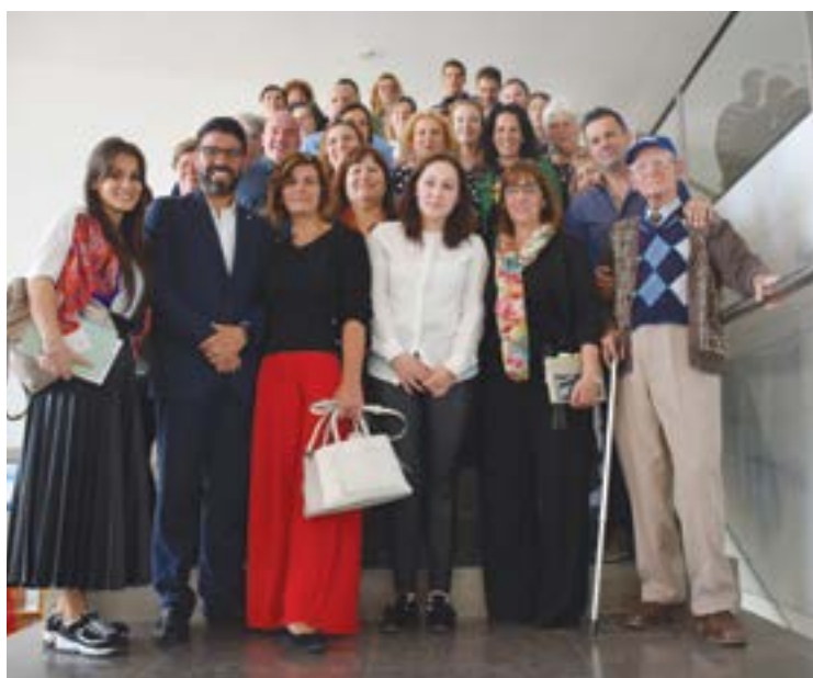
● Representantes das instituições integradas na Comissão Social de Freguesia

Neste relatório, o autarca apresentou a "actividade da Comissão Social e das áreas de intervenção que a integram: Envelhecimento Activo e Positivo; Infância, Juventude e Família, Comunidade, Empregabilidade e Bem-estar". No que diz respeito à área do envelhecimento activo, a comissão realizou mais de 270 acções, onde estão incluídos os projectos "Pombal 65+", "Um Sé-