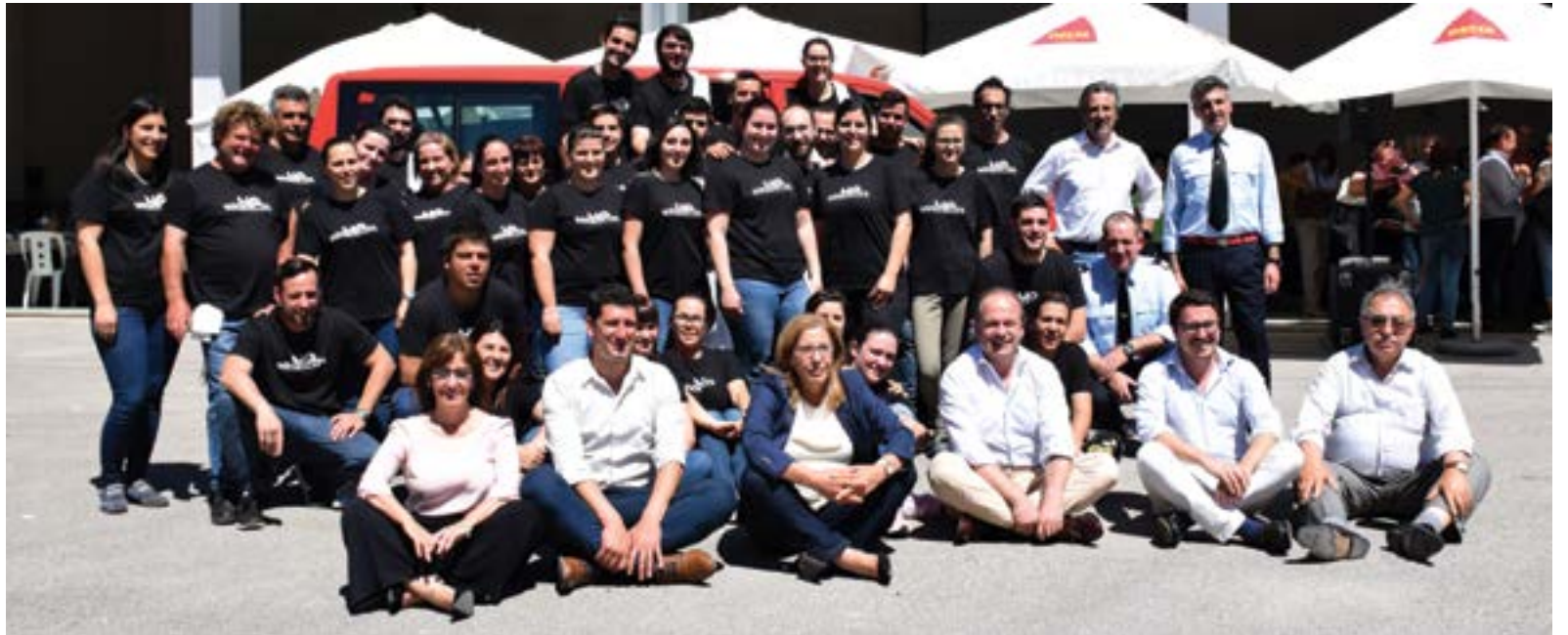
• A Associação dos Amigos dos Bombeiros da 5. a Companhia contou com o apoio de cerca de 40 voluntários para realização do almoço-convívio

Durante o evento, que contou com casa cheia, o dirigente, fez um apelo “para que se faça um esforço ainda maior para que esta casa funcione a 100%”, e assim “dar resposta a mais emergências”, que no seu ponto de vista só será possível com a “angariação de novos voluntários”, uma vez que “esta casa não se faz sem voluntariado”, lembrando que “somos cada vez menos e que temos de trabalhar no sentido de atrair mais jo-