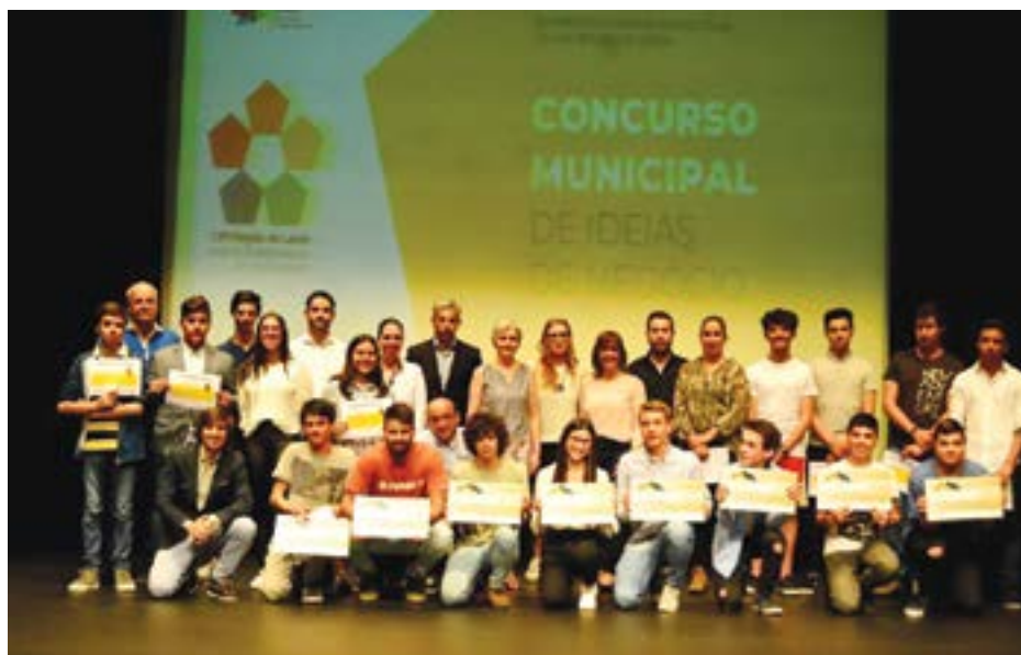
• Para além do “Smartkey”, a ETAP viu um outro projecto dos seus alunos - “Tractor Safety” - a obter o terceiro lugar na final municipal

Por sua vez, o projecto “Safe Cross”, desenvolvido por alunos da Escola Secundária de Pombal, que apresenta uma solução para diminuir os acidentes ocorridos em passeadeiras