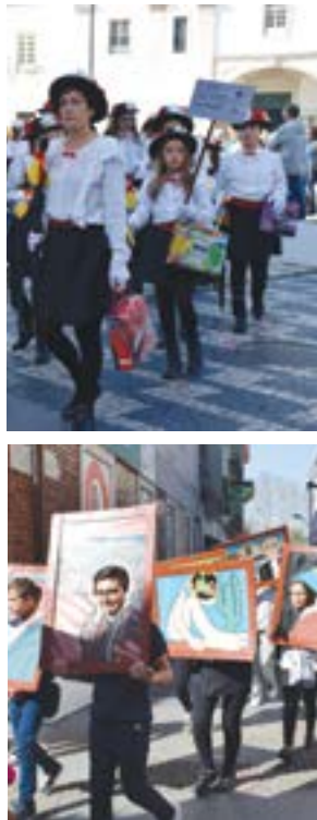
• Desfile em Pombal