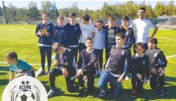
• Os iniciados do Almagreira jogaram no domingo de manhã