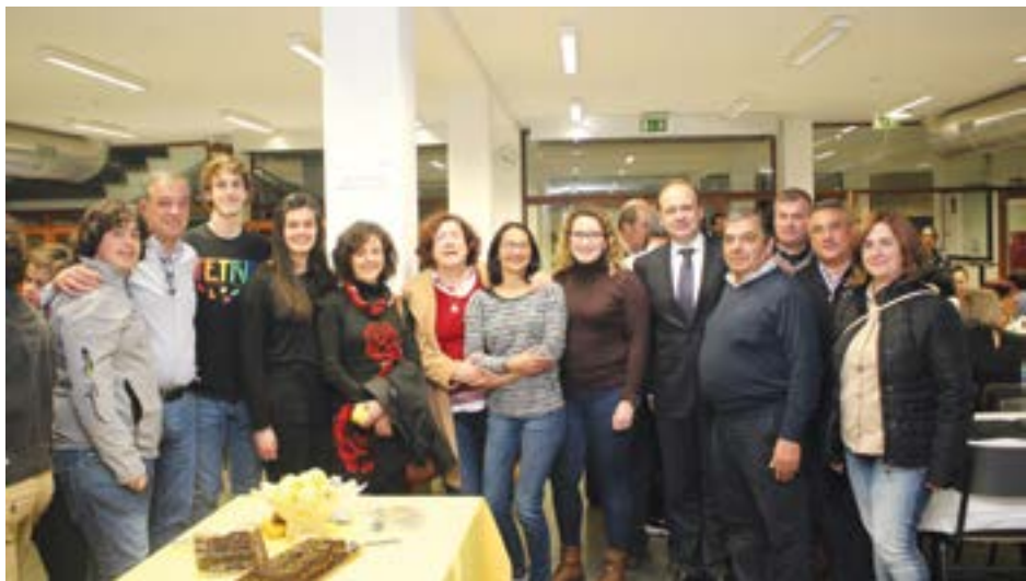
• Voluntários das equipas do concelho de Pombal

jantar, as equipas do concelho já têm em mãos a organização do próximo evento, uma noite de fados marcada para dia 20 deste mês, na Associação Des-