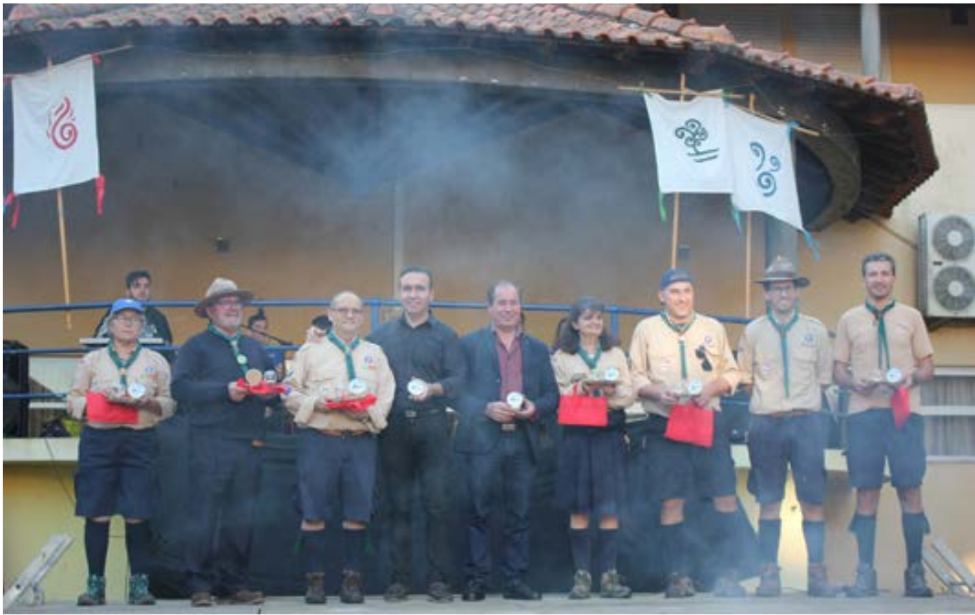
• Dirigentes escutistas e representantes das entidades convidadas

As comemorações do Dia de Baden Powell no concelho, fundador do escutismo, foram realizadas, este ano, na vila do Louriçal, que recebeu, ao longo do dia 22 de Fevereiro, 350 escuteiros. Coube ao Agrupamento de Escuteiros local ser o anfitrião do evento, na linha da rotatividade que impera, há já 20 anos, entre os sete agrupamentos concelhios.