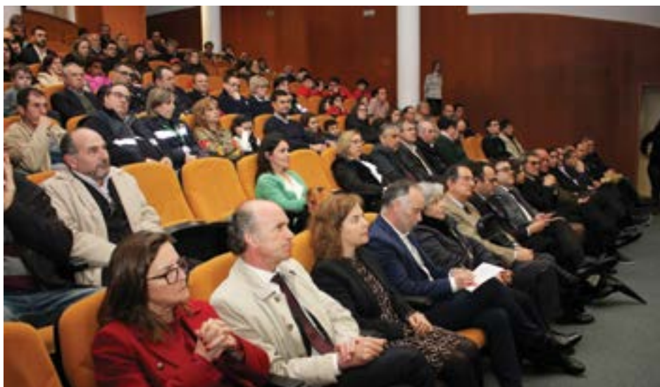
• Marcaram presença no evento, diversos presidentes de câmara, nomeadamente do norte do distrito