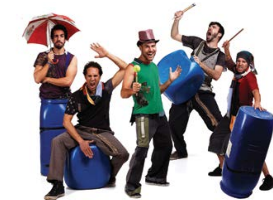
• Bidons, latas, garrafas, ferros, paus, tachos, panelas e até o próprio corpo. É com todos estes instrumentos em palco que irá arrancar, esta sexta-feira, o Festival de Teatro de Pombal

No domingo, às 16h00, o festival regressará ao Tea-