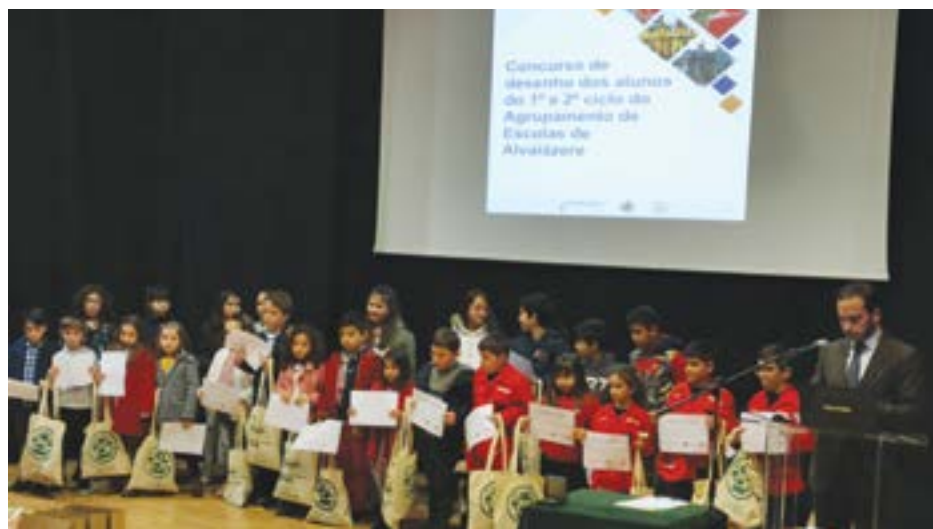
• Entrega dos prémios do concurso de desenho aos alunos do 1.º e 2.º Ciclos