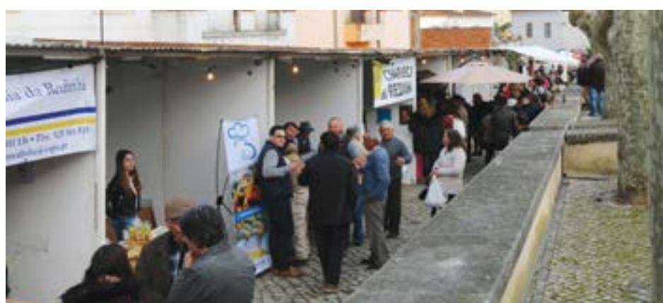
• O evento conta com inúmeros expositores, quer de colectividades quer de particulares

A recriação histórica da Batalha da Redinha, no dia 17 deste mês, volta a ser o ponto alto das comemorações dos 209 anos das invasões francesas, evento considerado pelo presidente da Junta de Freguesia como “um marco importante” para a terra. Junto à ponte romana da vila, que atravessa o rio Anços, local onde tudo aconteceu, dezenas de figurantes, trajados a rigor, levam a imensa moldura humana numa viagem ao passado, recriando o combate travado entre o exército francês, comandado pelo marechal Ney, e as forças anglo-lusas, sob o comando do general inglês Wellesley. Antes deste momento, será prestado a habitual homenagem aos mortos em combate, junto ao memorial localizado no Largo da Guer-