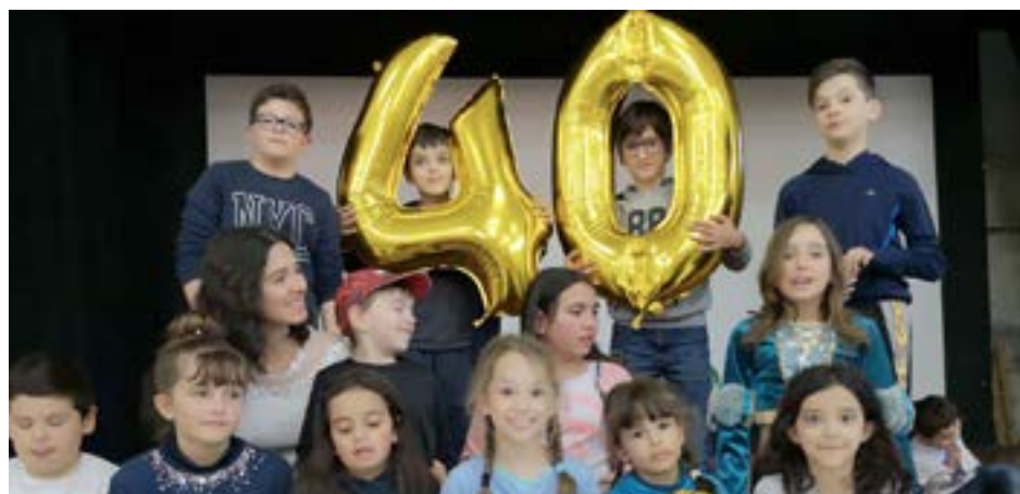
• A colectividade tem sabido cativar as novas gerações