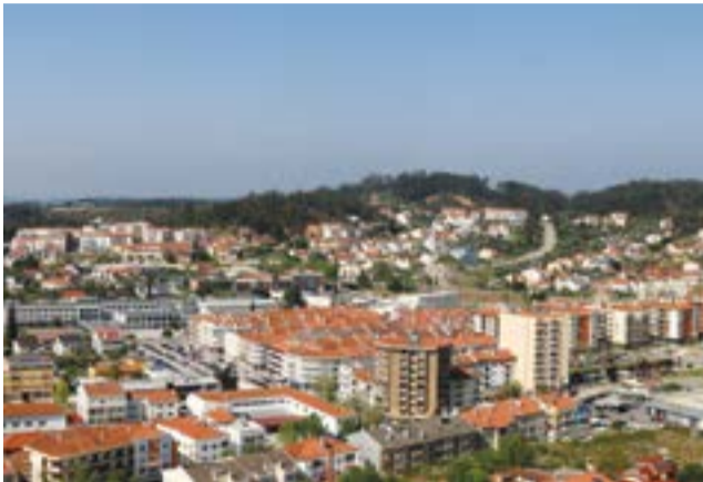
● Pombal está entre os municípios com maior diferença entre o IMI cobrado e o IMI que poderia cobrar se aplicasse a taxa máxima

66 euros é o valor que cada pombalense poupou pelo facto de a Câmara Municipal de Pombal cobrar uma taxa de IMI de 0,30% em vez da taxa máxima permitida por lei (0,45%). A informação consta no Anuário Financeiro dos Municípios Portugueses relativo ao ano 2022.