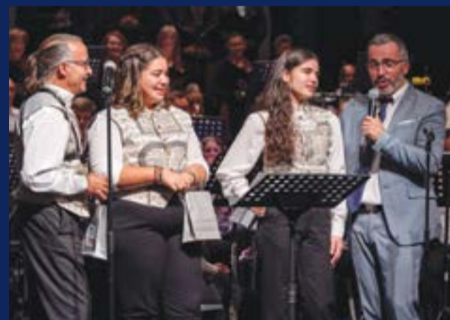
• No espectáculo foram apresentados alguns dos novos músicos

Aniversário da Filarmónica Artística Pombalense no Teatro-Cine