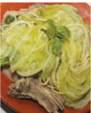
● As Sopas de Carneiro voltam a ser um dos ex-libris do cardápio 85l.

No sábado, as refeições começam a ser servidas a partir das 19h00 e no domingo os almoços têm início às 12h00. Para um atendimento mais célere, a organização sugere que os interessados façam a sua reserva, através dos telefones 914 416 279 ou 964 885