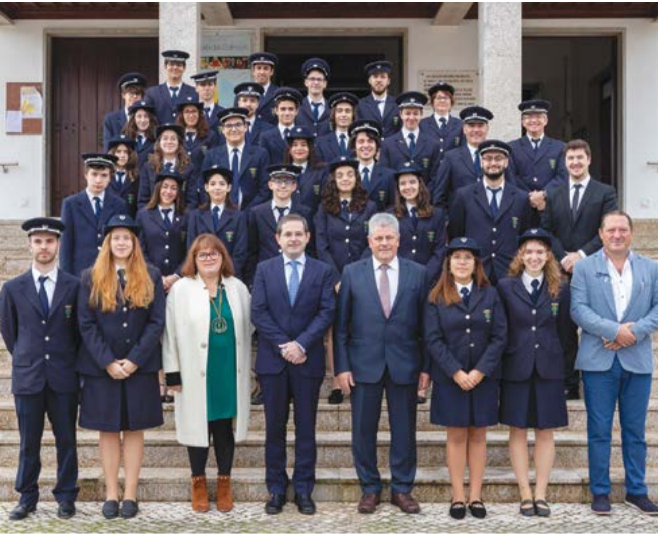
• Direcção, maestro e músicos na escadaria da igreja de Vermoil

“A par disto continuamos a investir fortemente na escola de música, que este ano conta com quase 100 alunos, fruto da criação de um Pólo da Filarmónica Vermoilense