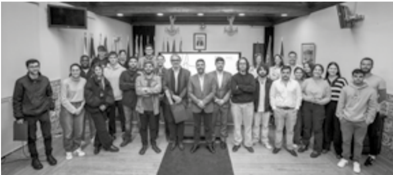
● Alunos e docentes vieram conhecer Pombal e os locais de intervenção, como a Zona Industrial da Formiga, o futuro parque verde, o interface rododferroviário e o Casarelo

Neste sentido, “pedimos aos alunos para que pensassem essencialmente os espaços entre estas barreiras”, com vista a transformar Pombal numa “cidade retícula”, onde “os elementos de ambos os lados destas linhas possam comunicar de forma mais próxima e eficaz”.