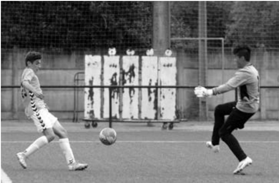
● Golo do triunfo frente ao União 1919 (Coimbra) surgiu no 20.º minuto de compensação da primeira parte

Nos dois últimos encontros, a equipa manteve-se coesa, nomeadamente no derbie com o Marrazes, disputado em Leiria. Em campo, os dois primeiros classifi-