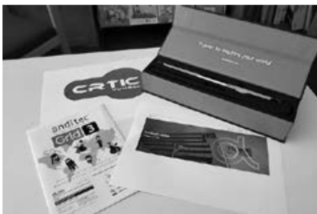
● Recursos estarão ao serviço de 11 concelhos e 24 agrupamentos de escolas