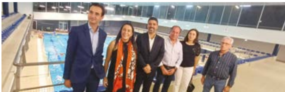
● Protocolo que viabiliza abertura da piscina foi celebrado entre Instituto D. João V, o Município de Pombal e a Junta de Freguesia do Louriçal

“Esta iniciativa é fruto da boa vontade de várias instituições”, designadamente o