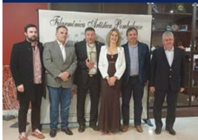
• Os presidentes das restantes filarmónicas do concelho também se juntaram à festa (Ilha, Louriçal, Guia e Vermoil)