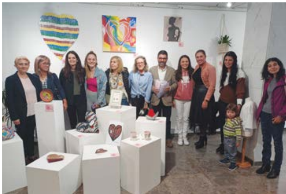
• Alguns dos artistas marcaram presença na inauguração

Com o mês de Outubro a caminhar para o fim, e com ele a iniciativa Outubro Rosa que