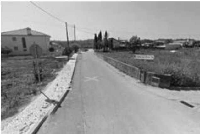
● A obra de alargamento abrange a construção de passeio e de um muro