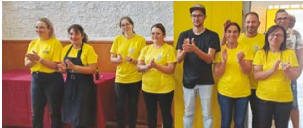
• Staff que serviu o almoço

Os 42 anos do Grupo Desportivo e Recreativo dos Vieirinhos (GDRV) foram celebrados com casa cheia. No dia 15 deste mês, cerca de uma centena de pessoas participaram no almoço comemorativo, realizado na sede da colectividade da freguesia do Carriço, e que este ano teve um sabor especial. Cinco anos depois da passagem da tempestade Leslie, que em 2018 atingiu de forma significativa a região Centro, a associação viu finalmente ser-lhe atribuído o apoio solicitado ao Município de Pombal para reparação dos estragos causados, à época, no edifício-sede. O anúncio foi feito na reunião do executivo camarário, realizada poucos dias antes da festa de aniversário, e