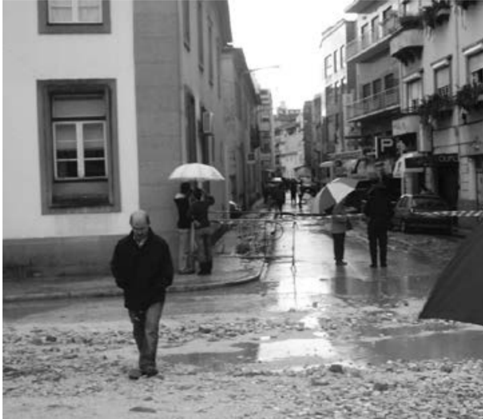
● Investimento de 11 milhões de euros pretende “minimizar o risco de cheias”, como aquela que em 2006 inundou habitações e estabelecimentos comerciais

A opção “mais económica, com (muito) maior volume de encaixe, com melhores acessos e acessibilidades” permite “a criação de um Parque Urbano de qualidade, que teria funções não só