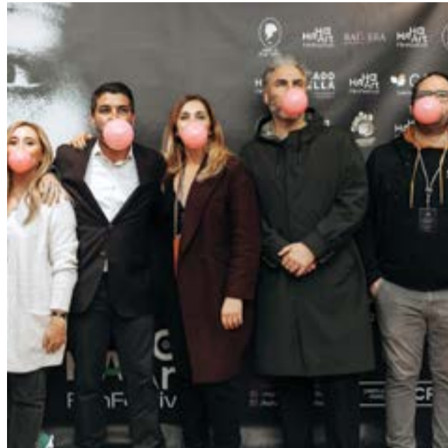
• O festival é uma organização do Cineclube de Pombal e do Município corre no domingo de manhã, com filmes nacionais de animação para todas as

O HaHaArt terá convidados oriundos de seis países: Espanha, França, Dinamarca, Israel, Brasil e Portugal