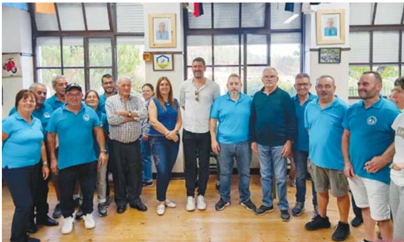
• Direcção e autarcas com os ex-presidentes, junto às fotos agora expostas

Vespa Clube assinalou data num ano marcado por diversas melhorias na sede