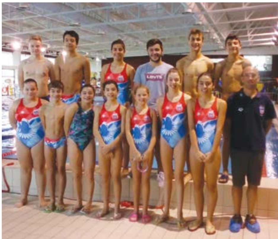
• Atletas de Natação do Núcleo que competiram nas Piscinas Municipais das Caldas da Rainha

Meirinhas com início às 11 horas. No dia 9, o Núcleo recebe em casa, o Juve Lis.