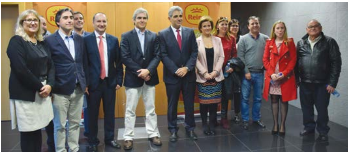
• Nuno Melo acompanhado da comitiva do CDS-PP, na visita à DoceReina

O vice-presidente e eurodeputado do CDS-PP, Nuno Melo, cabeça de lista do partido às Europeias 2019, visitou o concelho de Pombal, a 23 de Novembro, onde participou numa Conferência sobre a Europa, na Escola Secundária de Pombal, e visitou várias indústrias concelhias.