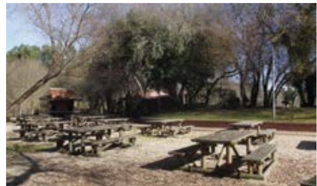
● O Oeste vai receber apoio para o corte e remoção de árvores nos parques de merendas do Vale da Sobreira e da Ilha

Na última reunião de Câmara, o executivo municipal deliberou atribuir apoios financeiros à Junta de Freguesia das Meirinhas e à União de Freguesias da Guia, Ilha e Mata Mourisca, para custear algumas intervenções nos respectivos territórios. No caso das Meirinhas, o apoio de 2.755 euros (mais IVA) destina-se a participar as despesas inerentes com trabalho na Rua Vale das Figueiras, de modo a resolver um