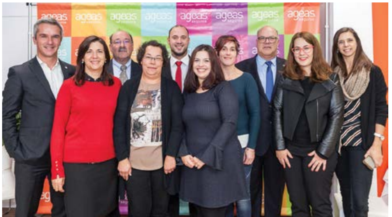
• Equipas Sicómedia e Ageas Seguros