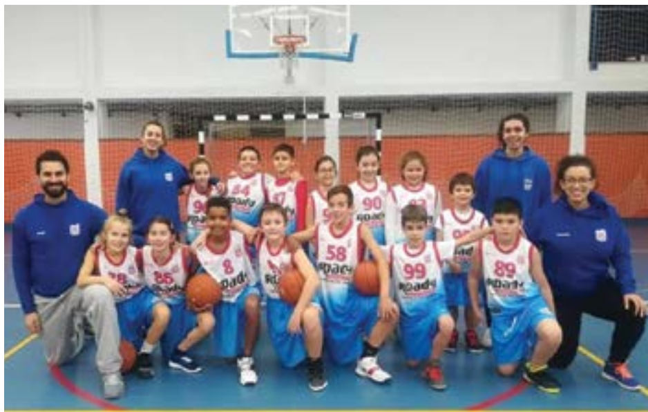
• Atletas de Pombal que estiveram no encontro promovido pelo pelo Basket Clube do Lis