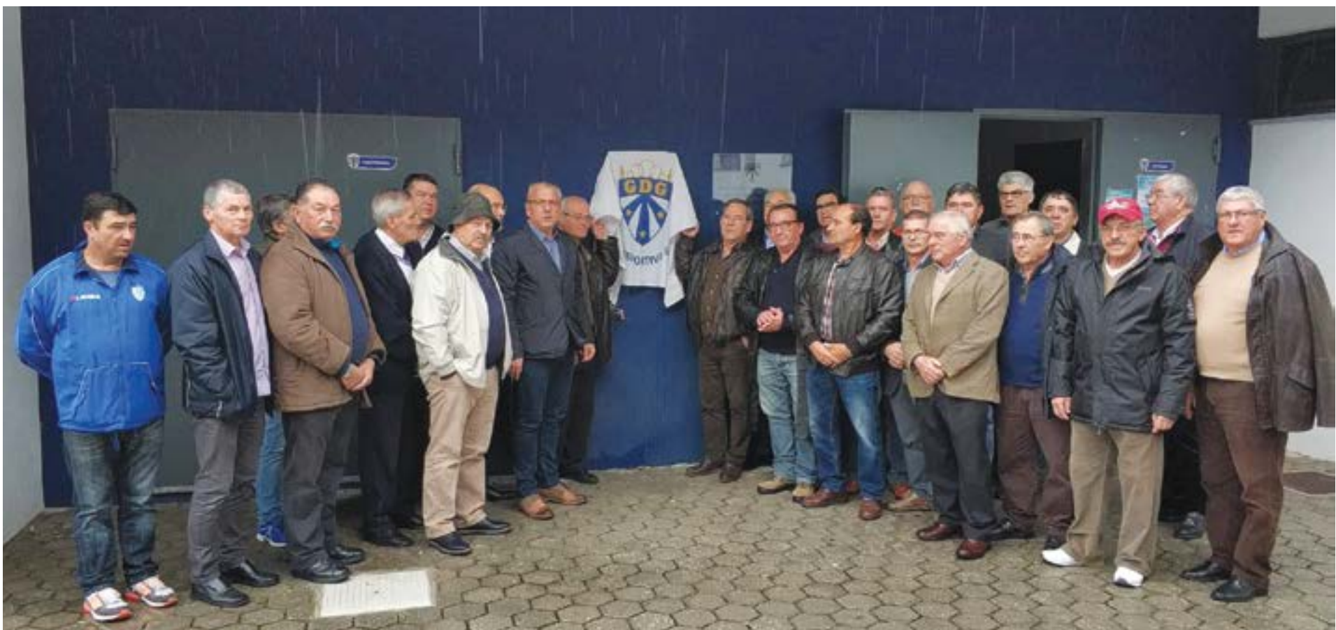
• Homenagem a treinadores, directores e atletas que participaram na subida do Guiense à 3ª Divisão Nacional na época de 1977/1978

Almoço convívio de aniversário agendado para o feriado de 8 Dezembro