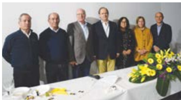
• Festa realizou-se nas instalações da futura estrutura residencial

Em dia de festa “é interessante olharmos para trás e verificarmos o quanto a Instituição cresceu e se foi adaptando às