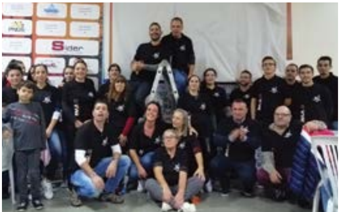
• A comissão de festas é composta por elementos de cada um dos lugares

De referir que a Comissão de Festas é composta com “um elemento de cada lugar da freguesia”, à qual se juntam os familiares e amigos, uma vez que “toda a ajuda é fundamental”.