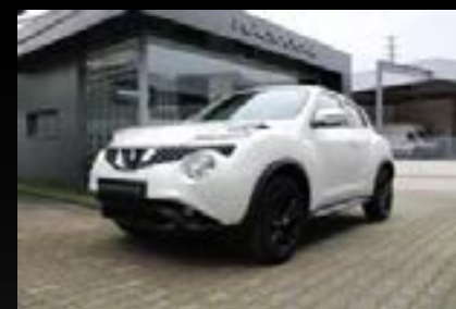
NISSAN JUKE 1.5 DCI ACENTA