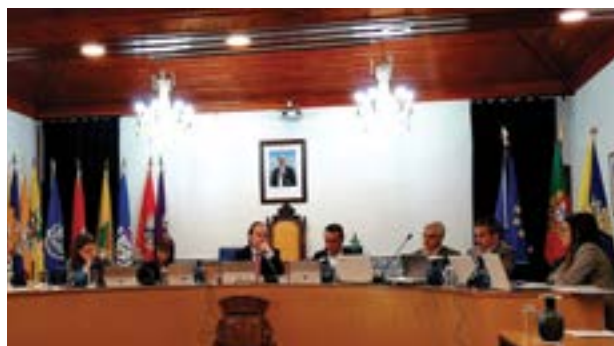
• Os documentos provisionais voltaram a estar em discussão

É o caso da realização de uma avaliação das características das águas, alegadamente poluentes, nos rios Arunca e Anços, e ribeira de Carnide, assim como a implementação de uma rede de carregamento de veículos eléctricos (prevendo instalação de postos na cidade e nas sedes de freguesia), a elaboração de um plano municipal de reforestação autóctone e um plano estratégico para o desenvolvimento económi-