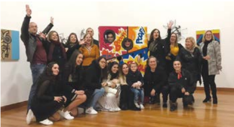
• O corpo docente da instituição terminou bastante animada com os resultados obtidos pelos alunos

troncosas’ apresentações, aos professores pelas suas ‘retumbantes’ palavras e à