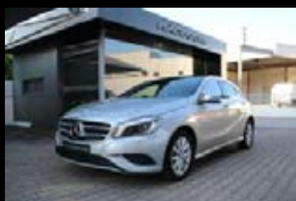
MERCEDES-BENZ A 180 D STYLE