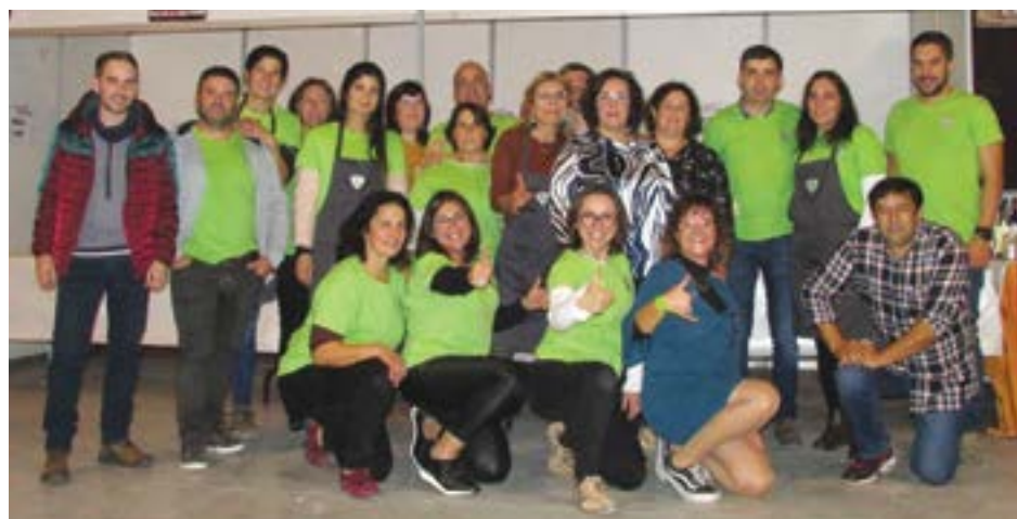
• Grupo que colaborou nesta edição do festival

Quem conhece o certame sabe, também, que a associação faz questão de não descurar os pormenores decorativos e, para isso, tem sempre uma temática como fio condutor. A escolha desta edição incidirá sobre o mar, mas não esqueceu o magusto, atendendo à proximidade ao São Martinho. A importância da re-