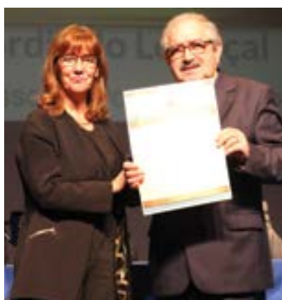
● Santa Casa da Misericórdia do Lourçal (Mérito Municipal Associativo, grau ouro)