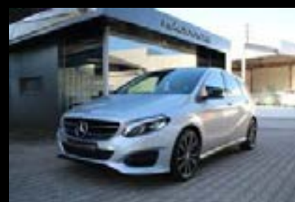
MERCEDES-BENZ B 180 CDI URBAN