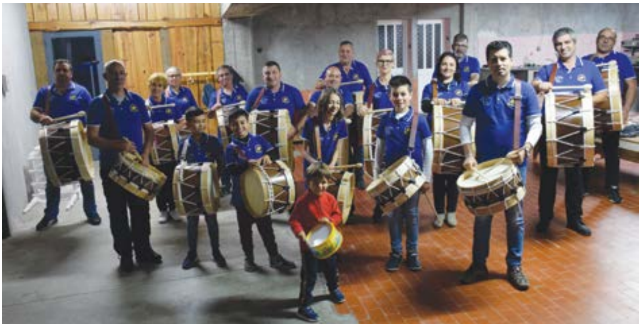
• Grupo de Bombos é constituído por elementos dos sete aos 70 anos

Quando foi criada, em 1998, a Orquestra Ligeira Juvenil Santo Elias, tinha “como objectivo fundar uma filarmónica”, no entanto, com a proximidade de outros projectos semelhantes na região, a ideia acabou por ser adaptada a uma Orquestra. Com o passar dos anos a actividade do colectivo passou a ser cada vez mais residual, ainda que a componente de formação nunca tenha deixado de existir. Desta forma, e com a necessidade de procurar novos