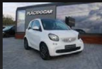
SMART FORTWO PRIME 1.0