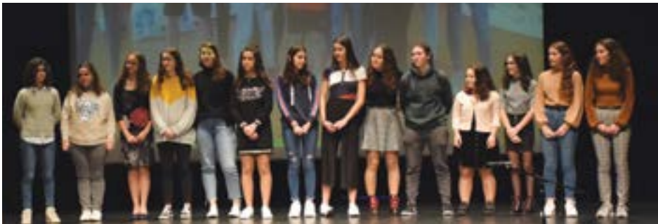
• A equipa feminina de basquetebol foi distinguida