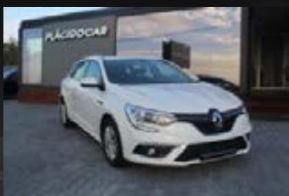
RENAULT MEGANE BREAK 1.5 DCI