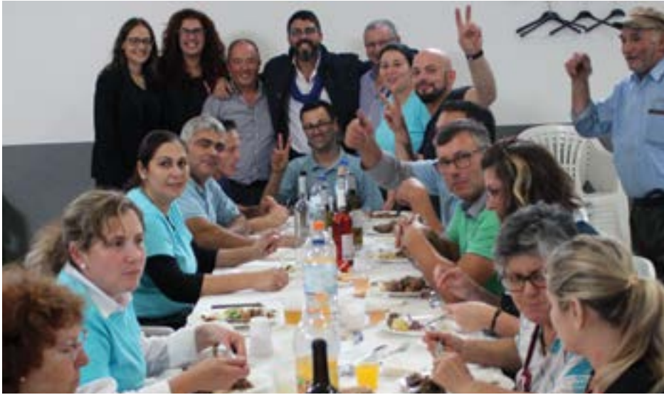
• O evento ficou marcado por momentos de boa-disposição entre a organização