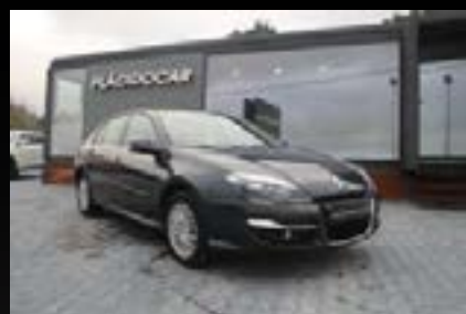
RENAULT LAGUNA 2.0 DCI DYNAMIQUE