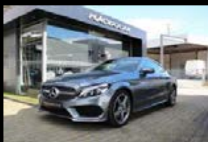
MERCEDES-BENZ C220 D COUPÉ AMG