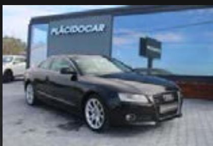
AUDI A5 3.0 TDI QUATTRO