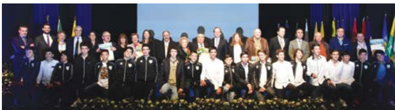
● Grupo de homenageados e autarcas posaram para a foto no final da cerimónia, no Teatro-Cine de Pombal