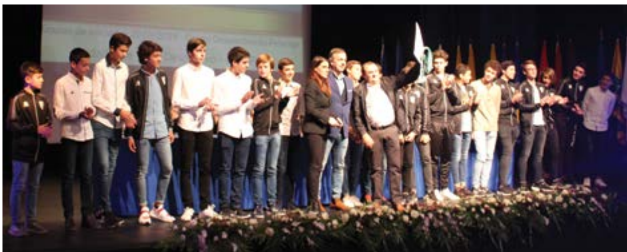
● Equipa Iniciados 2018/19 do Grupo Desportivo de Pelariga (Medalha de Valor Desportivo, grau prata)

município reconhece “os seus contributos, exemplo, trabalho, perseverança, es-