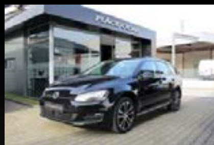
VOLKSWAGEN GOLF VARIANT 1.6 TDI COMFORTLINE DSG