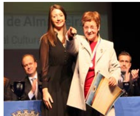
● Museu Etnográfico de Almagreira (Mérito Municipal Cultural, grau prata)