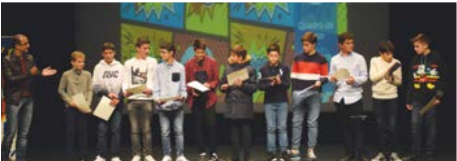
• A formação masculina de futsal também subiu ao palco