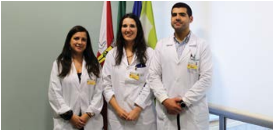
• A equipa é constituída por três médicos especialistas

O Centro Hospitalar de Leiria (CHL), que integra o Hospital Distrital de Pombal, passou a disponibilizar aos seus utentes um novo Serviço de Reumatologia, que visa a “prestação de cuidados diferenciados ao doente reumático”, actuando ao nível da “prevenção, diagnóstico e tratamento precoces”, em articulação com os diferentes profissionais.