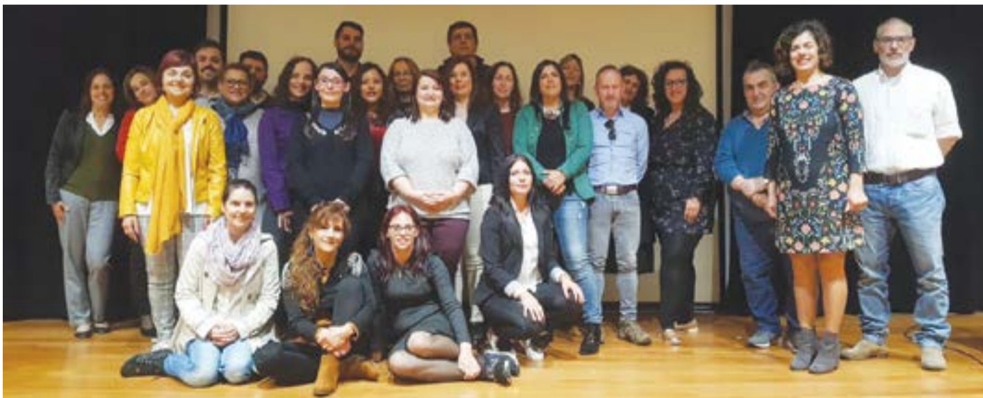
• No final da sessão, formandos e técnicos posaram para a foto no palco do mini-auditório do Teatro-Cine de Pombal

“Obrigações face à Autoridade Tributária” foi o tema da sessão de esclarecimentos dinamizada pelos formandos do curso técnico de Contabilidade, no dia 10 deste mês, no mini-auditório do Teatro-Cine de Pombal. Ao longo da manhã, o grupo de 18 formandos do Centro de Emprego e Formação Profissional de Leiria teve oportunidade de mostrar os conhecimentos teóricos adquiri-