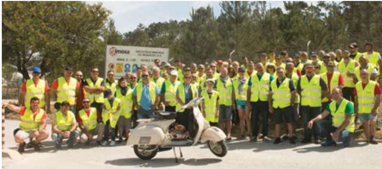
• Antes da visita guiada, o grupo juntou-se à entrada das instalações da empresa anfitriã

O roteiro incluiu passagem por várias localidades, uma paragem para reforço alimentar e a habitual visita a locais emblemáticos da região. Na edição deste ano, os vespistas foram recebidos na IMOSA, uma empresa portuguesa pertencente ao grupo Saint-Gobain, onde