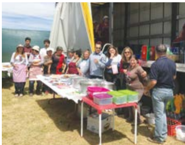
• As senhoras que estiveram no apoio ao evento