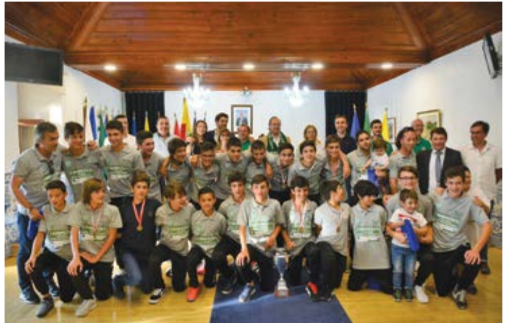
• A Câmara Municipal de Pombal recebeu e homenageou os atletas no passado dia 26 de Maio