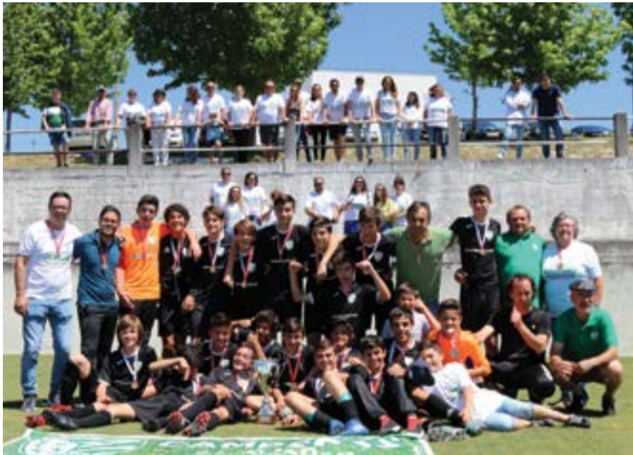
• Os atletas receberam as medalhas e a Taça de Campeão da Divisão de Honra na Boavista