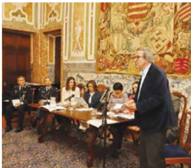
• O historiador durante a cerimónia de distinção

ção do Museu de Polícia Judiciária, o projecto SOS Azulejo “nasceu da necessidade de se combater a grave delapidação do património azulejar português, que se verifica actualmente de modo crescente e alarmante, por furto, vandalismo e incúria.” Os prémios destinam-se a galardoar os melhores trabalhos, projectos, estudos, contributos, obras