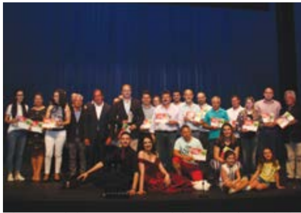
• O evento culminou com a entrega de lembranças às associações

A edição deste ano culminou com um evento que encheu o auditório principal do Teatro Cine de Pom-