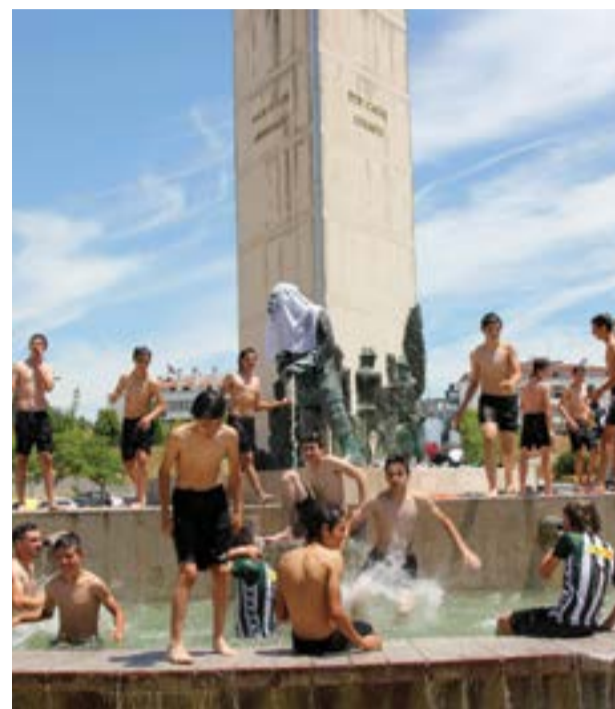
• Após a conquista da Taça, foi tudo a banhos na cidade

Está consumado um feito inédito na zona norte do distrito de Leiria, com uma equipa de iniciados a vencer na mesma temporada, o Campeonato da Divisão de Honra e a Taça Distrital.