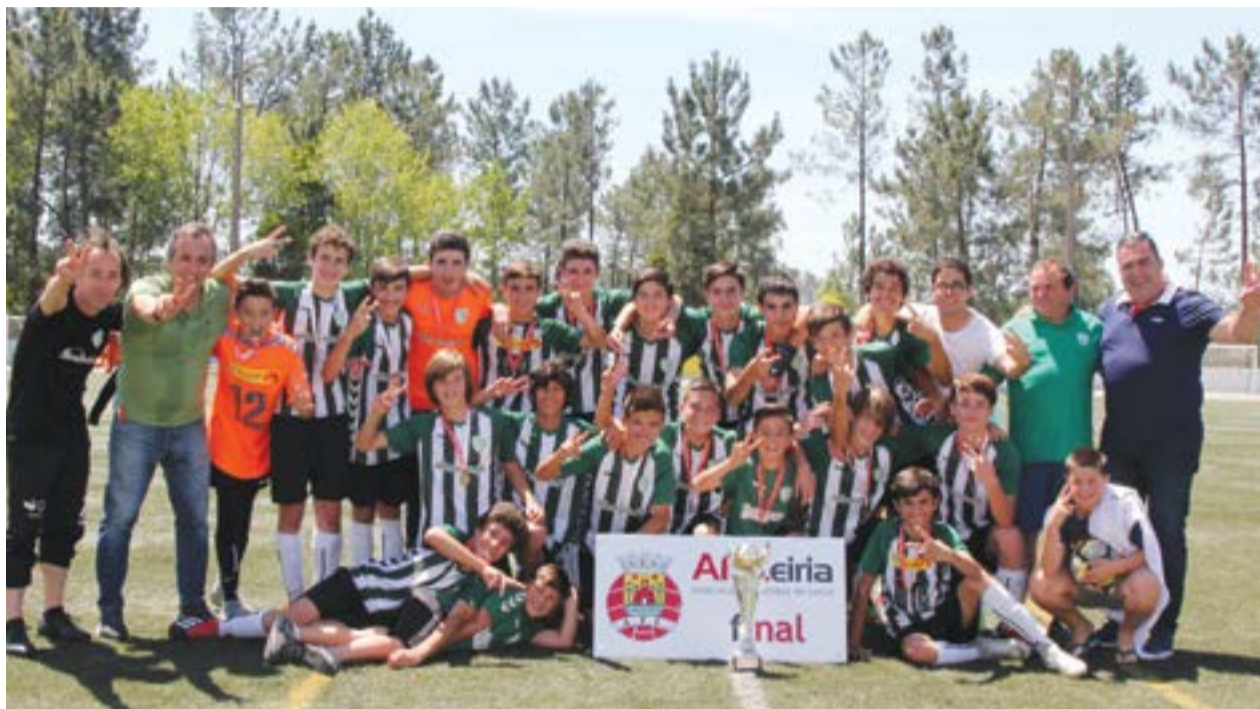
• Frente ao Caldas S.C, um dos clubes com mais história na AF Leiria, o GD Pelariga venceu a Taça no passado dia 2 Junho, nos Pousos