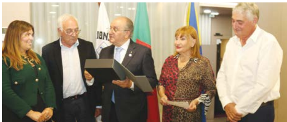
●O “Marquês de Honra” foi entregue a um dos filhos do empresário pelo Governador