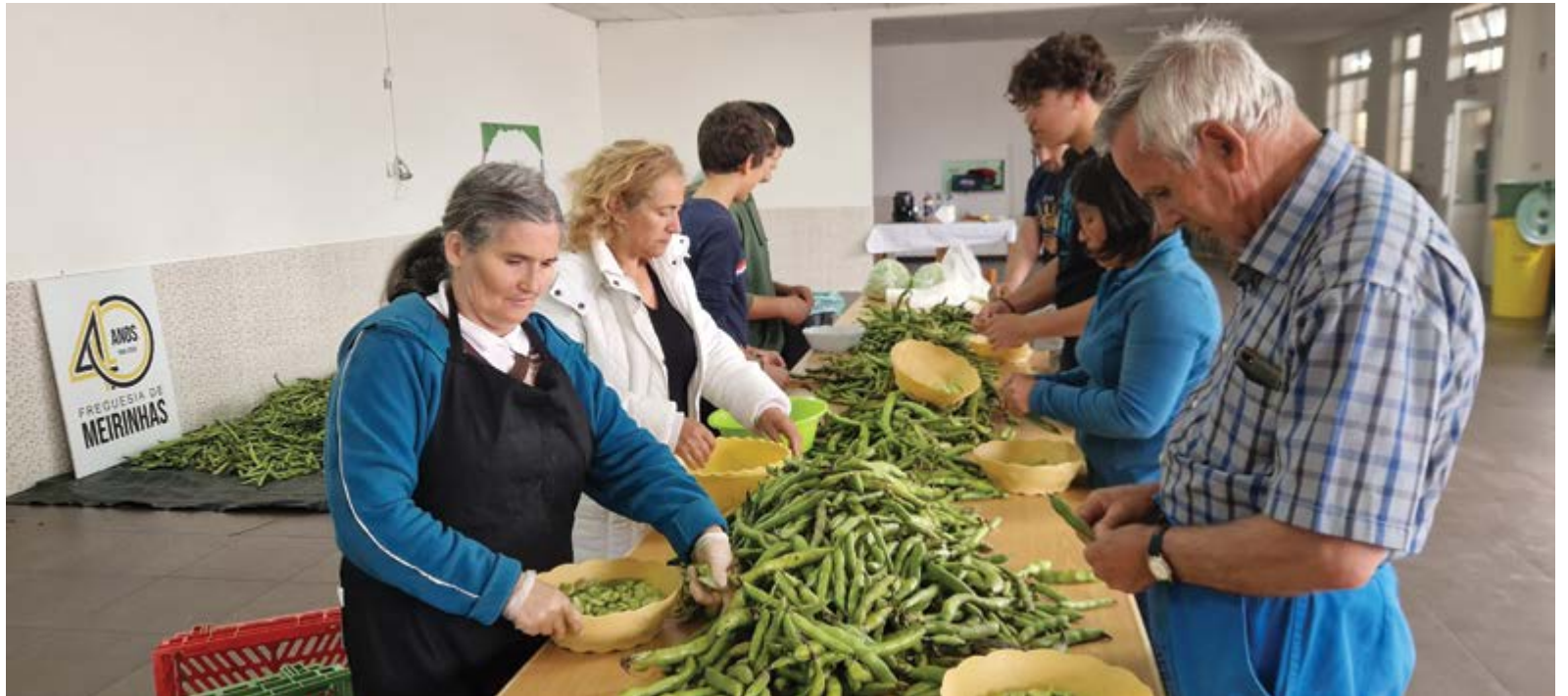
●As favas foram debulhadas por voluntários, crianças do centro escolar e utentes do Lar da Felicidade

“O Festival da Fava é um festival comunitário e participativo, em que a própria comunidade é que faz o festival, desde a plantação das favas até à apanha”, explica o presidente da Junta de Freguesia. Este ano, foram apanhados 1200 quilos