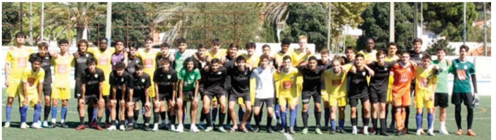
• O último jogo aconteceu no campo do Trafaria frente à formação da Charneca da Caparica, com a Pelariga a vencer por 4-1

A equipa junior da Pelariga estagiou durante três dias no concelho de Almada, aproveitando o bom tempo que se fez sentir na Praia da Costa da Caparica. Realizou um treino no