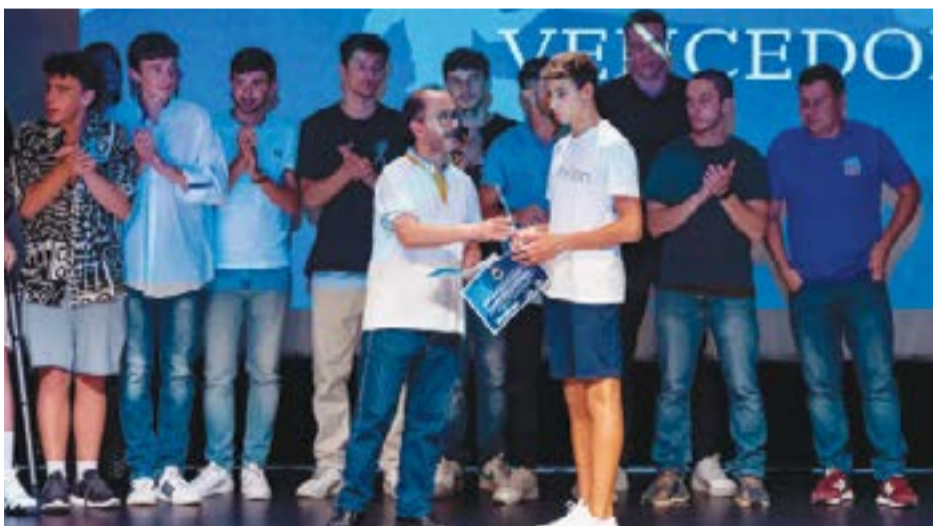
• Os Iniciados da AD Pedro Roma foram distinguidos na categoria equipa do ano. Para o mesmo prémio estavam nomeadas as equipas de basquetebol Sub16 masculinos (NDAP), andebol Sub16 masculinos (NDAP), futebol sénior Sporting Clube de Pombal, futebol sénior ACD Caseirinhos, futsal sénior feminina (NSP).