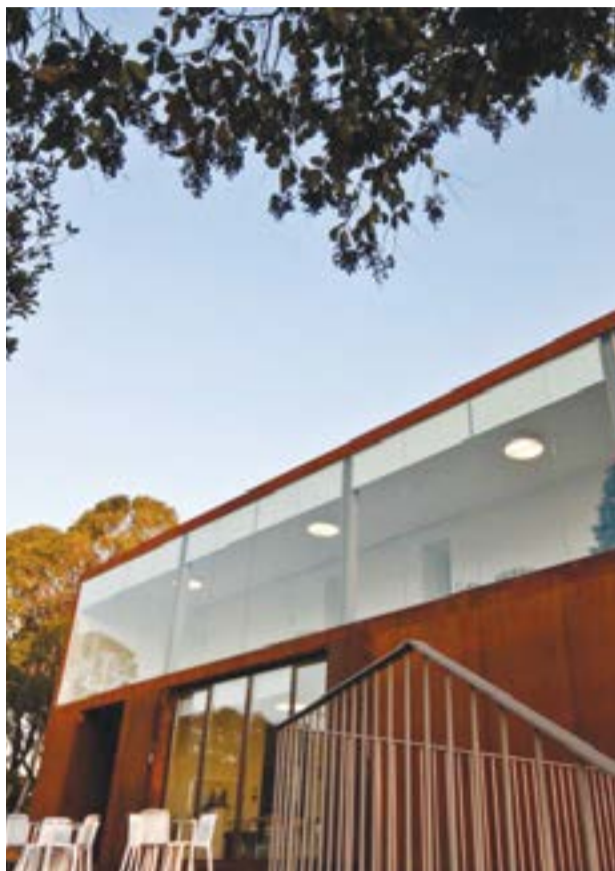
• O arrendatário vai usufruir de descontos na renda, no âmbito do apoio ao empreendedorismo

De acordo com a proposta aprovada por maioria, o arrendatário vai usufruir de “uma redução” na renda de 50% no primeiro ano, 40% no segundo e 20% no terceiro. Estes descontos têm a ver com uma “medida de apoio ao empreende-