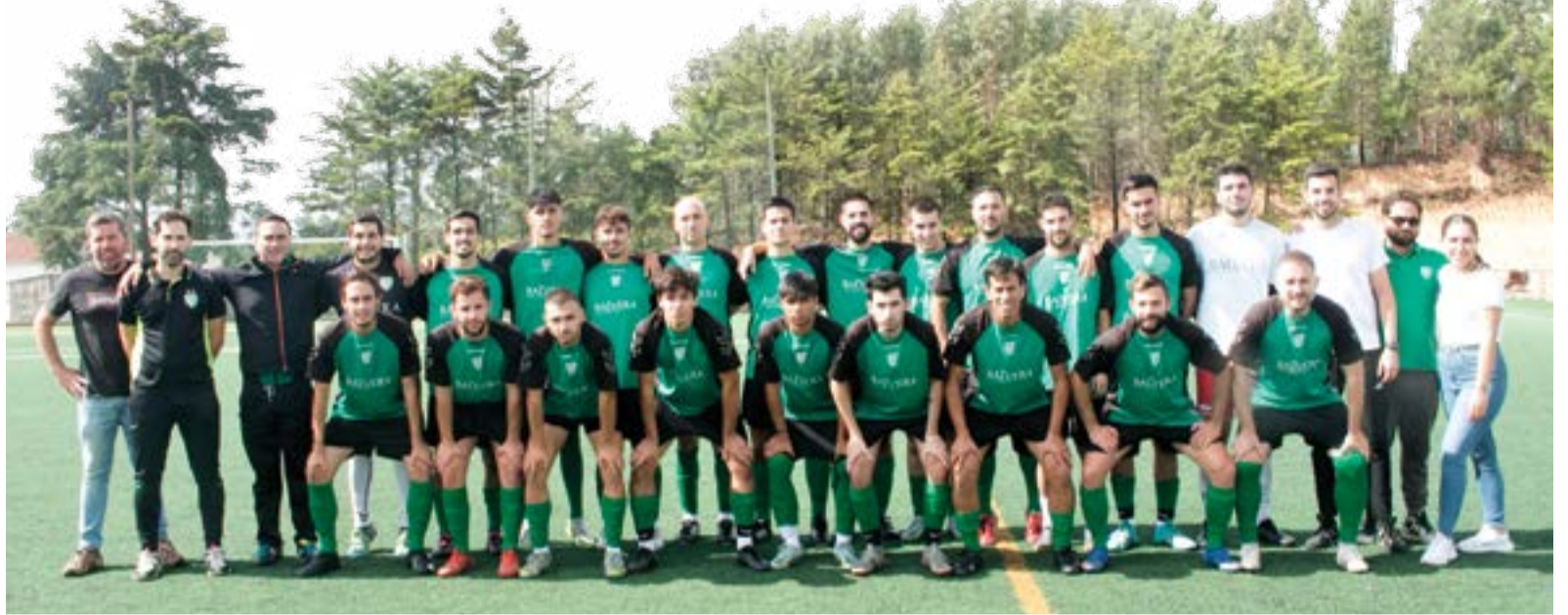
• Jogadores do Grupo Desportivo da Pelariga que alinharam nos jogos do primeiro dia, tendo empatado com o Motor Clube e vencido o Condeixa por 2-1, garantido a final