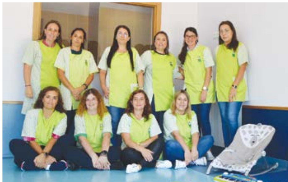
• Colaboradoras da valência de creche