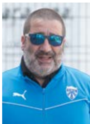
● DIRECTOR ● Pedro Carreira