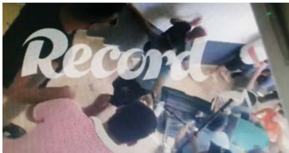
● As imagens dos descalatos foram divulgadas pelo jornal Record

O jogo referente à 2ª eliminatória da Taça de Portugal disputado entre o Sporting de Pombal e o Tondela (II Liga) ficou marcado pelos descalatos ocorridos já na parte final da partida. O jogo estava decidido, com o Tondela a vencer por 0-4, quando o inesperado aconteceu. Apesar dos adeptos terem ficado separados, em bancadas em lados opostos do relvado, cerca de uma dezena de adeptos tondelenses entraram na bancada onde estava o público do Sporting de Pombal e dirigiu-se para a zona onde estava uma pequena claque pombalense. Rapidamente os ânimos aqueceram e chegaram ao confronto físico, no corredor por detrás da bancada principal do Municipal de Pombal. Os agentes da PSP, presentes em maior número do que é habitual, tiveram que usar a força para manter a ordem. A partida esteve interrompida durante cerca de cinco minutos, com o Tondela a marcar mais um gol