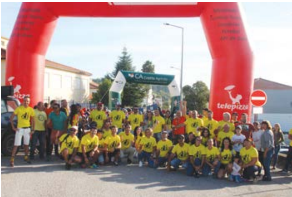
● Voluntários e atletas momentos antes da partida para mais um raid

A 18ª edição do Raid BTT Lama Solta voltou a não defraudar as expectativas e há mesmo quem reconheça que foram superadas. Ao todo, 563 adeptos da modalidade, repartidos pelas duas distâncias à escolha, percorreram, na manhã de domingo (dia 24), trilhos da freguesia do