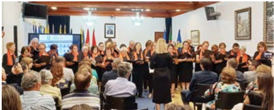
• Actuação do coro do Centro Educativo Sénior de Pombal, na cerimónia

Dos 30 utentes iniciais, esta academia de Pombal tem já 94. “Queremos crescer. Há até uma proposta para a criação de um campus educativo sénior de toda a região do Sicó, envolvendo os seis municípios”, revelou Ricardo Pocinho.