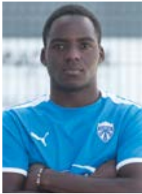
● AVANÇADO ● Zango (21 anos) ● ex-Naval Figueira da Foz