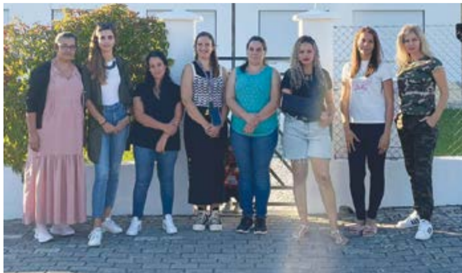
• Nenhum encarregado de educação concorda com o encerramento do antigo jardim-de-infância

Portanto, “no meu ponto de vista, a actual sala de aula é muito mais perigosa e não tem espaço suficiente para 21 crianças brincarem à vontade”. Por isso, os pais não aceitam a transferência