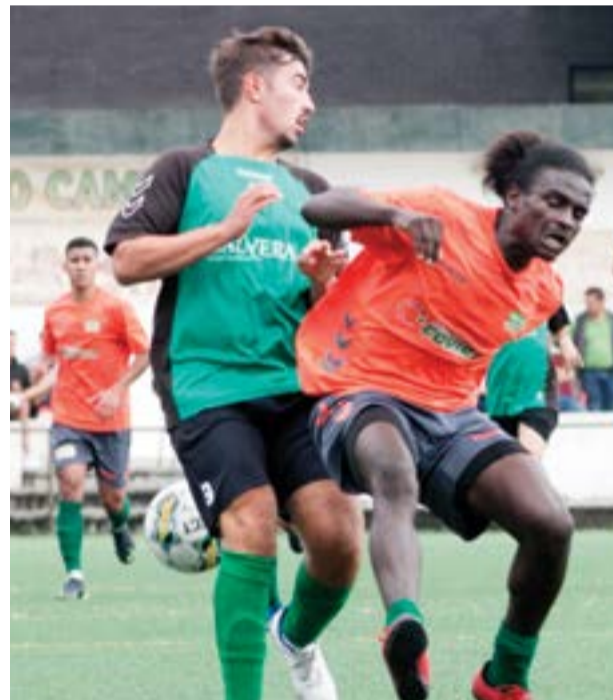
• No primeiro jogo, a Pelariga empatou com o Motor Clube