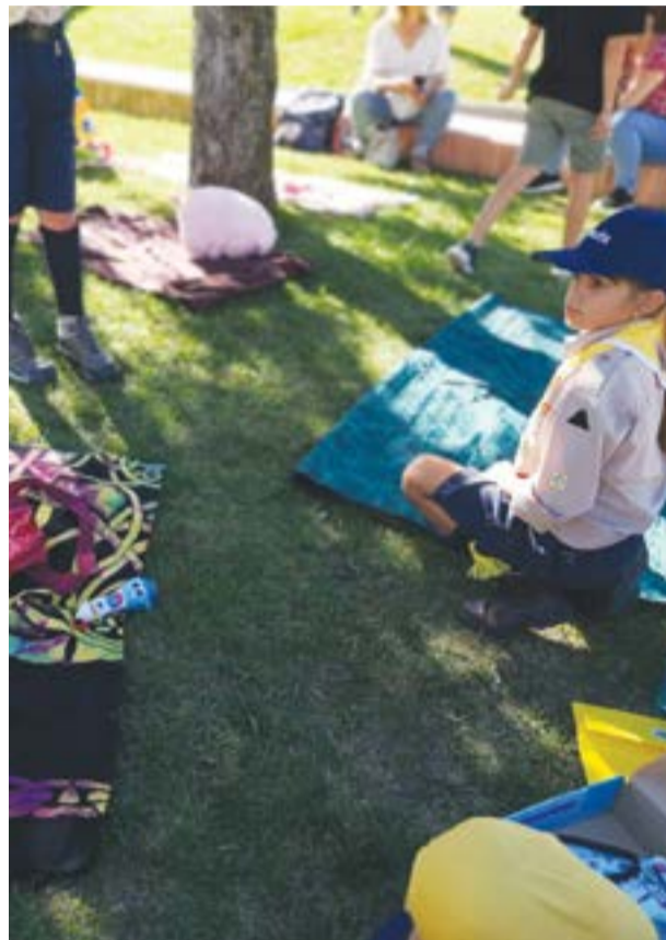
• O mercado de trocas infantil volta a integrar o programa de sábado

O Jardim do Cardal é o palco principal das actividades, que decorrem a partir das 15h00 de sábado, com a habitual mostra de artesanato a dar o pontapé de partida, dinamizada pela ADAP. O programa da tarde está também delineado a pensar nos mais pequenos, com a realização de um mercado de trocas infantil, numa iniciativa do Agrupamento de Escolas 674 Pombal com o apoio da Junta, que procura sensibilizar para a prática da reutilização e da economia circular. Destina-se a crianças entre os seis e os