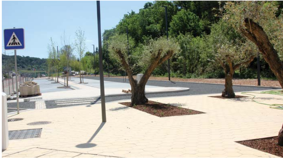
• O término da obra está dependente da entrega das docas de bikesharing e das papeleiras