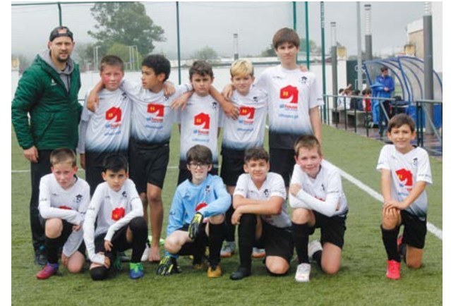
• Equipa de infantis 'B' que defrontou o CCMI no passado dia 9

A Academia Happyball continua a conquistar o seu espaço no concelho de Pombal, com critérios e bases fortes no apoio ao desporto de atletas dos quatro aos 17 anos.