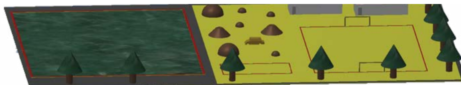
• Maquete para o que se pretende no exterior, desde parque de merendas a campo de futebol

São esperados aproximadamente 150 participantes, com o BTT a ser uma novidade. Aceitam-se inscrições no próprio dia,