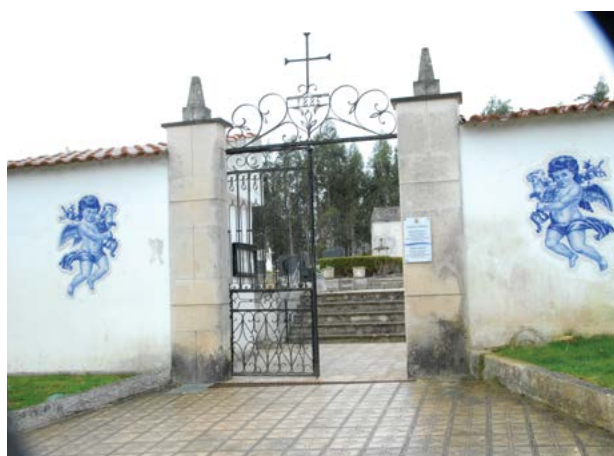
● O cemitério está aberto diariamente, em horário convencional