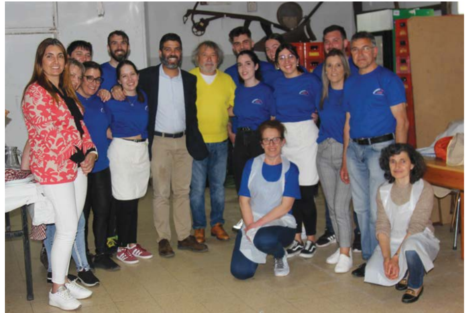
• Elementos de trabalho da comissão receberam as entidades oficiais no almoço de segunda-feira

Outra novidade apresentada foi o regresso do desporto à colectividade, com novas equipas de basquetebol feminino. Os treinos vão decorrer no pavilhão gimnodesportivo de Albergaria dos Doze, estando já as inscrições abertas.