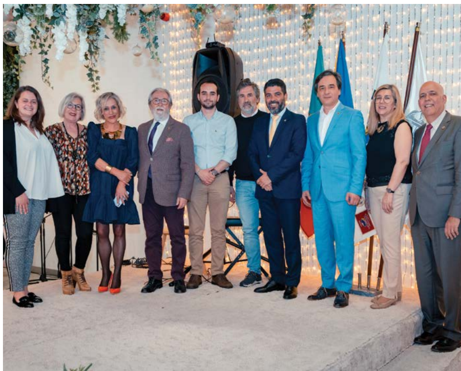
• Elementos dos Lions, Leos e Bombeiros Voluntários de Pombal durante o almoço

“Para nós, Lions, estarmos junto da comunidade de Pombal, solidária com os Bombeiros Voluntários, enche-nos a todos de satis-