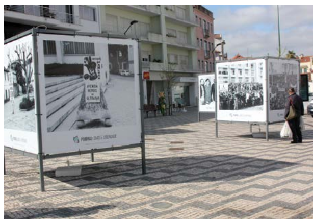
• A exposição “Pombal: Dias da Liberdade” está patente no Cardal