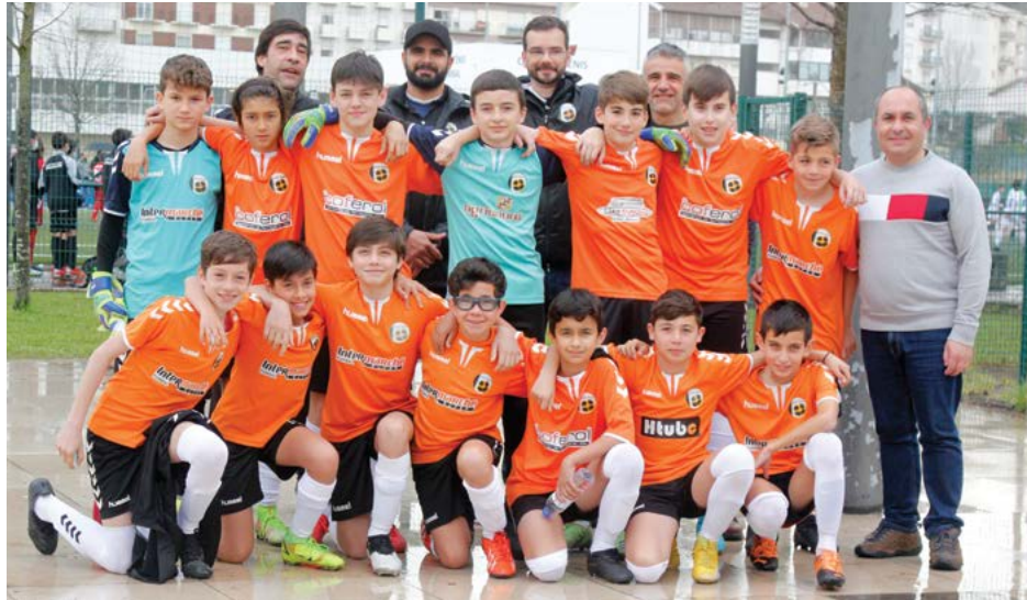
• Formação que esteve no primeiro jogo da fase final do escalão de Sub'13 em futebol de sete