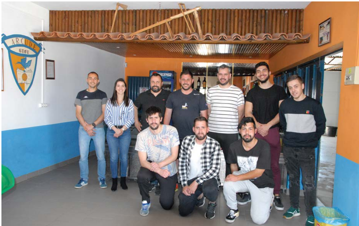
• Os novos elementos da Associação Recreativa Cultural e Desportiva do Grou foram eleitos no passado mês de Março