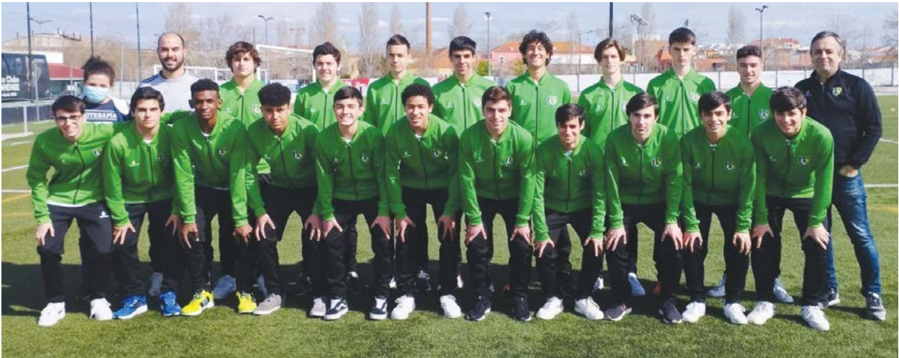
• A formação do Sporting Clube de Pombal vai jogar as meias finais em casa, a 28 de Maio, frente ao Marrazes