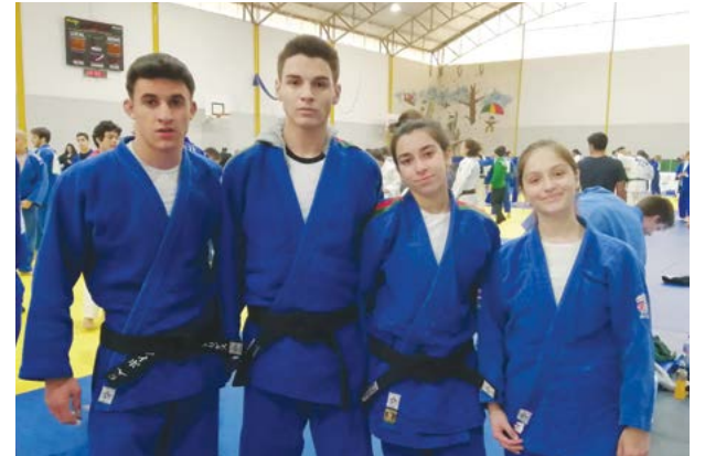
• A Escola de Pombal fez-se representar por quatro judocas

Realizou-se no dia 16 de abril no Pavilhão Desportivo do Colégio Imaculada Conceição, Cernache, o Campeonato Nacional de Sub'23, prova destinada a atletas com idades compreendidas entre os 18 e os 22 anos, de ambos os sexos, e que contou com uma elevada participação, estando presentes judocas de todos os distritos do país. Estiveram presentes 113 judocas (72 masculinos e 41 femininos) distribuídos por 14 categorias de peso.