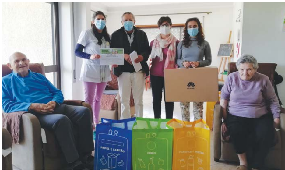
● Lar Verde Recanto recebeu um computador

"Estão de parabéns as instituições participantes, pela forma dedicada, divertida e criativa com que