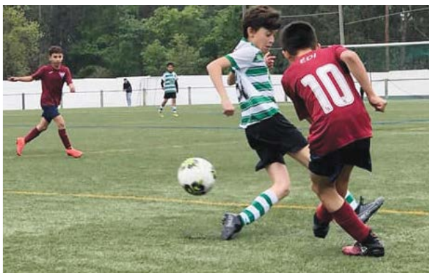
• Marcaram presença 29 colectividades, totalizando 68 equipas