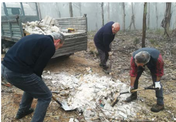
• Foram recolhidas quatro carrinhas de resíduos. Voluntários que colaboraram nas acções

A iniciativa, que contou com o apoio da União de Freguesias de Santiago e São Simão de Litém e Albergaria dos Doze, não se restringiu, contudo, à recolha de resíduos. "Juntamente com esta acção pro-