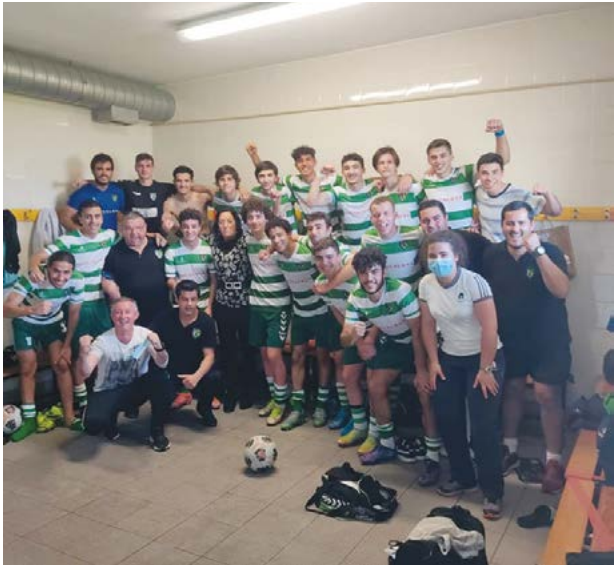
• Equipa continua a festejar, somando a sétima vitória