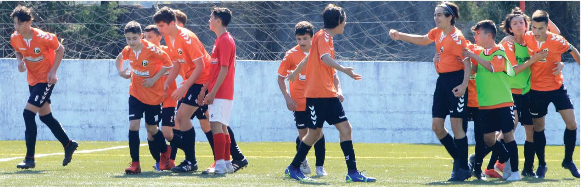
• A equipa festeja o primeiro golo, que voltaria a suceder por mais duas vezes. Um grupo que também está bem alinhado no campeonato, em que é líder da zona norte da primeira divisão

dades para ampliar o marcador. Não o fez, mas garante uma presença na final da Taça, sendo a quarta equipa do concelho a conseguir tal proeza, em que o Sporting de Pombal e GD Pelariga já a venceram. A AD Pedro Roma terá o jogo decisivo a 5 de Junho, com o campo ainda por definir, frente a outra escola de futebol, CCMI, em clara ascensão no futebol. A formação de Leiria já garantiu o título distrital e consequente subida pela primeira vez, aos campeonatos nacionais. Enquanto não acontece esse momento mágico, a AD Pedro Roma tentará outra conquista de uma final, agora, no campeonato da primeira divisão. A formação está a ter um bom desempenho, sendo líder da zona norte, com quatro jogos e outras tantas vitórias. Volta a jogar no dia 24, recebendo nos Caseirinhos, às 10 horas, o Costifoot