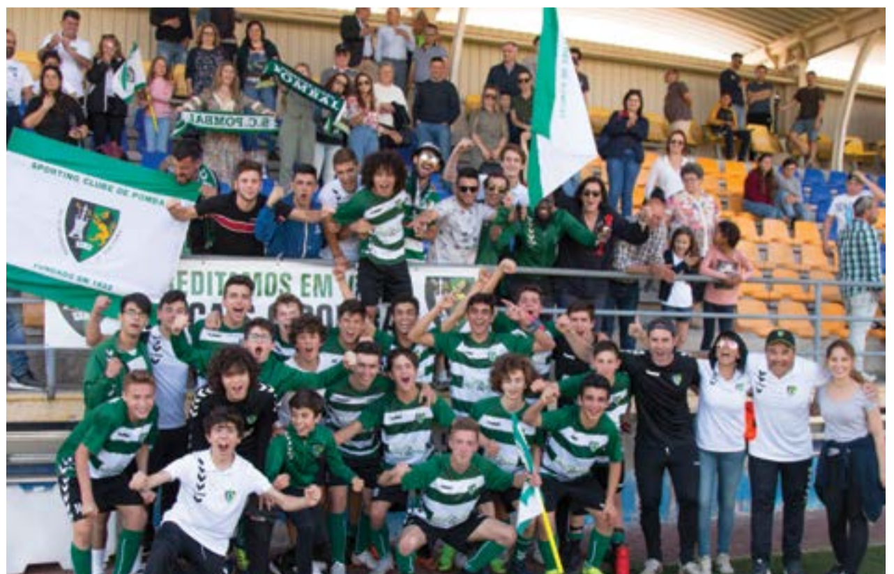
• Equipa de juvenis que venceu no reduto do Avelarense, e que vai defrontar o Peniche na Final da Taça de Juvenis, agendada para 1 de Junho