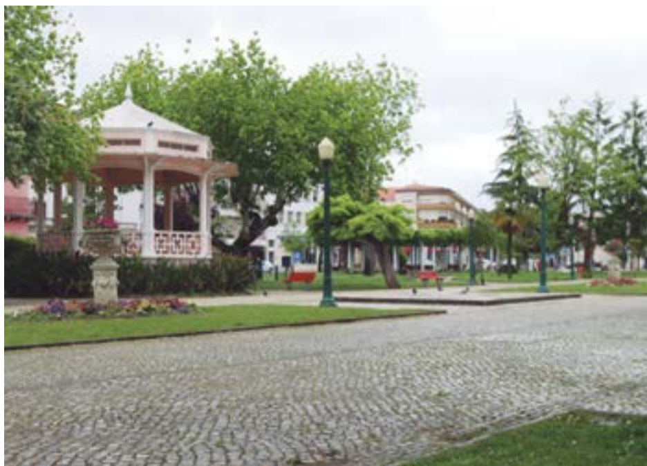
• O projecto prevê melhorias que facilitem a realização de eventos no local

De entre outras intervenções, o projecto pretende recuperar o espaço (percursos, pavimentos e vegetação) “tendo em conta a identidade do lugar e o projecto original, promovendo uma adaptação às necessidades e expectativas actuais, através de uma reinterpretação das intenções e utilização de materiais compatíveis com