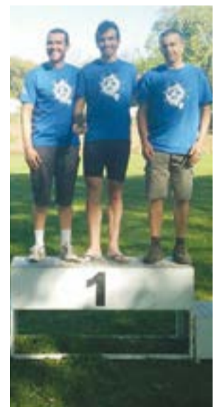
• Atletas que triunfaram no passado dia 4

2019: Clube Campeão Nacional de Orientação em BTT no escalão de Seniores Masculinos (Sprint).