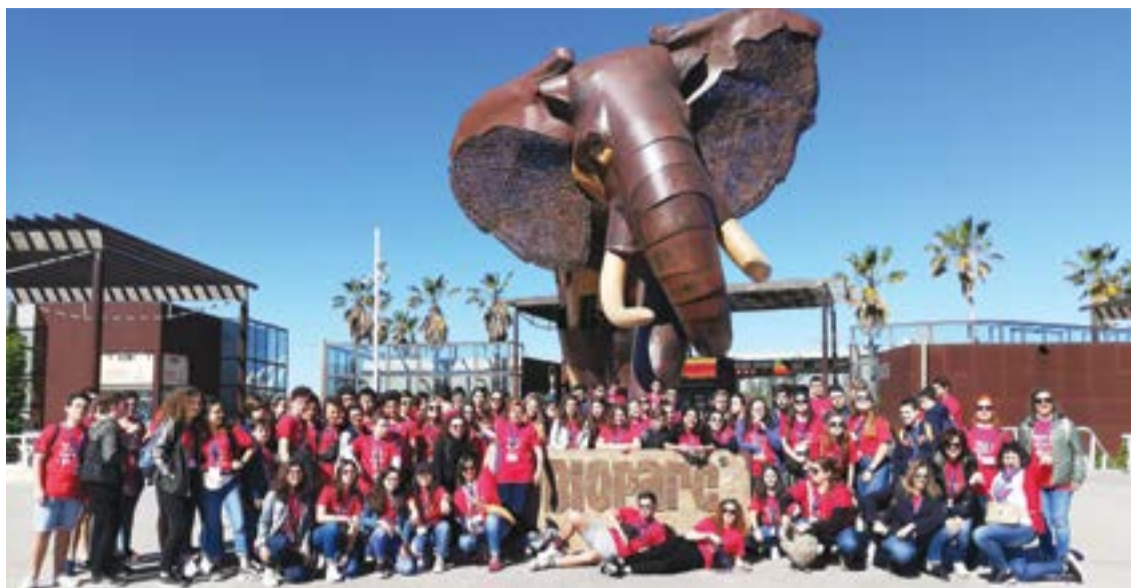
Agrupamento de Escolas de Pombal