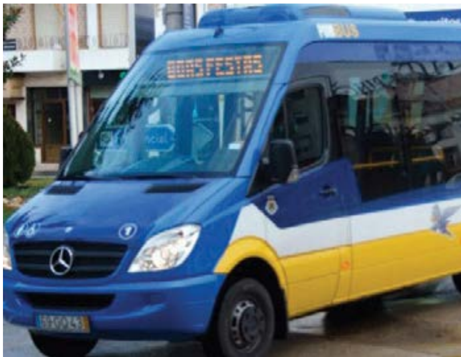
• De acordo com a autarquia, a redução é aplicada na renovação ou na adesão ao passe mensal

cipal, “para beneficiar desta medida, os utentes deverão preencher o requerimento elaborado para o efeito pela CIMRL, sendo o desconto de 50 por cento aplicado directamente aquando do carregamento do passe junto do respectivo operador”. “A emissão de novos