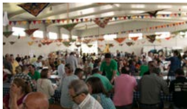
• A restauração atraiu multidões ao longo dos dois dias