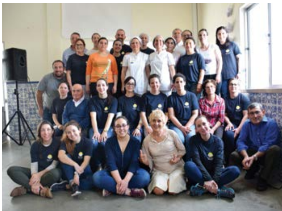
• Grupo de colaboradores do Centro Social que dinamizaram o almoço convívio

Com a realização desta actividade, a população ajuda a colectividade, mas o contrário também acontece, uma vez que "estas iniciativas acabam por representar a união da população da freguesia no sentido