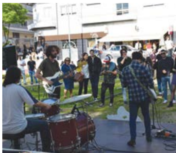
• O Jardim da Várzea foi um dos espaços que receberam actuações

Durante dois dias, passaram pelo Celeiro do Mar-