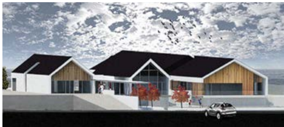
• O futuro edifício terá uma ligação ao recinto da escola C+S da Guia

O novo centro escolar será distribuído por um só piso, e terá, para além das respectivas salas de aula, zona administrativa, um refeitó-