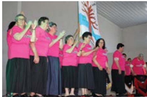
• O projecto Paripasso contribuiu para a animação do evento

A recreação da Feira dos Sete já dispensa apresentações. O certame organizado pela Junta de Freguesia do