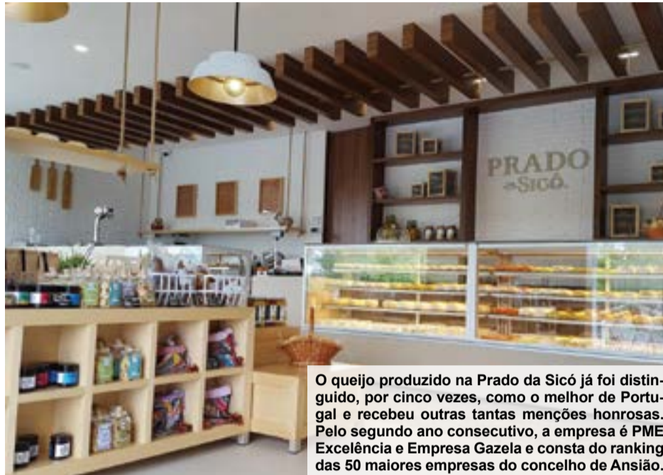
O queijo produzido na Prado da Sicó já foi distinguido, por cinco vezes, como o melhor de Portugal e recebeu outras tantas menções honrosas. Pelo segundo ano consecutivo, a empresa é PME Excelência e Empresa Gazela e consta do ranking das 50 maiores empresas do concelho de Ansião.

Com um mercado sem fronteiras no território nacional, e onde o comércio tradicional é a prioridade