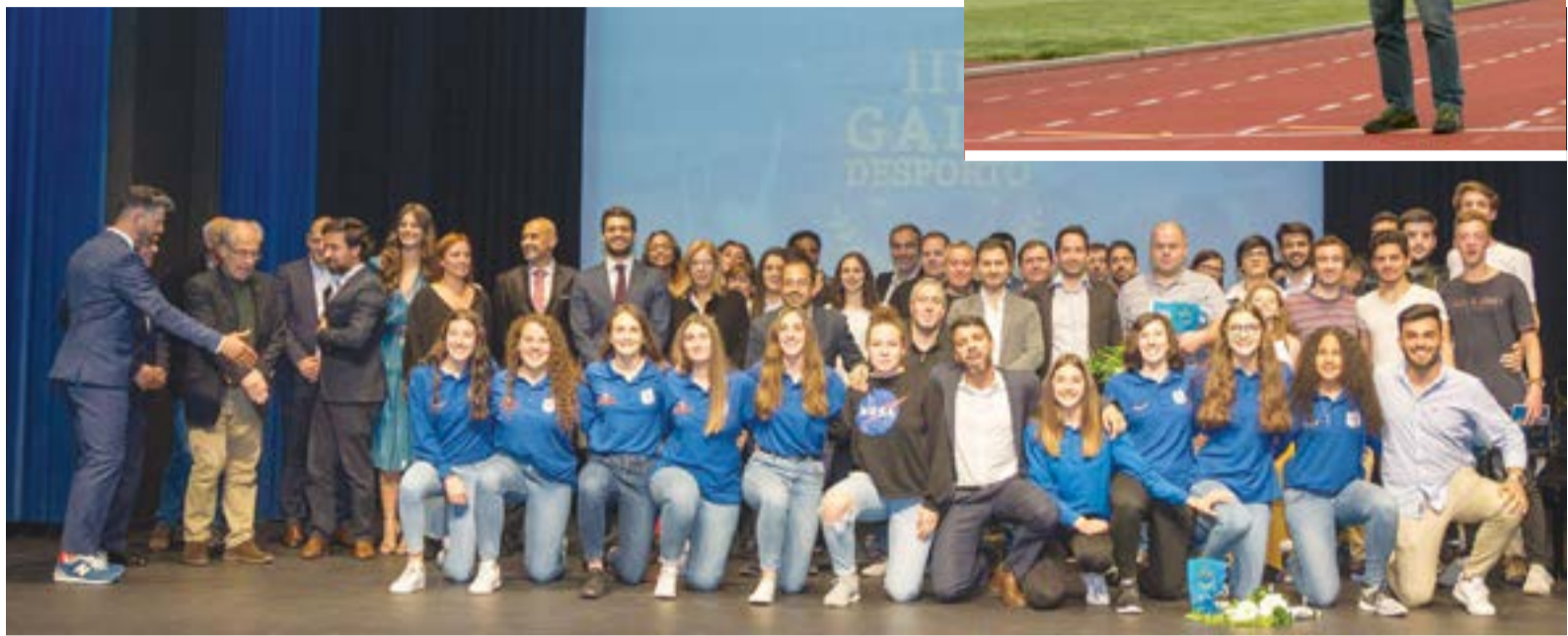
• No final da gala, distinguidos posaram para a foto com autarcas.

Ao longo da sua carreira, muitos foram os títulos que conquistou. Além dos inúmeros títulos como campeão regional de Coimbra e Lisboa de atletismo em 800 e 1500 metros, sagrou-se Campeão Nacional de Atletismo em 1500 metros, em 1986; Campeão Nacional em 800 metros e 1500 metros, em 1987; Campeão Nacional por Equipas, em 1987 e 1988. Recorde-se ainda que na época de 1991, ganhou nos 5000 metros tudo o que havia para ganhar, nomeadamente, o Campeonato de Lisboa, o Campeonato de Clubes e os Campeonatos de Portugal. Foi ainda, nesse mesmo ano, Campeão Nacional de Pista