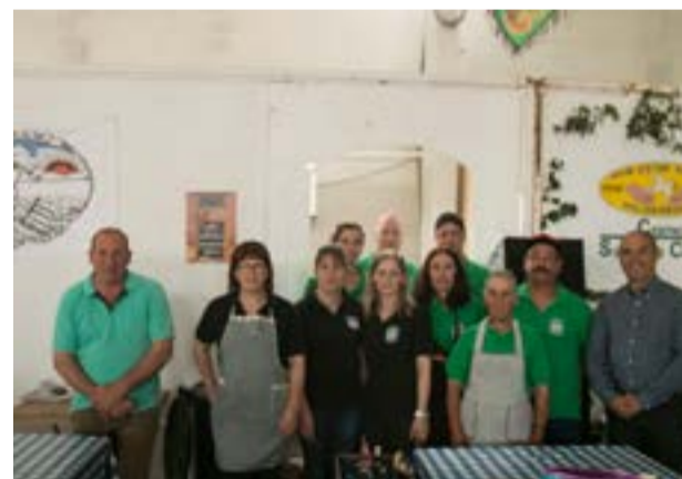
• Os Alhais voltaram a estar na ‘cozinha’ e a ‘dançar’