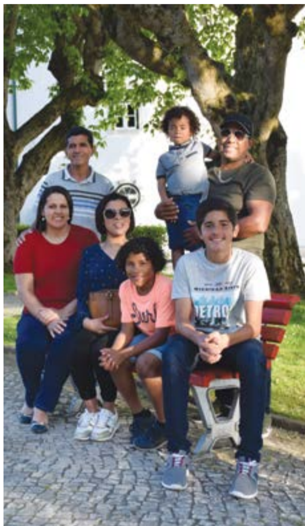
• Duas das famílias que escolheram Pombal para viver

Aqui, “cheguei sem conhecer ninguém, três meses depois da chegada do meu marido, que veio mais cedo”, mas em pouco tempo criou um “elo de ligação” com os locais. “A integração foi um processo fácil, tive a sorte de me cruzar com pessoas sérias e boas”, que acabaram por “se transformar na família que não tinha em Portugal”, e re-