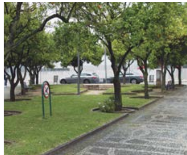
• O projecto pretende criar uma praça enquadrada na malha urbana

A empreitada visa, igualmente, aumentar a segurança dos peões, a eliminação dos conflitos de trânsito e de estacionamento abusivo, a eliminação de barreiras arquitectónicas e a renovação das infra-estruturas existentes.