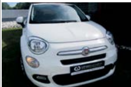
Fiat 500X 1.3 MJET 90 Cv | Ano 2016