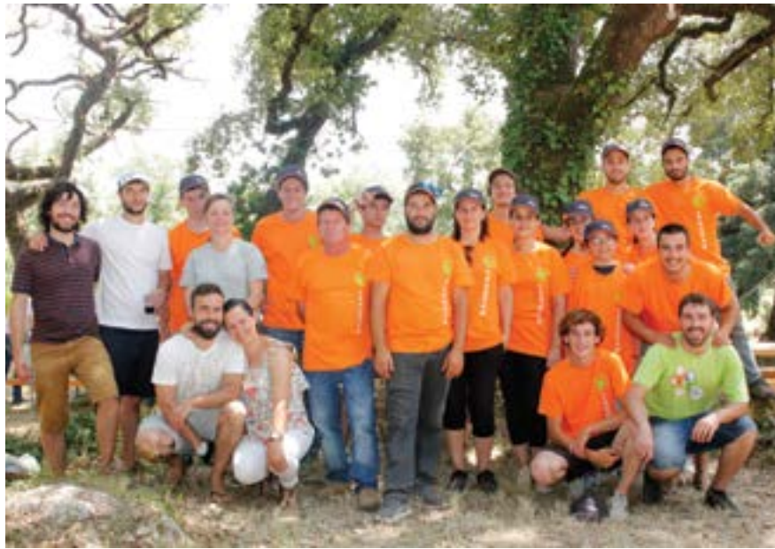
• Elementos que colaboraram na organização do evento, que juntou cerca de 30 participantes

A Festa da Sombra realizou-se este fim-de-semana, dias 13 e 14, e, tal como no passado, decorreu no mesmo local, protegida pela sombra dos carvalhos (que deu o nome aos festejos),