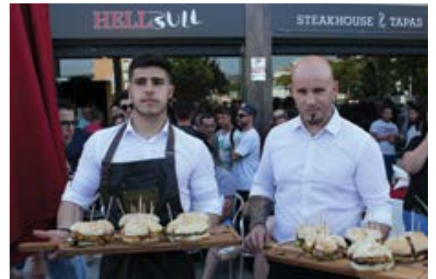
• Os hambúrgueres caseiros são uma das atrações do cardápio