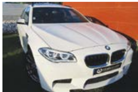
BMW M550D Touring X Drive 385 Cv | Ano 2015