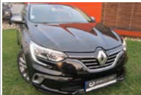
Renault Megane GT Line 1.2 TSI 130 Cv | Ano 2015

O nosso objetivo é satisfazer os nossos clientes