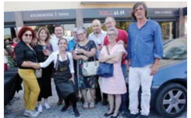
• A animação foi uma constante entre os convidados