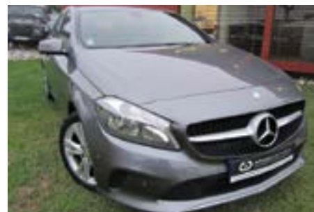
Mercedes Bens A 180 CDI Urban 110 Cv | Ano 2016