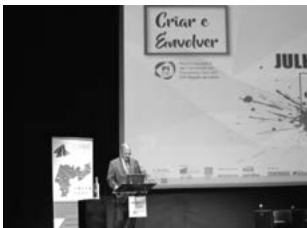
• Raul Castro durante a intervenção

Raul Castro realçou o papel que os professores con-