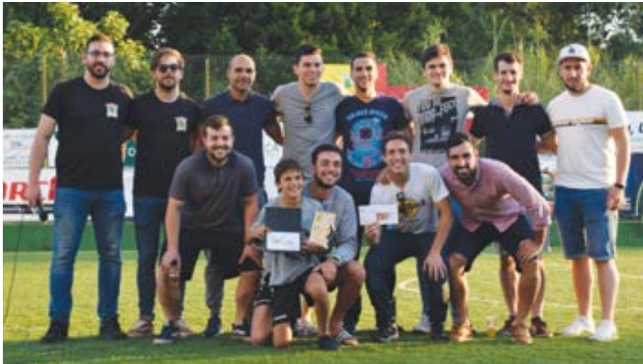
• Equipa patrocinada pela empresa “PedraDecor” foi a vencedora do Torneio e do Bar