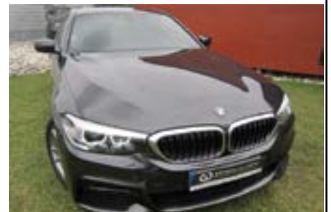
BMW 520 D Auto Pack M 190 Cv | Ano 2018

Estrada Nacional 1 | 3105-296 | Pelariga Pombal | Tele:236 218 997 Tm: 917 540 452 | geral@scautomoveis.com