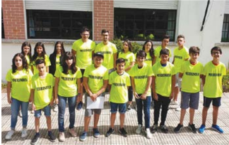
• Voluntários que participaram na acção