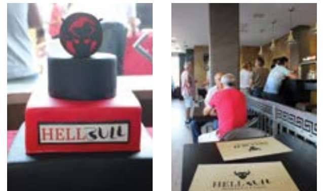
• O espaço está aberto diariamente e com tapas a qualquer hora