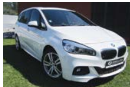
BMW 218 Gran Tourer Pack M 150 Cv | Ano 2015