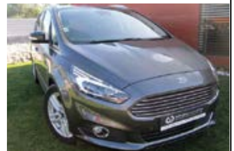
Ford S-Max 2.0 TCDI Titanium 7 Lugares 180 Cv | Ano 2016