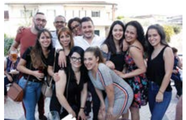
• Muitos amigos da gerência quiseram conhecer o novo espaço

O Hell Bull vai estar aberto todos os dias, com refeições ao almoço e jantar. Além disso, serve tapas a qualquer hora do dia.