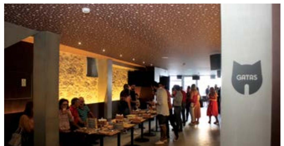
• Sala do Bar