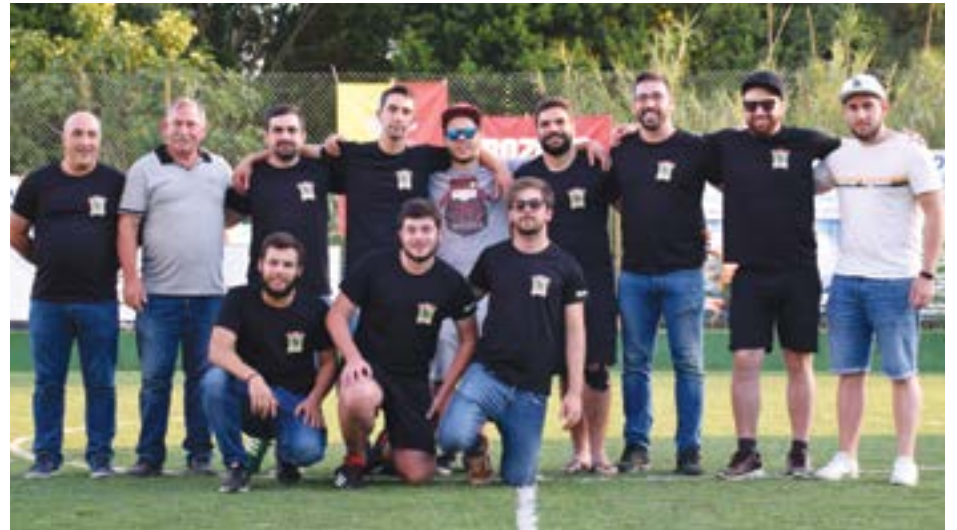
• Elementos da associação, num dia que ficou marcado pela estreia do piso sintético do parque de jogos