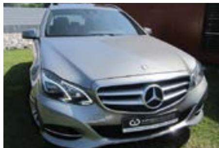
Mercedes Bens E 250 Avantgarde Station 204 Cv | Ano 2015