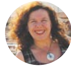
Por: Lidia Ribeiro