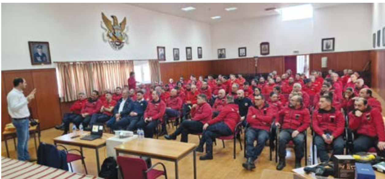
• O salão nobre do quartel de Pombal recebeu cerca de 80 bombeiros nesta acção

Acção juntou cerca de 80 soldados da paz no quartel de Pombal