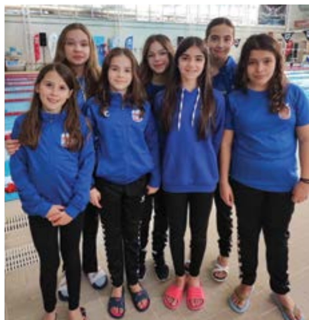
• Atletas que estiveram no campeonato interdistrital de infantis