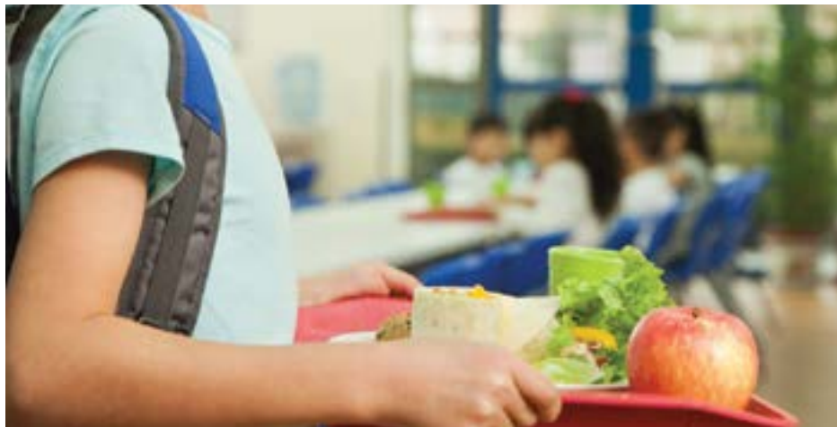
• O Governo paga ao município 2,75 euros por refeição

A proposta, que pretende minimizar o desequilíbrio financeiro entre o valor comparticipado pela administração central e o custo real de cada refeição, surge, segundo o município, na sequência de reuniões realizadas com todas as juntas de freguesia, entidades a quem o município delegou o fornecimento das refeições escolares às crianças do Pré-Escolar e aos alunos do 1º Ciclo do Ensino Básico (CEB) com o objectivo de “garantir o aumento da eficiência da gestão dos recursos, a melhoria da qualidade dos serviços presta-