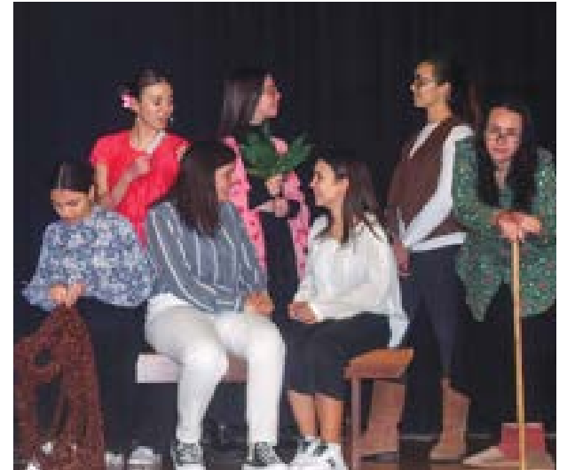
● O grupo estreou a peça no dia 24, em Almagreira

O Grupo Amador de Teatro de Almagreira (GATA), através da sua secção Júnior, volta a participar no Festival de Teatro de Pombal. No próximo dia 9 de Março, às 21h30, apresenta a peça "O Regresso dos que Nunca Foram" na Associação C. R. da Marinha da Guia, na freguesia do Carriço. A estreia desta produção aconteceu no passado sábado, em Almagreira.