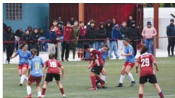
• A Ilha inicia a segunda volta no Porto, frente ao Boavista

No plano feminino, a formação sénior do Ilha, viaja no domingo, dia 3, até ao norte, para iniciar a segunda volta. Um encontro no Parque Desportivo de Ramalde, com início às 19 horas, frente ao Boavista, numa competição em que os dois últimos descem de divisão, enquanto o quinto e o sexto, jogam um play-off de manutenção. Dia 9, recebem o Setúbal.