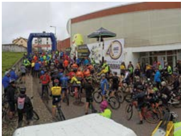
• O evento iniciou junto ao pavilhão gimnodesportivo

A quinta edição do passeio de BTT - Rota das Laranjeiras nas Meirinhas, que decorreu no passado dia 25, reuniu mais de 300 participantes, apesar da chuva que marcou presença em alguns momentos.