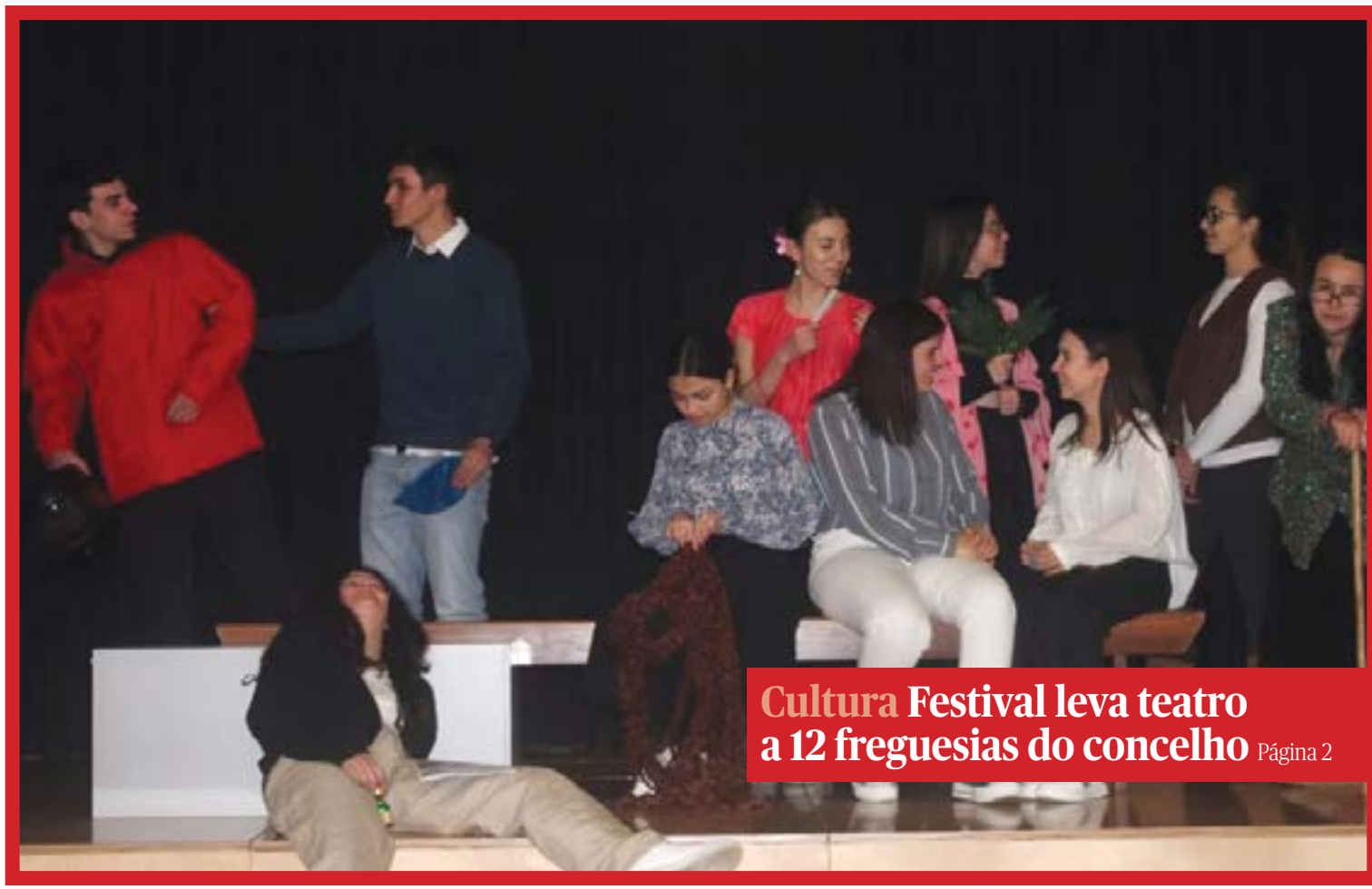
Cultura Festival leva teatro a 12 freguesias do concelho Página 2

Legislativas Jovens falam sobre o interesse pela política Página 4