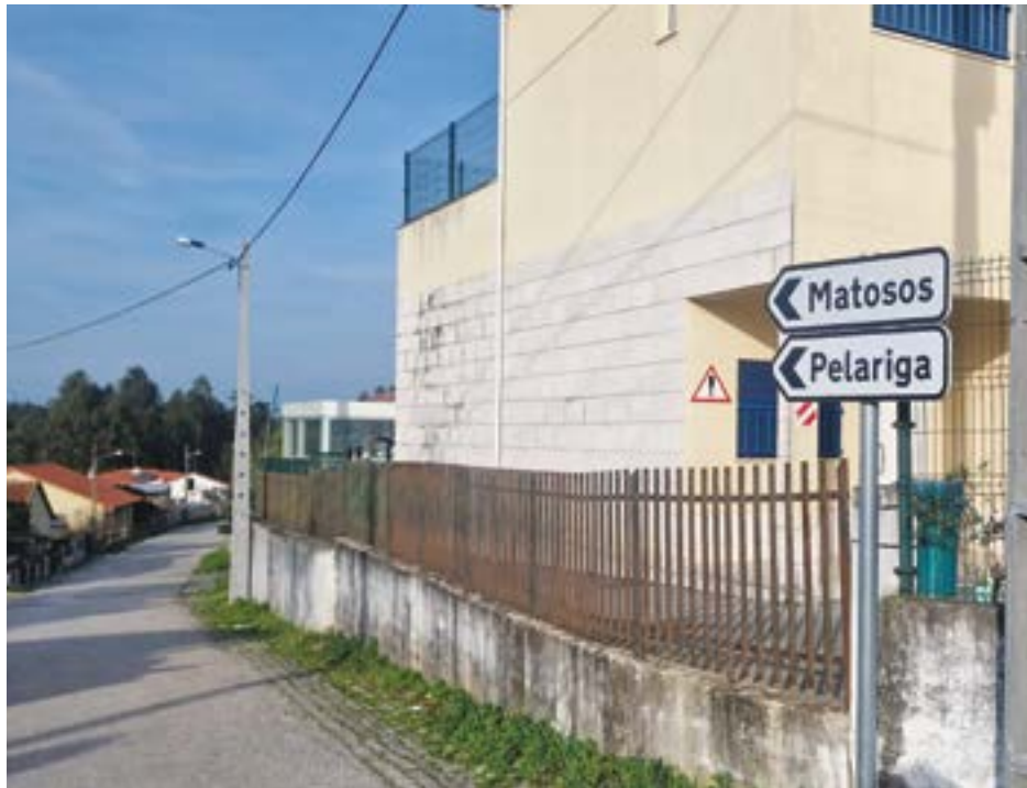
• Na Pelariga, a intervenção será realizada na Rua dos Ninhais, junto à escola

“A intervenção irá, não só, garantir melhores condições de segurança rodo-