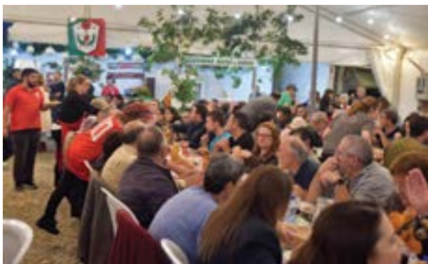
A gastronomia voltou a ser rei no evento