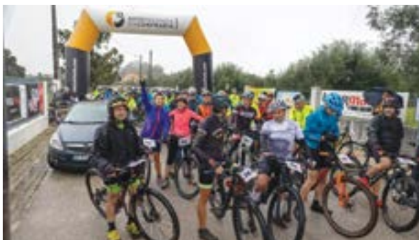
O BTT juntou mais de duas centenas de pessoas