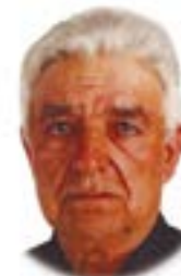
• O funeral decorreu no passado dia 2. O corpo seguiu para o cemitério da Guia

de Médico-Legal da Figueira da Foz. A vítima mortal era o condutor do microcarro ("papa reformas") e residia na localidade onde se registou a ocorrência.