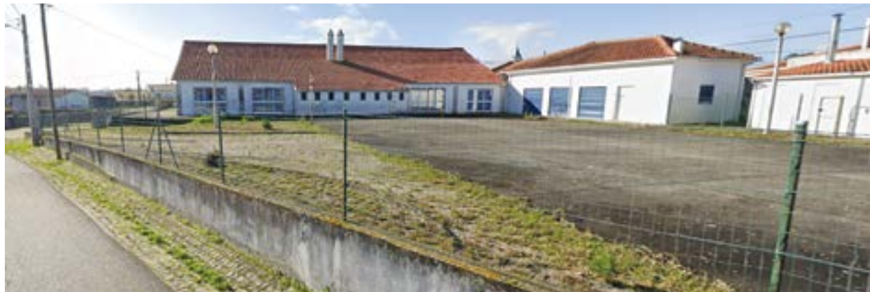
● O projecto quer aproveitar o mais possível o perímetro da antiga escola

A nova resposta social terá capacidade para acolher