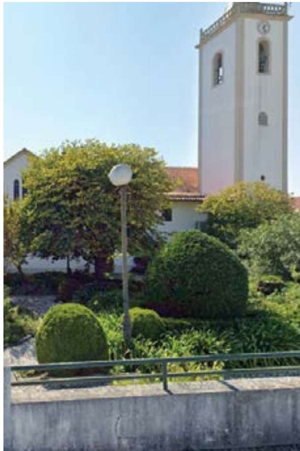
• O jardim da Igreja também vai ser alvo de melhorias

Quanto ao largo da Igreja, espaço central e principal da intervenção, o pro-