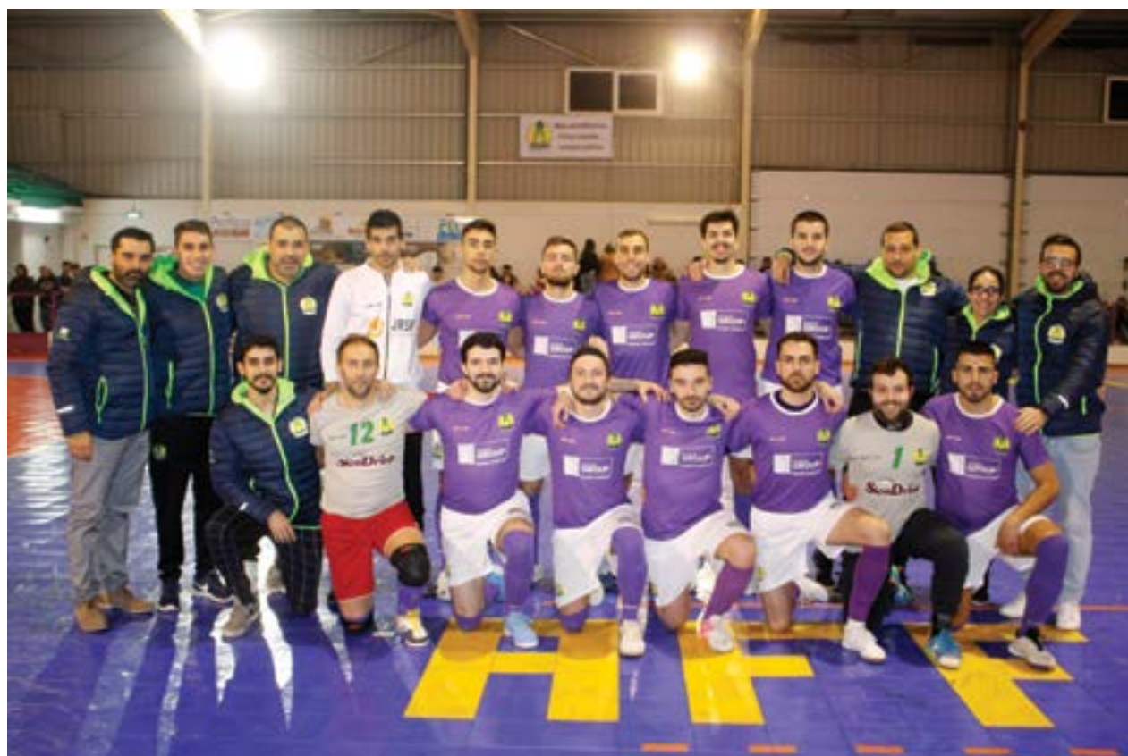
• Conjunto de Santiago de Litém que jogou frente ao Atlético Juventude de Leiria

Formação de Santiago de Litém continua a ganhar