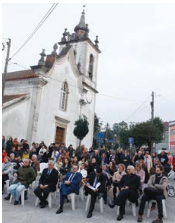
A cerimónia decorreu junto à igreja onde o pároco foi batizado, antiga igreja de Vermoil