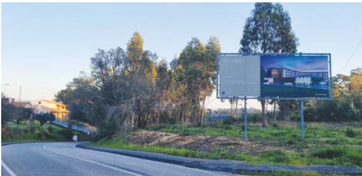
● O local da futura unidade hoteleira está sinalizado com um outdoor

O Iberian Hotel vai ser construído na Granja, ocupando uma área de construção de cerca de 10.000 metros quadrados. O promotor do investimento é um pombalense emigrado no Canadá há 50 anos e que espera, desta forma, colmatar a falta de oferta, a este nível, entre Leiria e Coimbra. A construção do empreendimento de quatro estrelas vai criar dezenas de postos de trabalho.