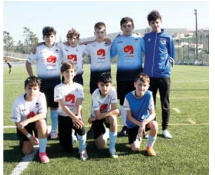
• A Academia Happyball só sabe ganhar na série 'A'