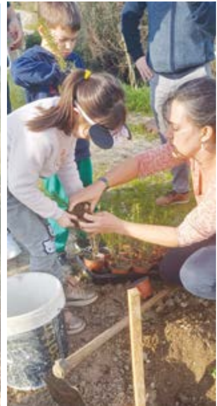
A iniciativa decorreu na estrada dos Matos da Ranha para Vermoil

A Junta de freguesia de Vermoil quis, com este projeto, promover as espécies autóctones na freguesia e, para além disso, embelezar as nossas bermas. A via de comunicação escolhida é um dos principais acessos a Vermoil e a quantidade de viaturas que por ali passam todos os dias é grande. Se conseguirmos, para além de ajudar o ambiente, também damos uma viagem mais agradável aos condutores e estamos a ganhar em todos os sentidos.