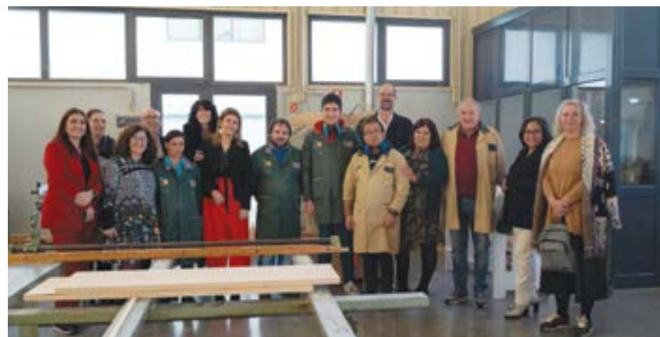
• As entidades visitaram o Centro de Formação e Inclusão Socioprofissional da Cercipom

Relativamente aos pormenores do acordo, este determina, entre outros compromissos mútuos, “a comparticipação finan-