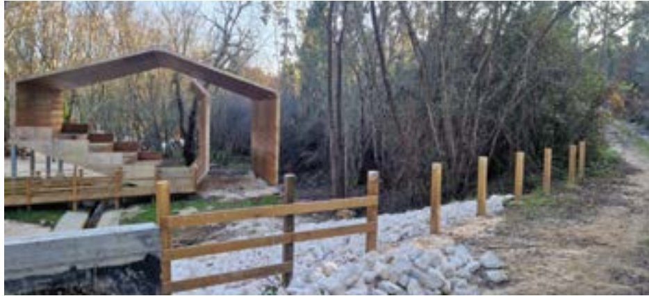
• A madeira furtada fica junto a um caminho que atravessa a floresta, afastado da via principal

Em declarações ao Pombal Jornal, a presidente da Junta de Freguesia de Pombal adiantou que o furto foi cometido numa parte da