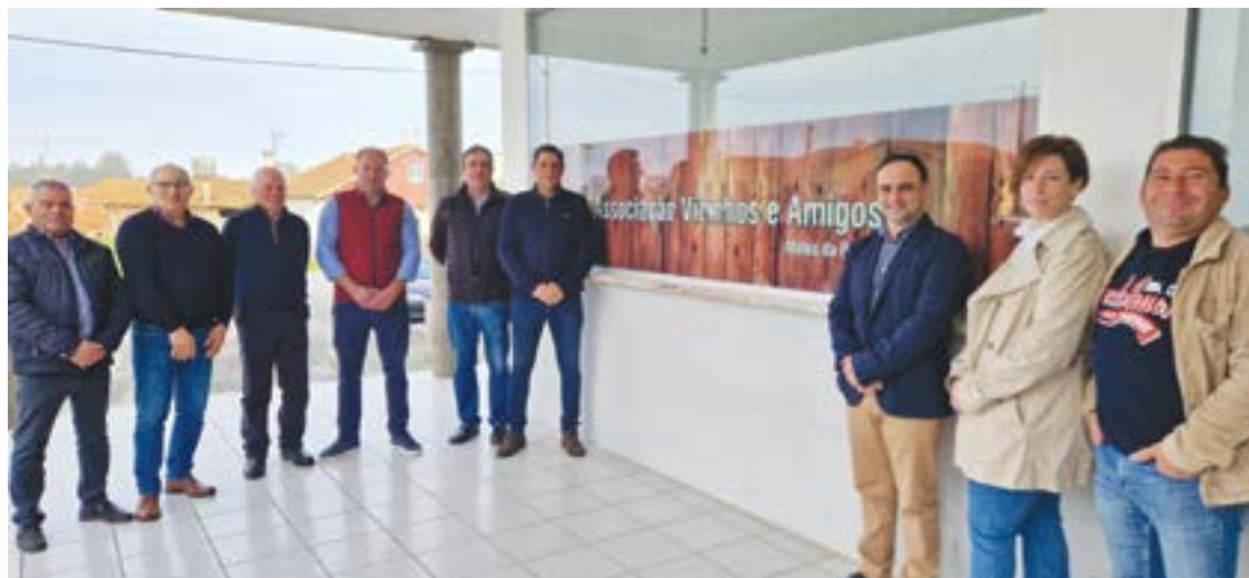
Os novos elementos da associação dos Matos da Ranha

Outro dos objectivos é tentar reativar o rancho dos Matos da Ranha, inserindo