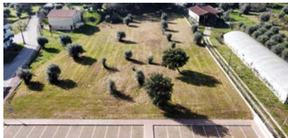
• A arena desportiva vai ser construída num terreno junto ao parque do Açude

O projecto de arquitectura do futuro recinto