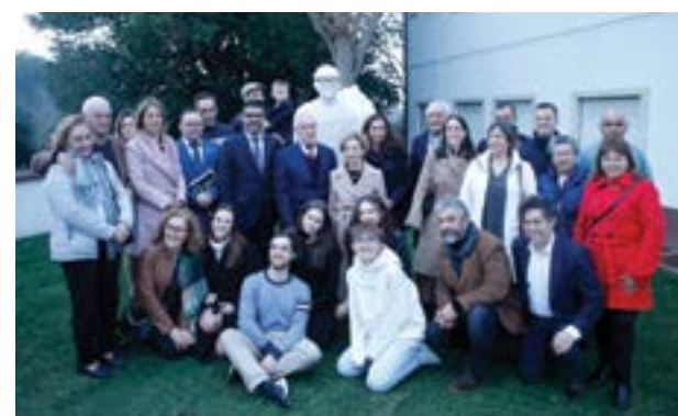
Familiares e convidados junto ao Busto