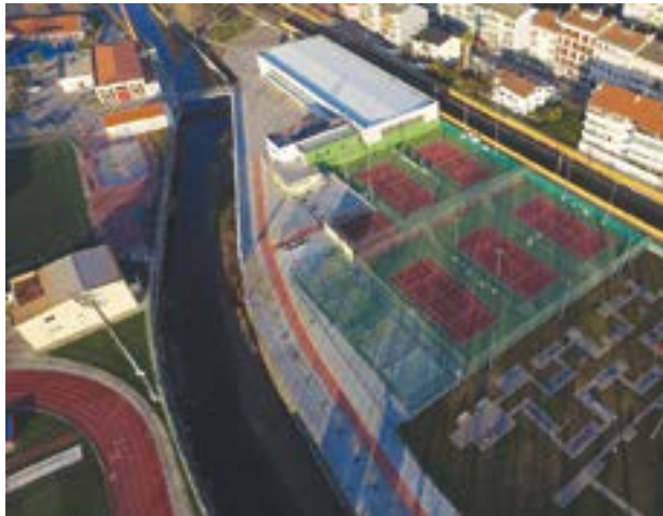
• A colectividade está inserida na zona desportiva

Desta forma, e pela 35.ª vez, O Clube de Ténis de Pombal vai assinalar o seu aniversário com um torneio, estando este ano, agendado para o fim-de-semana de 17 e 18 deste mês. Mais uma vez, serão aguardados muitos participantes de vários pontos do país, dando assim um enorme colorido à festa. As inscrições estão abert