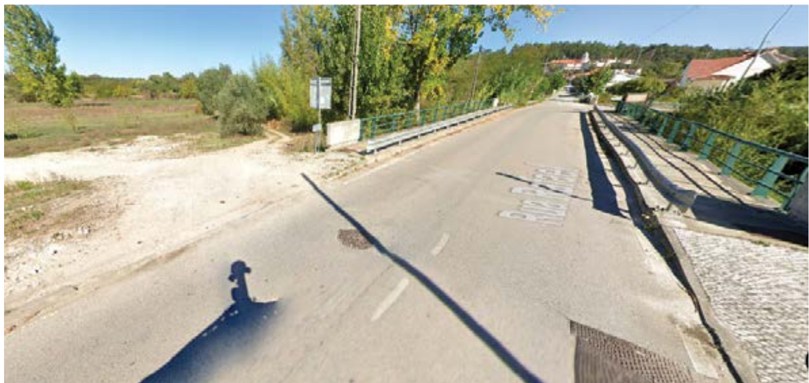
Nesta fase, o prolongamento terminará nesta zona, onde serão feitas intervenções para um parque. O presidente da Câmara esteve na apresentação.

O projecto do Corredor Ribeirinho do Rio Arunca começou por ser executado, numa primeira fase, numa extensão de dois quilómetros, desde o centro da cidade de Pombal até à zona do açude. Entretanto, numa fase posterior, fez-se o seu prolongamento até à zona da Ranha de Baixo, numa extensão de cerca de quatro quilómetros. Com esta nova fase, que agora se apresentou, pretende-se prolongar o corredor por mais quatro quilómetros, desde a Ranha de Baixo até ao centro de Vermoil, num investimento municipal que ascende a 600 mil euros. Contudo, a obra não deverá parar por aqui. Segundo