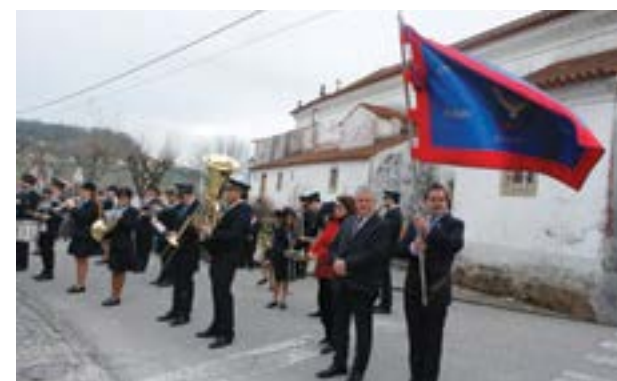
A Filarmónica de Vermoil esteve presente