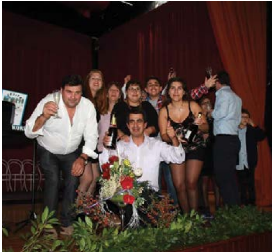
• Grupo d'Os Amigos da Filarmónica

O programa do réveillon inclui um jantar buffet, animação musical e fogo-de-artifício. A recepção começa às 20h30, altura em que