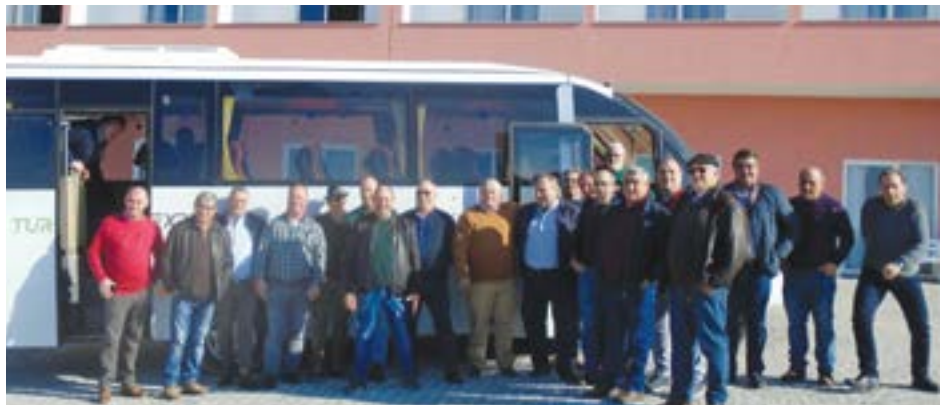
• O grupo visitou, este ano, as Termas do Bicanho

dos os que se queiram juntar ao grupo, salientando que este está aberto a todos os homens nascidos naquele ano.