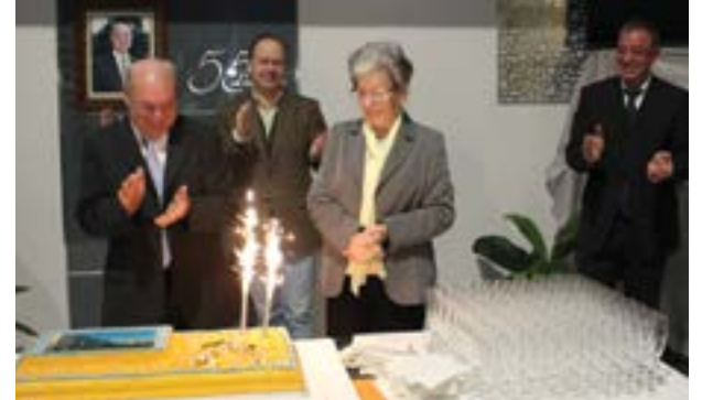
• Os parabéns foram cantados pelos sócios-gerentes