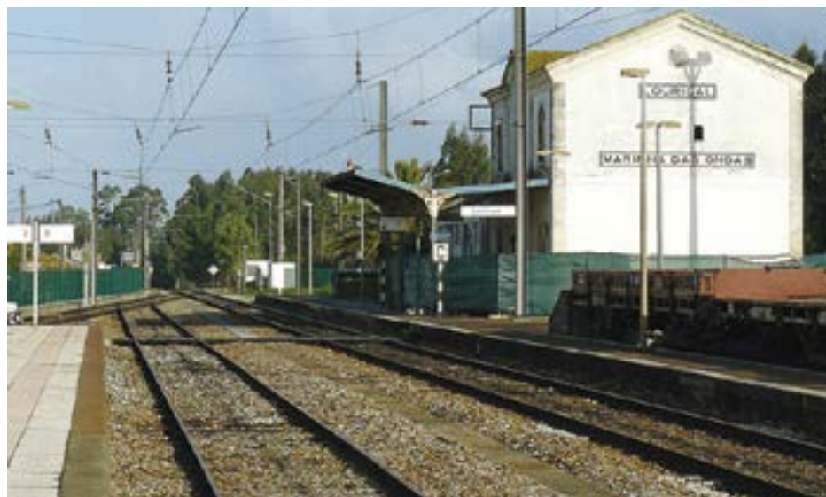
• O concelho de Pombal também é abrangido por esta linha

A ministra da Coesão Territorial defendeu a electrificação da Linha do Oeste, que liga a Figueira da Foz a Lisboa, indo ao encontro de uma reivindicação do presidente da Câmara figueirense e de outros autarcas da região.