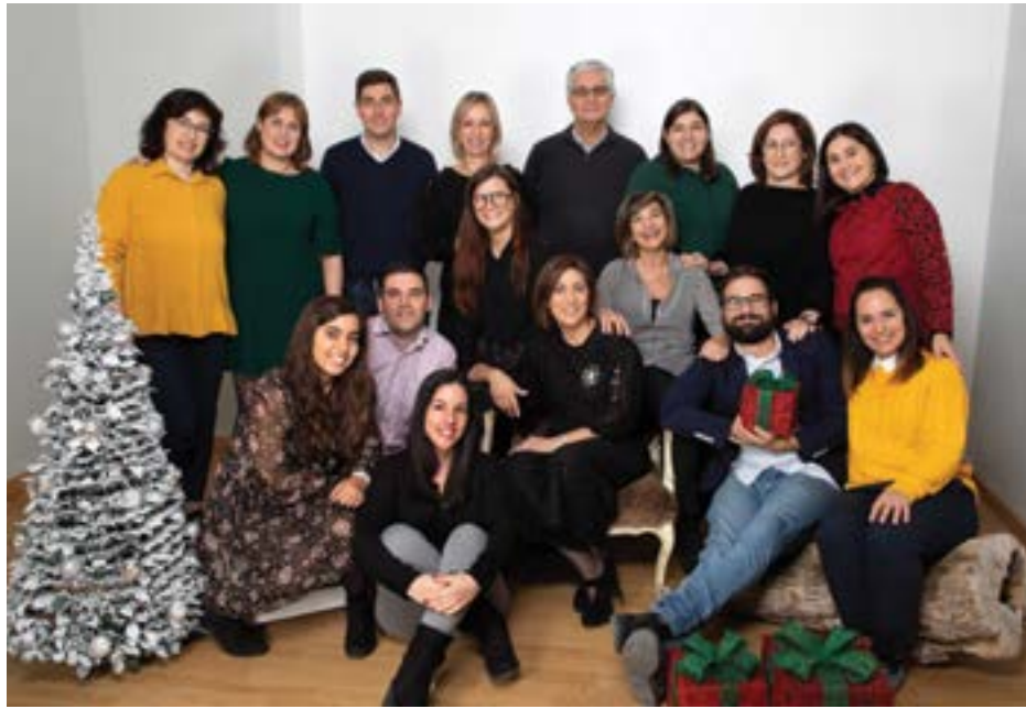
• Equipa de colaboradores da DTravel