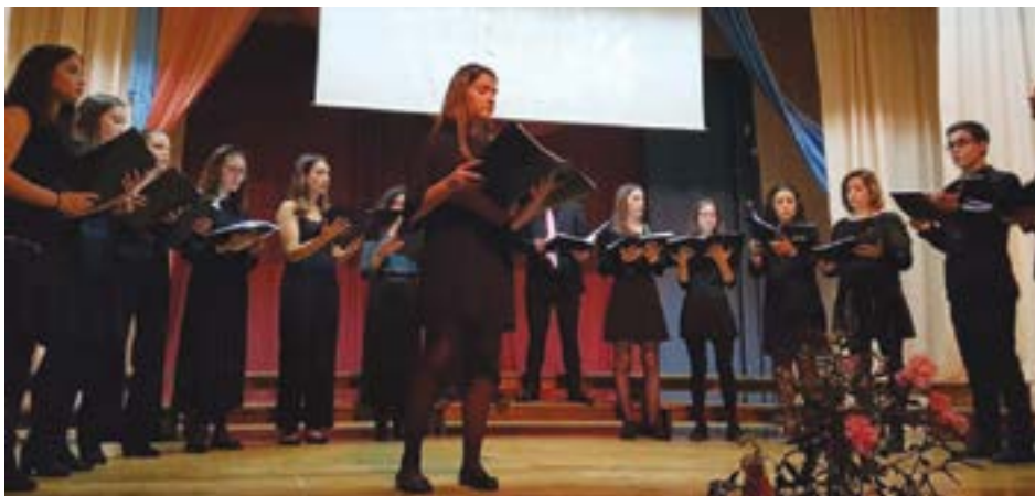
• O Coro Juvenil do Oeste fez a sua estreia no aniversário do Coral Polifónico do Oeste

A 6 de Janeiro deste ano, por ocasião do primeiro concerto de 2019, o presidente da direcção do Coral Polifónico do Oeste apontava como um dos desígnios para o novo ano o rejuvenescimento do grupo. Ao final da tarde do passado dia 1 de Dezembro, quase um ano volvido desde o anúncio feito ao Pombal Jornal, se dúvidas houvessem de que a missão seria cumprida com sucesso, elas desfizeram-se com a actuação do Coro Juvenil do Oeste, por ocasião do 13º aniversário do Coral Polifónico do Oeste. No palco do salão paroquial da Guia, os cerca de 20 jovens elementos do novo projecto, apresentado oficialmente naquele dia, mostraram que estão lançadas as bases para trazer uma ‘lufada de ar fresco’ ao coral aniversariante,