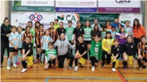
O primeiro encontro foi no passado dia 7