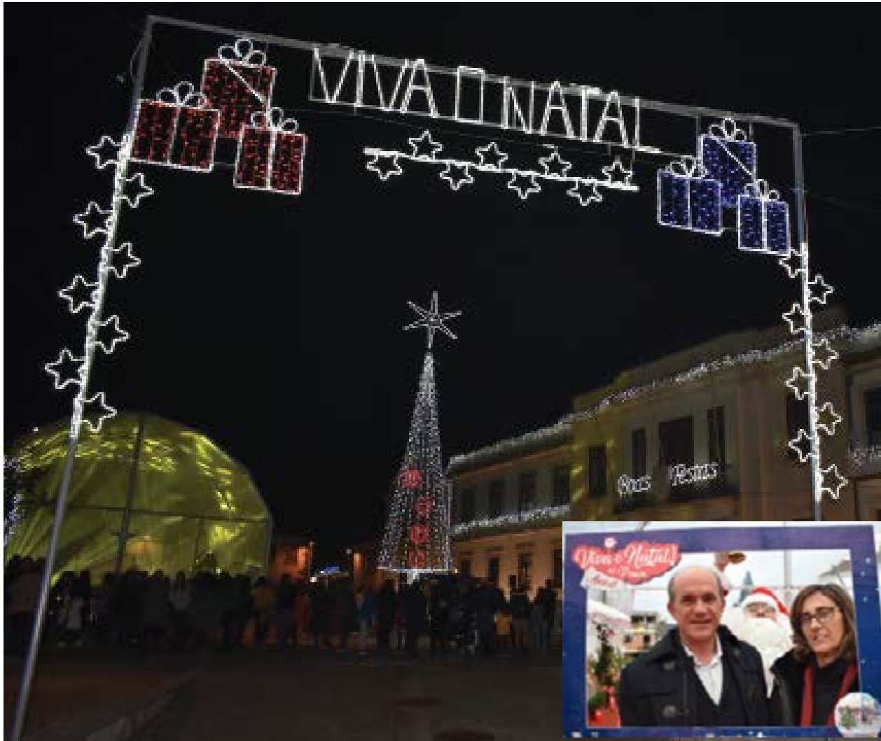
• A abertura das festividades natalícias trouxe centenas de pequenos e graúdos à vila. O presidente da Câmara tem sido presença assídua

O programa “Viva o Natal! na Praça” arrancou a 6 de Dezembro, em Ansião, com a inauguração da iluminação e da árvore de Natal, bem como a chegada do Pai Natal no comboio mágico, prolongando-se até ao último dia do ano.