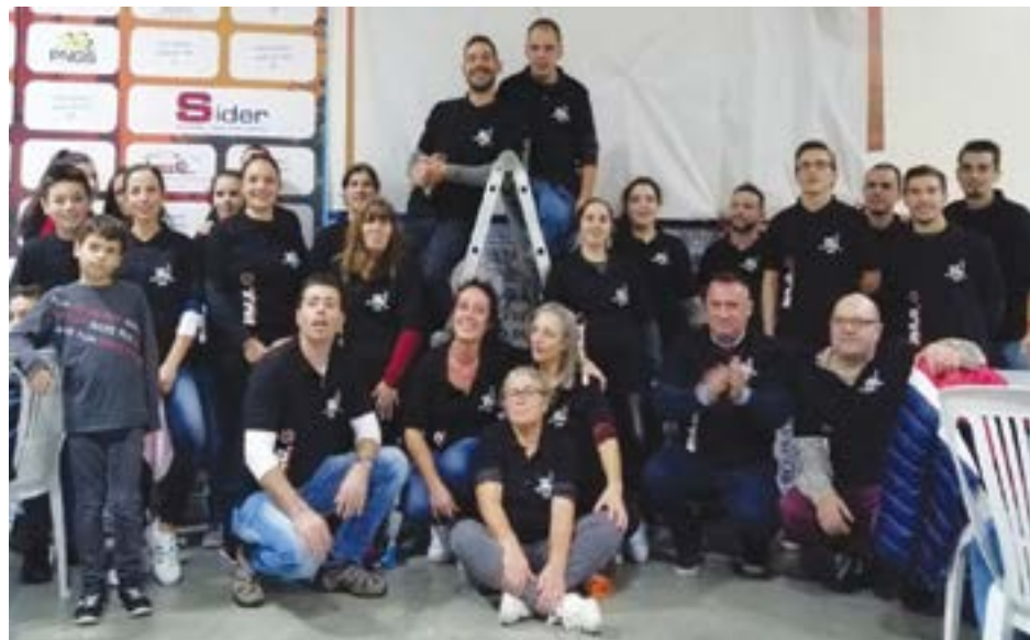
● Elementos da Comissão de Festas de Carnide 2020

às 20h00 e os participantes terão à disposição um jantar buffet com grande variedade de pratos quentes e frios, mesa de entradas e de sobremesas.