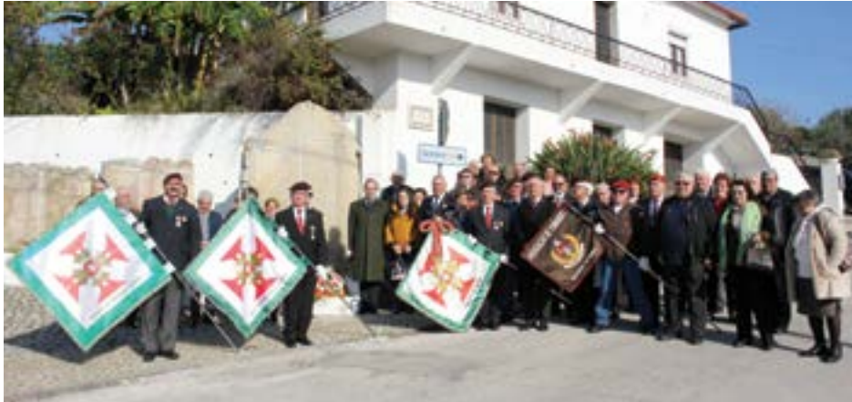
• Foto de 'família' após mais um encontro em Abiul

O aniversário do Núcleo de Abiul/Pombal da Liga dos Combatentes, que se assinalou no dia 7 de Dezembro, em Abiul, foi apadrinhado por inúmeros combatentes, suas famílias, representantes de outros núcleos e da Associação de Comandos de Pombal e autarcas. A celebração ficou marcada pela tradicional homenagem aos combatentes da antiga vila que participaram na Guerra do Ultramar, com a deposição de uma coroa de flores junto ao monumento onde