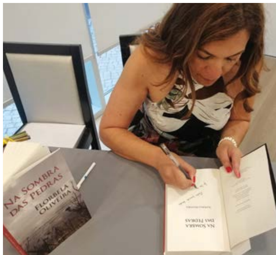
● A autora do livro durante uma sessão de autógrafos

‘Na Sombra das Pedras’ é um romance policial onde o suspense impera a cada página, e que é, afinal, “o resultado de uma mudança brusca de vida que me obrigou a manter a cabeça e o coração ocupados e que me levou a inventar umas ‘pessoas’, uns acontecimentos, umas histórias de várias ligações que cumprissem os objectivos de entreter, de educar e de ajudar a crescer no meio literário”, admite, enquanto explica que “o meu ‘Na Sombra das Pedras’ é, afinal, o resultado do que fui, do que vivi, do que aprendi, mas é, sobretudo, o produto que em mim ficou, e