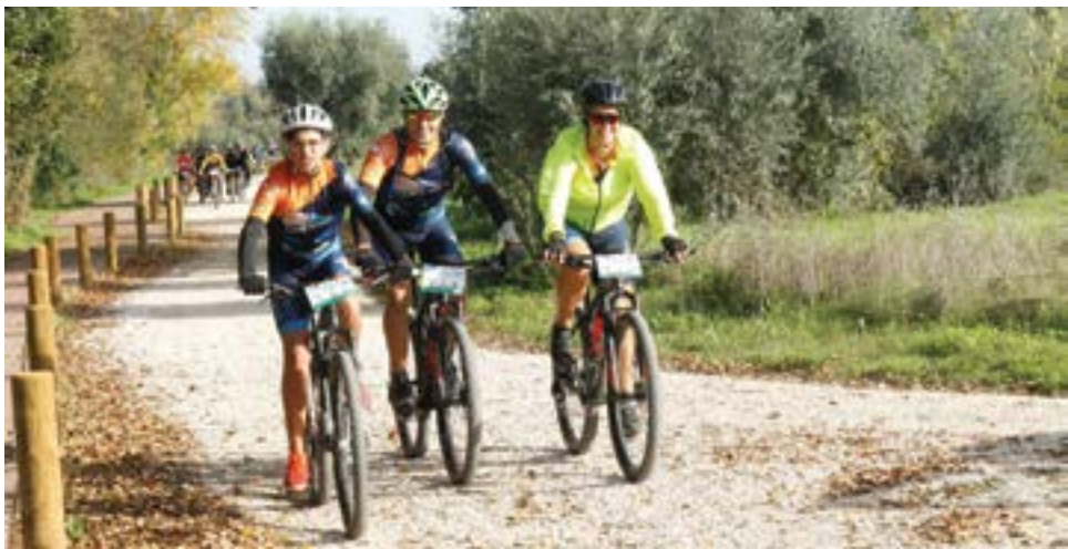
• A segunda edição vai voltar a percorrer os caminhos até à Freguesia de Vermoil

evento, com o intuito de haver uma representatividade alargada do território. A participação na Rota de São Martinho é gratuita, mas solicita-se a quem esteja interessado para que faça a sua inscrição, facilitando assim o processo de organização. Para o efeito está disponível o contacto 911 975 237. Para quem tem dúvidas sobre o evento, poderá também passar pela página de Facebook do Pombal Jornal e consultar o álbum de fotos publicadas em 2022 sobre a Rota de Martinho.