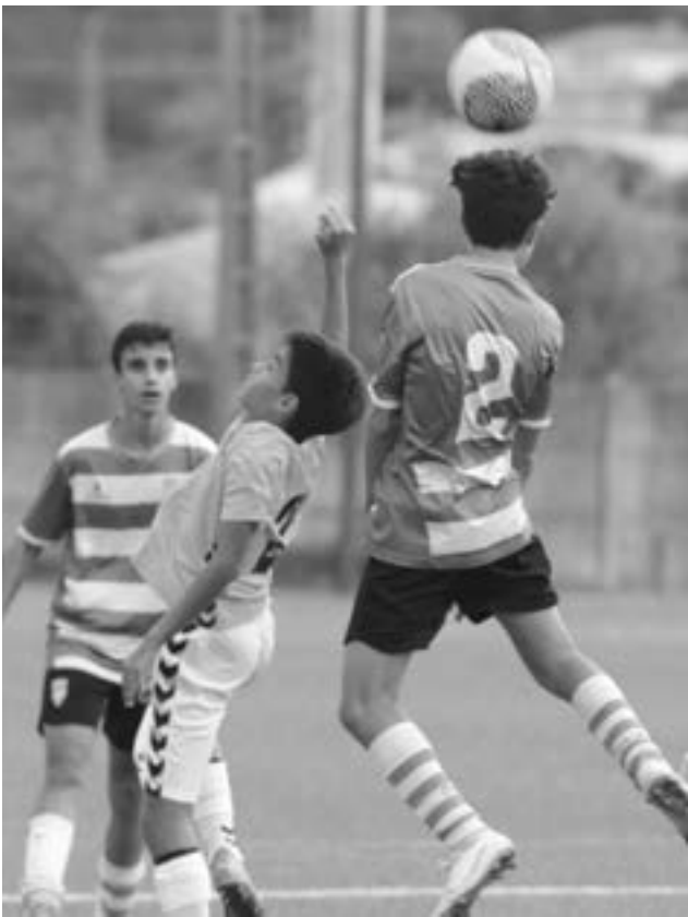
• Com algumas novidades no onze, nova vitória frente ao Covilhã

em casa, frente ao Anadia, terceiro classificado, será uma final, no objectivo para segurar a liderança do campeonato. A formação da Bairrada tentará redimir-se da derrota da primeira volta.