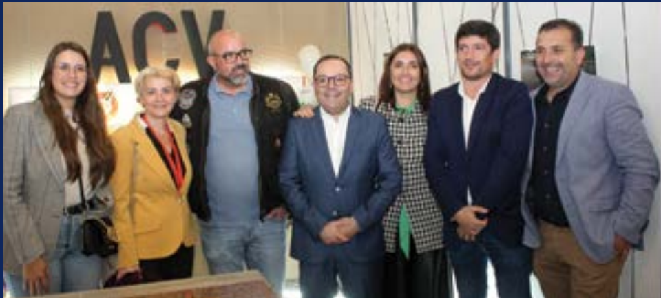
• Associação Clássicos de Vermoil também esteve representada. Coube-lhe a organização do passeio de BTT