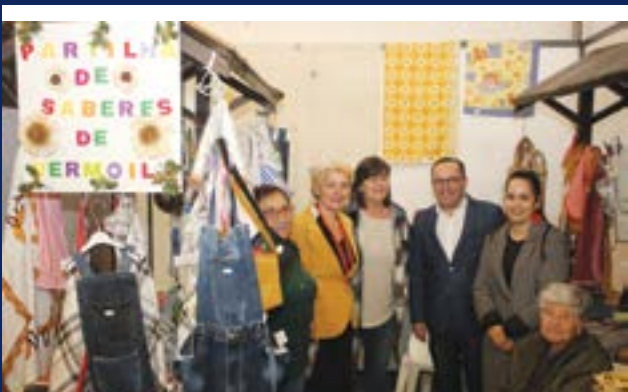
• Projecto “Partilha de Saberes” deu a conhecer trabalhos dos idosos