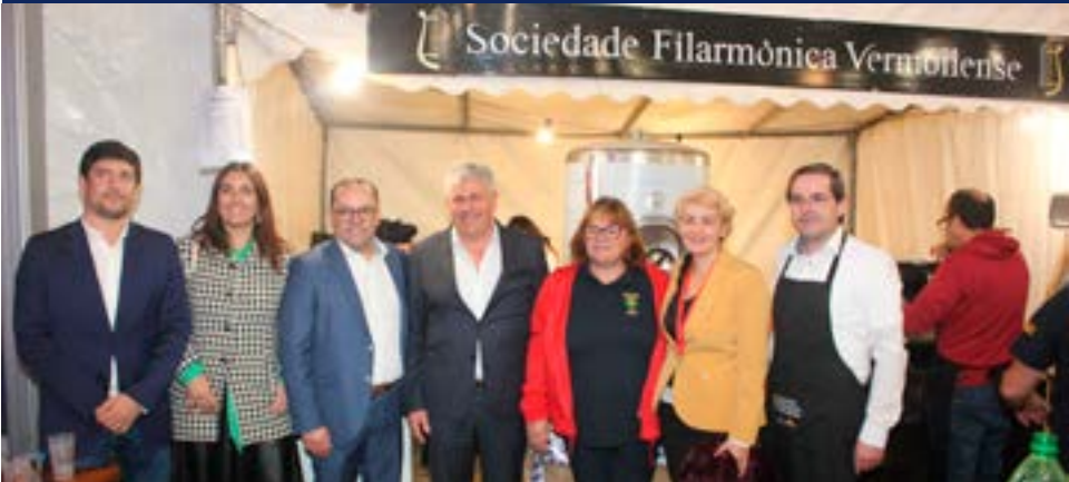
• Visita à tasquinha da Filarmónica Vermoilense, que este ano assinala 130 anos, e que alvo de homenagem