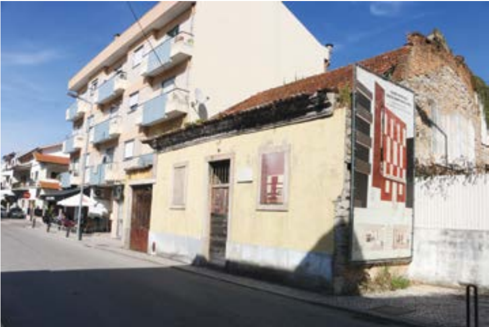
● A casa onde nasceu e viveu o antigo primeiro-ministro Mota Pinto vai ser transformada num Centro de Estudos

Os proprietários de 92 prédios situados nas áreas de reabilitação urbana (ARU) da zona central da cidade de Pombal, do Seixo e Emporão e da Guia vão ser penalizados com o agravamento do Imposto Municipal sobre Imóveis (IMI) por se encontrarem em estado degradado e/ou devoluto.