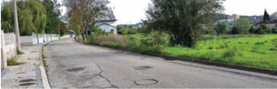
● A Rua Dr. António Jorge Ferreira faz a ligação entre a Escola Marquês de Pombal e o Intermarché

Afinal, além da rua ter passeios estreitos, ainda tem os postes de iluminação pública a meio, obrigando os transeuntes a ir para a estrada e as pessoas com mobilidade reduzida a circular na via ro-