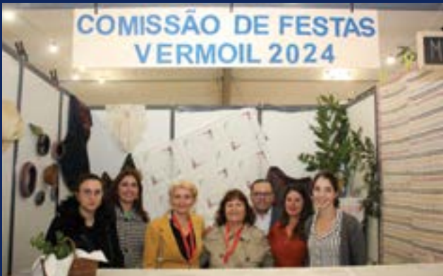
• A Comissão de Festas procurou angariar fundos durante o evento