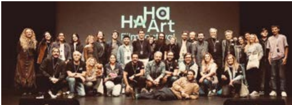
• No final do evento, a organização e convidados posaram no palco do Teatro-Cine