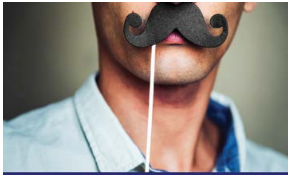
• O bigode serve para sensibilizar, mas há outras acções previstas ao longo do mês

Para reforçar a acção, o GVC desafiou as barbearias pombalenses a associarem-se ao movimento, sensibilizando os clientes para a temática em questão e sugerindo que deixem crescer o bigode ao longo do mês. Nas barbearias estarão ainda disponíveis flyers informa-