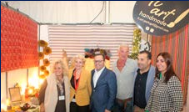
• Cerca de 30 expositores estiveram na tenda coberta