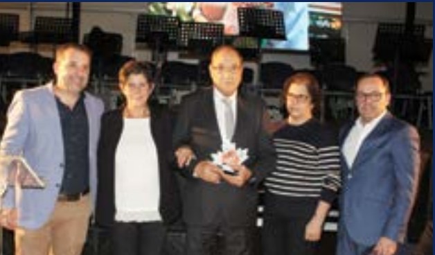
• A S.M.A.P./IMAPAL foi homenageada na cerimónia de sexta-feira