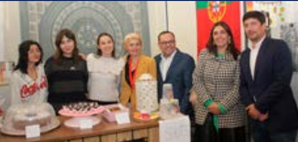
• Finalistas da turma de Artes procuraram angariar verbas no evento