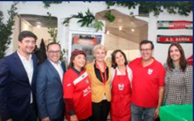
• A Associação Desp. da Ranha dinamizou uma das tasquinhas