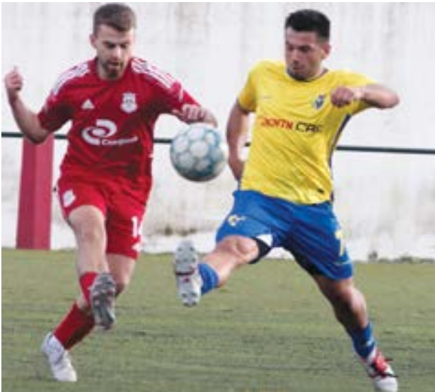
● Os golos nos Arneiros surgiram na segunda parte

A presente edição da primeira divisão distrital está novamente a pautar-se pelo equilíbrio, como sucedeu no encontro entre o Figueiró dos Vinhos que se volta a assumir como principal favorito ao primeiro lugar e o Arcuda de Albergaria dos Doze. O conjunto mais a norte do distrito de Leiria que ainda não tinha perdido qualquer ponto, só evitou a sua derrota nos instantes finais e pelo seu guarda-redes. O Arcuda que voltou a mostrar argumentos para uma época bem mais positiva. Cenário semelhante mas sem golos, entre o Alegre Unido da Bajouca e o Pelariga, que apesar da diferença de lugares na tabela