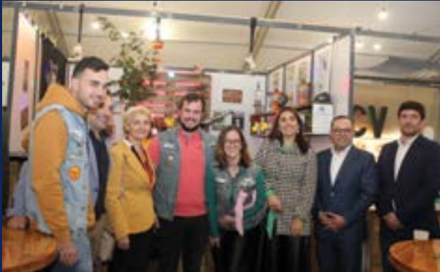
• Visita ao espaço do grupo Prego a Fundo