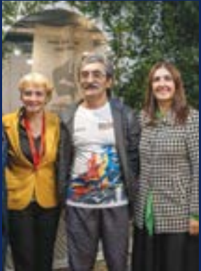
• Visita às tasquinhas da Assoc. de Matos da Ranha e Atlético Vermoil