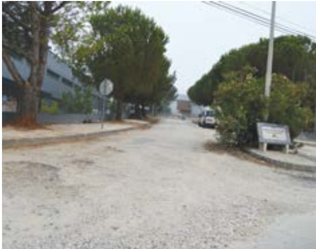
• O parque é propriedade da Fundação Dr.º José Lourenço Júnior

Recorde-se que o Parque Industrial de Abiul é propriedade da Fundação Dr. José Lourenço Júnior. Contudo, perante a sua incapacidade financeira para suportar os custos com as obras, a Fundação propôs, há alguns meses, doar vá-