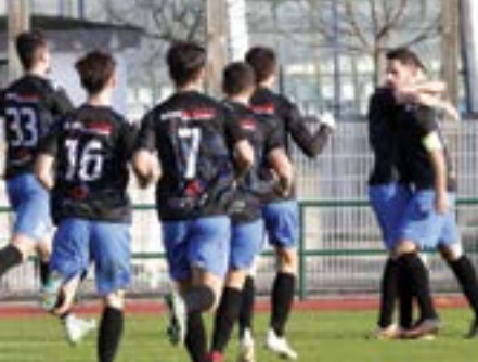
• O Guiense foi o primeiro a festejar

15.ª JORNADA - 21 Janeiro Caldas S.C 'B' - 'Os Nazarenos' (jogo antecipado para sábado, dia 20, 21h) Sp. Pombal - Vieiraense Alvaiázere - Lisboa e Marinha Marrazes - União da Serra Ilha - Beneditense Portomosense - Valeo Alqueidão da Serra - Alcobaça Bombarralense - Guiense