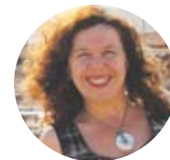
Por: Lidia Ribeiro