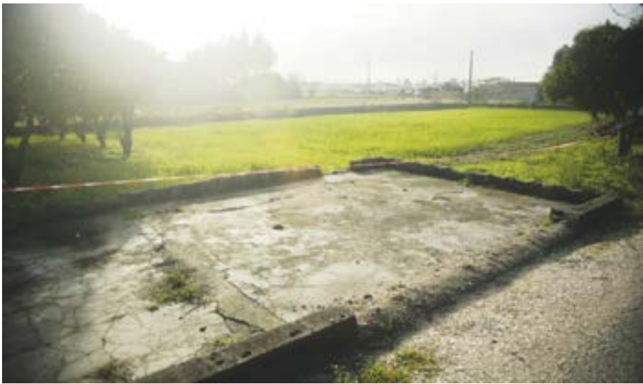
• A discussão aconteceu nesta eira próximo da estrada principal da aldeia

Na origem da discussão terá estado, segundo