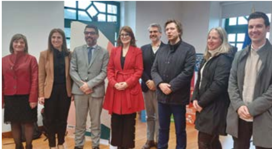
• Ministra da Justiça (ao centro) acompanhada do presidente da Câmara e técnicos do município

A plataforma dirigida aos proprietários de prédios rústicos e mistos, que permite mapear, entender e valorizar o território português, de forma simples e gratuita, somou até ao final de 2023, dois milhões de propriedades identificadas. O BUPI começou como projecto-piloto em 2017 e, actualmente, já chegou a 145 concelhos. No caso de Pombal, a ministra considerou os 45 mil prédios identificados até ao momento como "um número muito relevante". A evolução po-