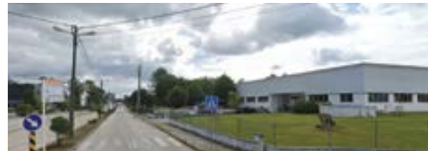
• O orçamento para o próximo ano prevê um investimento de 5,9 milhões de euros em parques industriais, tal como foi avançado na edição anterior

Tal como já era expectável, a Assembleia Municipal aprovou, por maioria, os documentos previsionais para 2024, com um orçamento de 50,9 milhões de euros, que define como prioridades o desenvolvimento económico, os espaços verdes e as smart cities. A estratégia para o próximo ano não convenceu a oposição, que não confia na capacidade de concretização deste executivo e da maioria PSD.