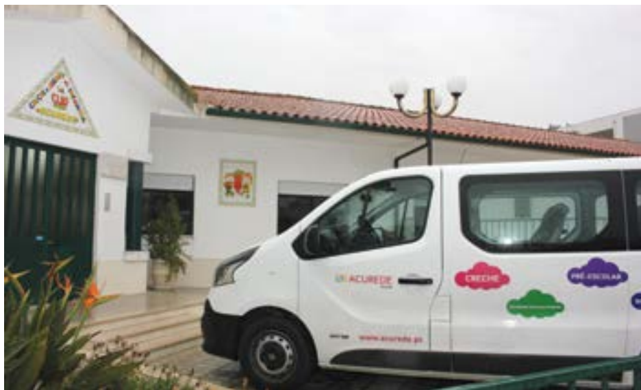
• A carrinha de transporte de crianças foi adquirida em 2016 com o apoio da Câmara e de mecenas anónimos