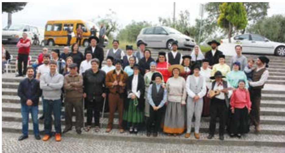
• Alguns dos elementos do Rancho e entidades convidadas que marcaram presença no aniversário