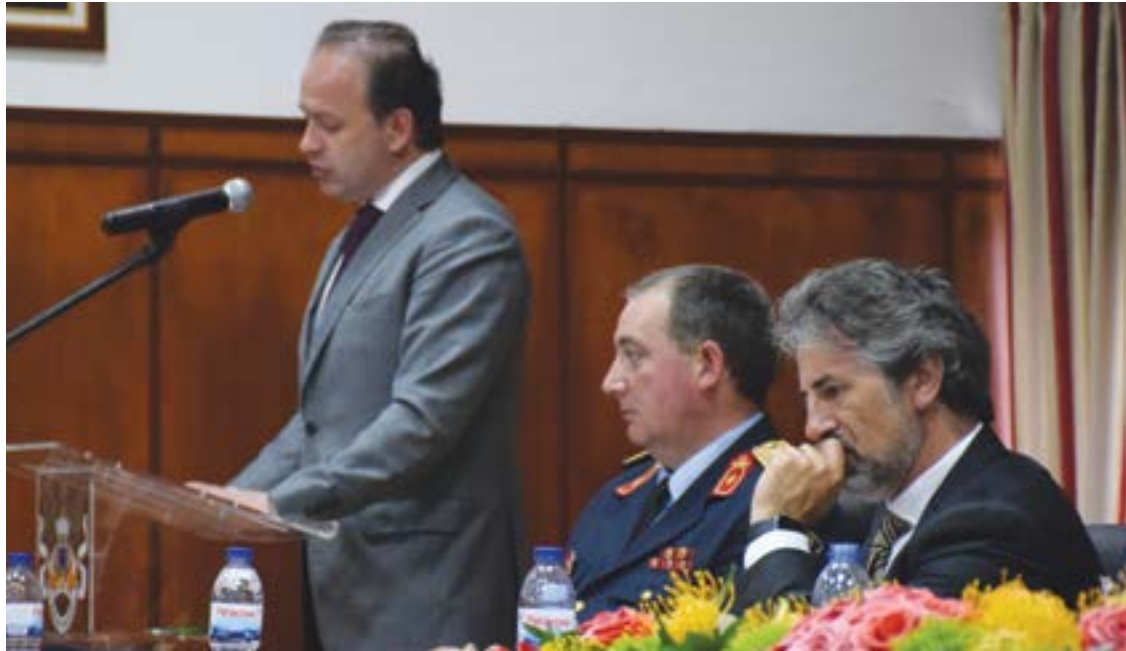
• Para o presidente da Câmara, os Bombeiros são “o mais importante parceiro” do município

O dirigente criticou, ainda, a falta de apoio governamental para a criação de mais equipas de inter-