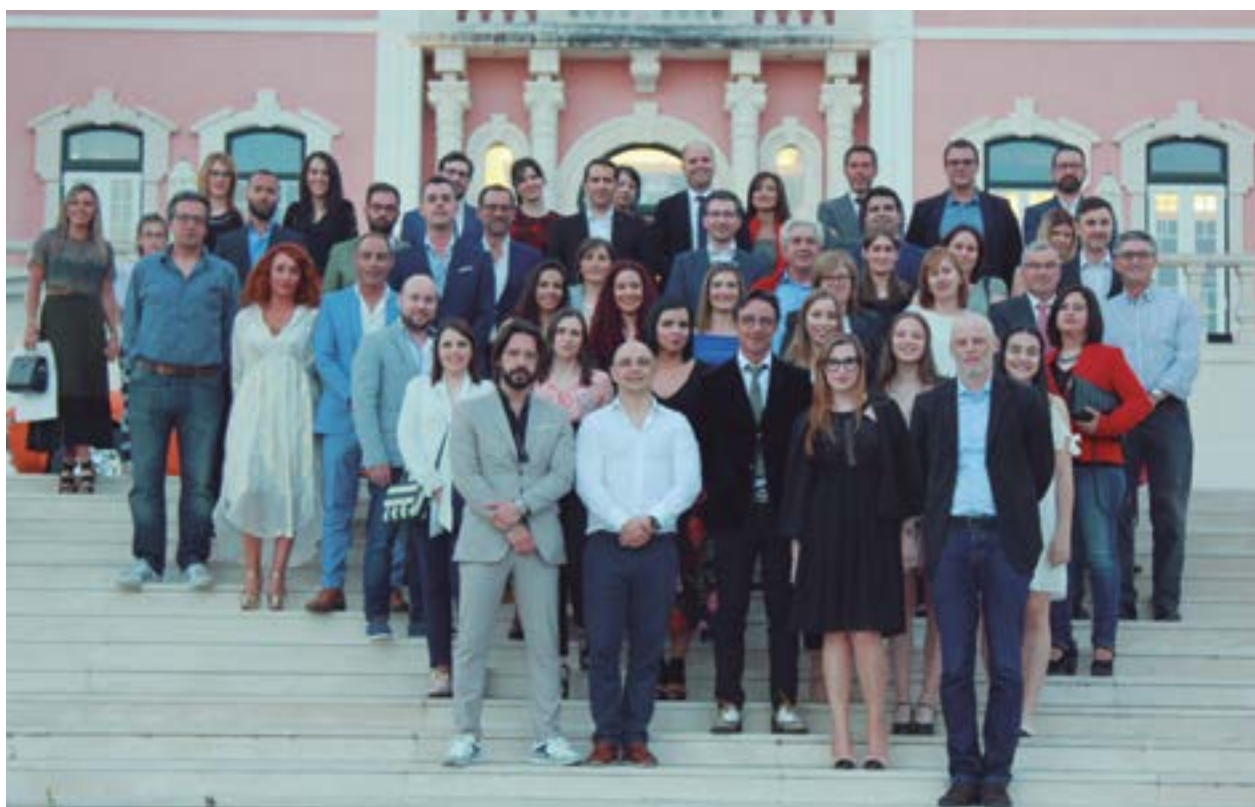
• Grupo de convidados que marcou presença na festa que decorreu no Hotel de Monte Real