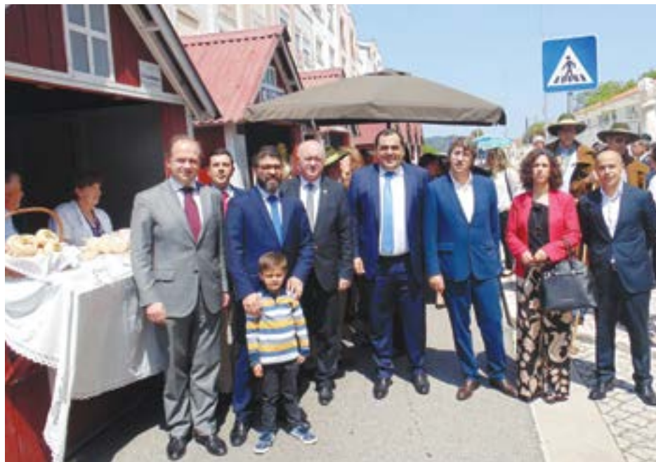
• Entidades oficiais na visita aos expositores, após a sessão solene de abertura