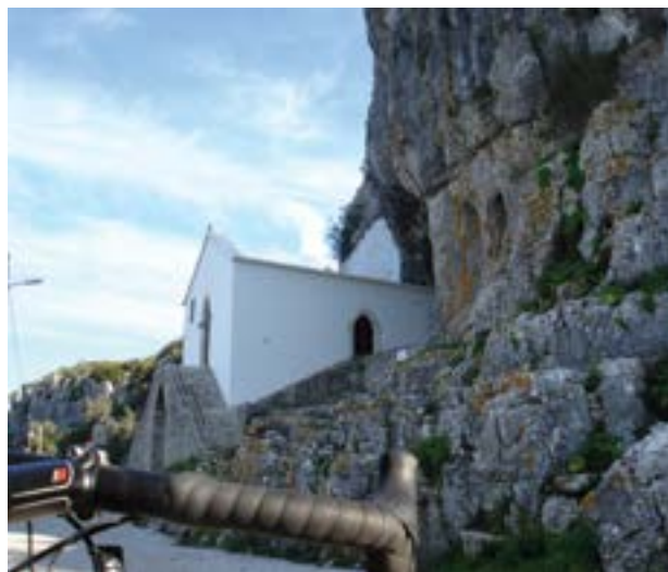
• A subida da Senhora da Estrela é um dos “castigos” do evento