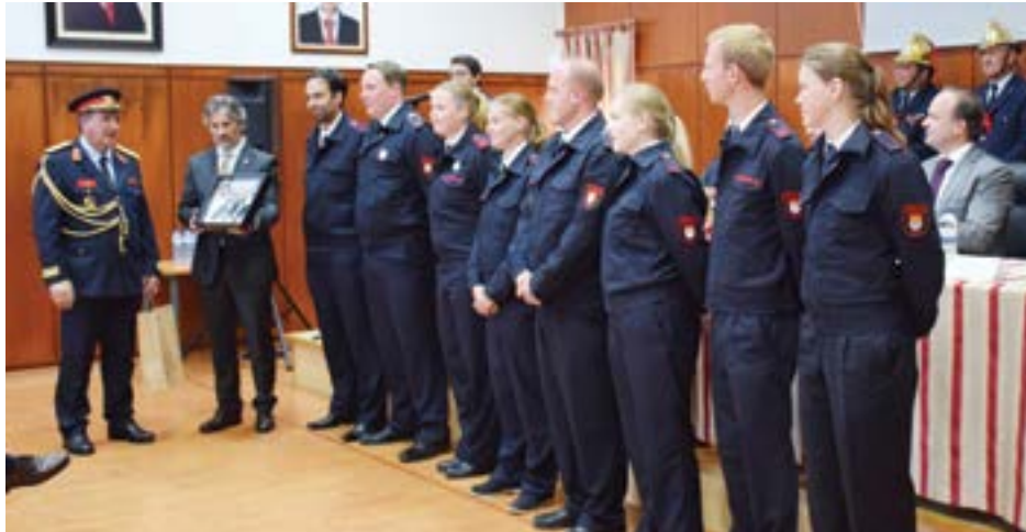
• Os Bombeiros Voluntários de Lövenich, Colónia, entregaram uma lembrança à Associação Humanitária dos Bombeiros Voluntários de Pombal

O jovem, natural da Redinha, Pombal, não se lembra do momento exacto em que quis ser bombeiro voluntário, no entanto confessa que desde sempre sentiu esta necessidade de se dedicar às causas humanitárias. Quando se viu obrigado a sair de Portugal em busca de melhores condições de vida, percebeu que não teria de abdicar da sua necessidade de partilha e ajuda ao próximo. Em Colónia, na Alemanha,