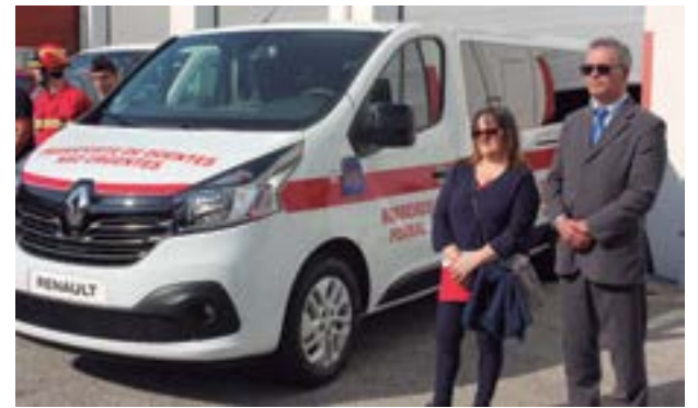
Ambulância com o nome de Filinata

luntário, para sempre bombeiro voluntário... seja onde for”, garante. No futuro “o objectivo é trabalhar com a Autoridade Nacional de Protecção Civil, ou para o Comando, o equivalente na Alemanha”, mas precisa primeiro “de dominar o alemão, escrito e falado”.