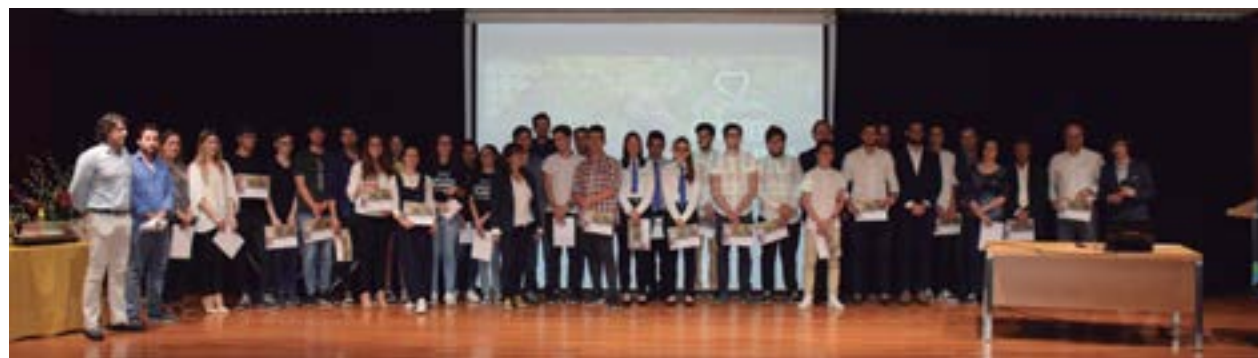
• Na final participaram 24 alunos, provenientes de três estabelecimentos de ensino do concelho