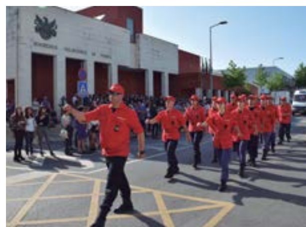
• Os bombeiros desfilaram pelas ruas da cidade