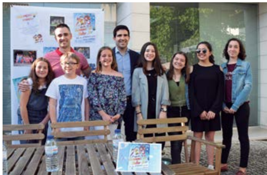
• A apresentação do evento contou com a presença dos vencedores das sete edições anteriores

Este ano são esperadas várias novidades no evento. O espectáculo final está marcado para 15 de Junho, no Largo da Biblioteca Municipal, onde os 12 finalistas vão apresentar ao vivo, e acompanhados de uma banda, 12 músicas bem conhecidas do panorama musical português. Ao contrário das edições anteriores que permitiam a repetição de concorrentes, este ano, a organização optou por dei-