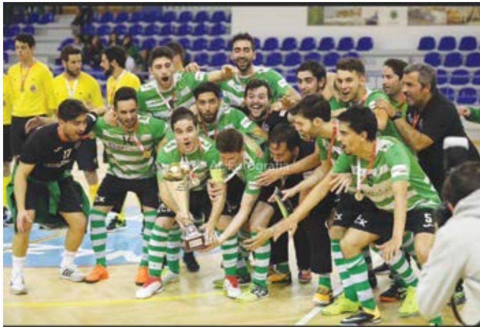
• Equipa festeja a conquista da taça distrito Leiria. Sábado, é a vez de tentarem a super-taça.