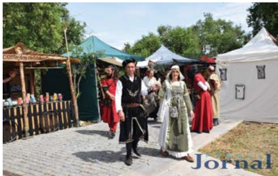
• A autarquia disponibiliza transporte entre o Largo do Cardal e o Castelo

“O município continua apostado no crescimento do mercado, quer em termos de qualidade quer em termos de quantidade de expositores”, adianta a mesma fonte, referindo que o objectivo é continuar a “manter e reforçar” o mercado como um “evento de referência em termos de qualidade no roteiro dos mercados medievais nacionais e proporcionar a quem visita o evento, momentos de vivências medievais em ter-