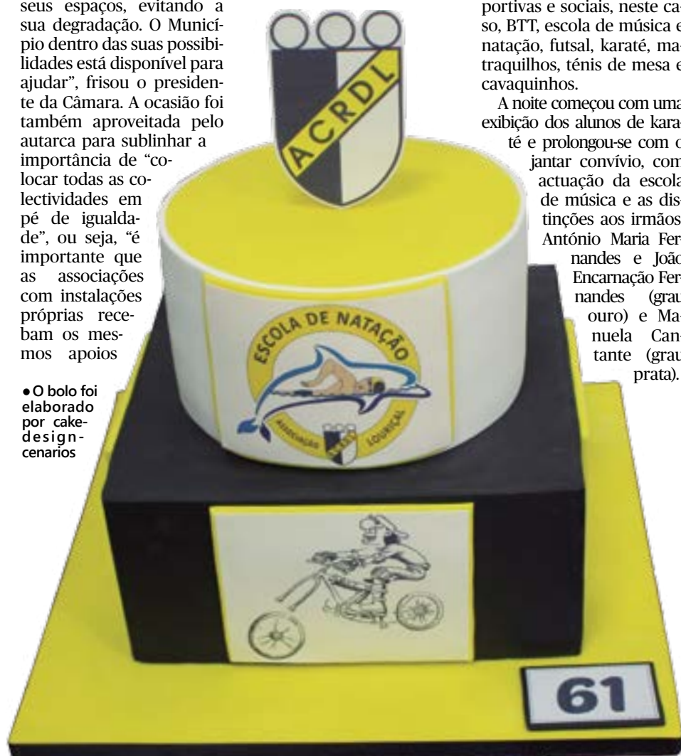
• O bolo foi elaborado por cake-design-cenários