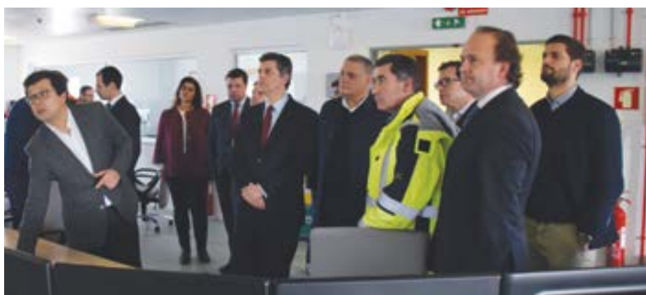
• O governante assinalou o encerramento da acção de formação