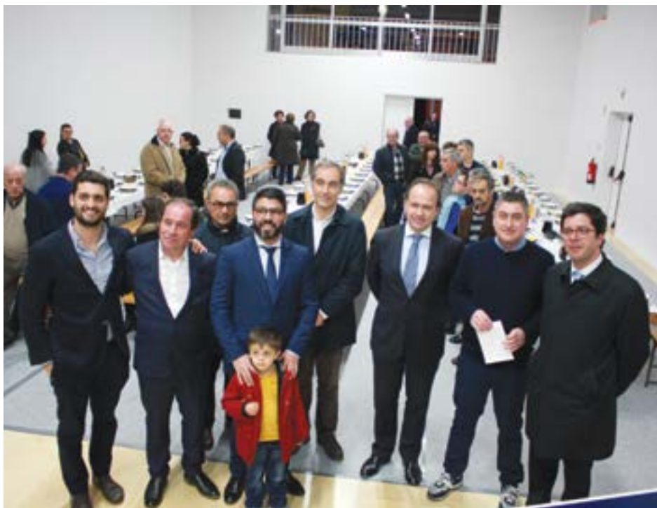
• As entidades no espaço reabilitado da Associação do Louriçal