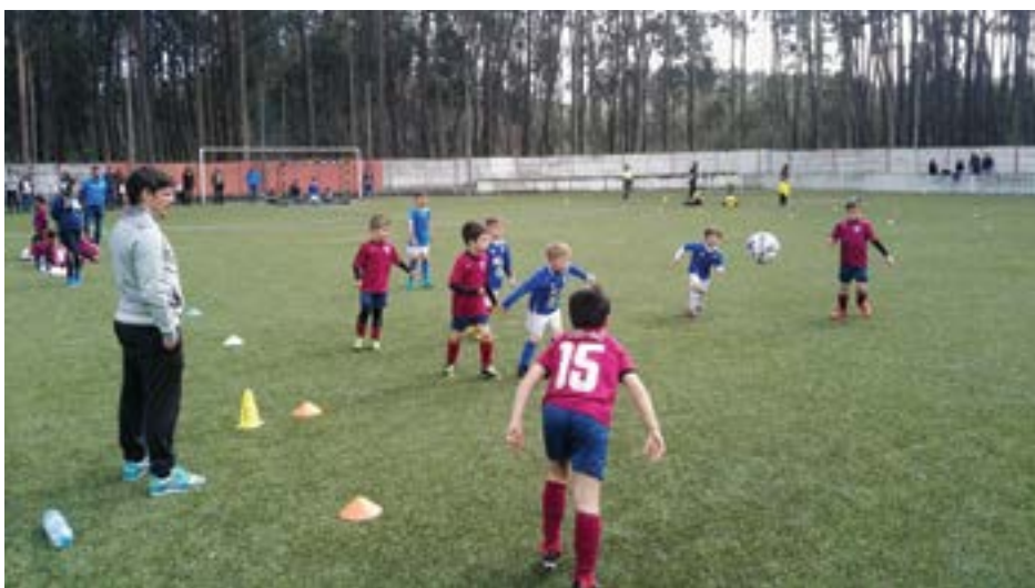
• Evento reuniu durante dois dias, jogadores dos 4 aos 13 anos. Na imagem o escalão de Sub'7

O Grupo Desportivo da Ilha manteve a tradição de dias antes das festividades da Páscoa, de reunir no seu campo de jogos, mais de 400 jovens atletas em convívio desportivo. Em causa não estão os resultados, mas a prática do futebol, tanto que, este ano, estrearam o escalão de Sub'4 anos, em futebol de 3. Depois, os restantes grupos com mais ou menos competição. Nos Petizes, os finalistas foram o Sporting de Pombal e o Costifoot, enquanto em Traquinas 'A', foi melhor o grupo das Meirinhas, relegan-