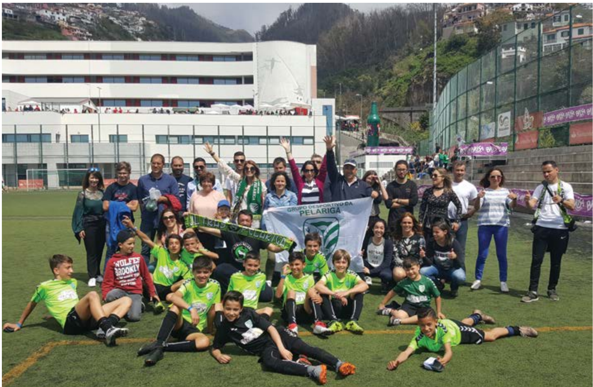
• A comitiva era composta por pais, atletas e equipa técnica que, durante uma semana, festejaram no Complexo do Marítimo, no Funchal, finalizando só com vitórias e sem qualquer golo sofrido em oito jogos