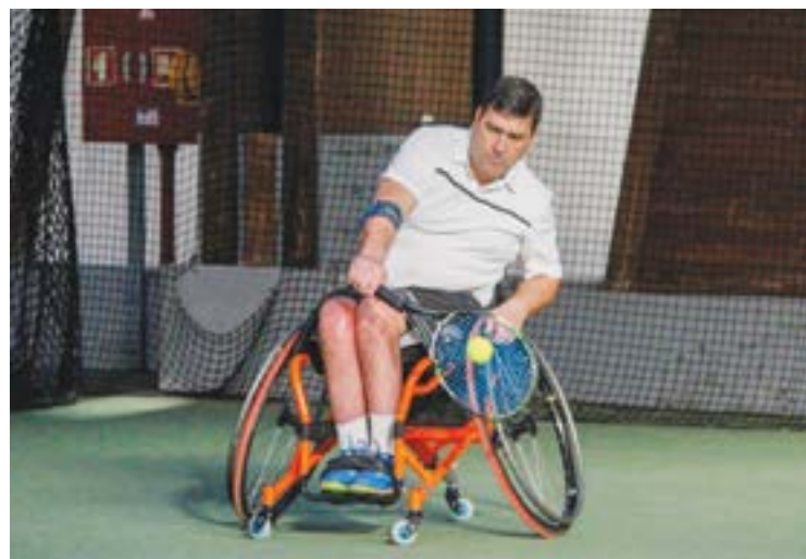
• A "Federação não tem poder para comportar tal esforço financeiro"

O "pedido de Apoio Institucional para financiar a participação em provas internacionais ao longo de 2018", é feito a instituições, empresas, entidades públicas e privadas, "tendo consciência dos