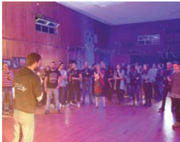
• A Sketch (Re)União das Artes volta a realizar-se na ADAC