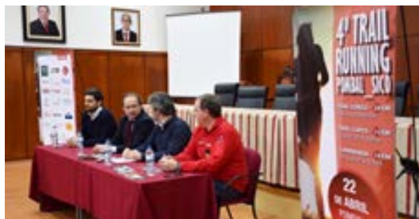
• Organização prevê que possam estar mais de 800 atletas